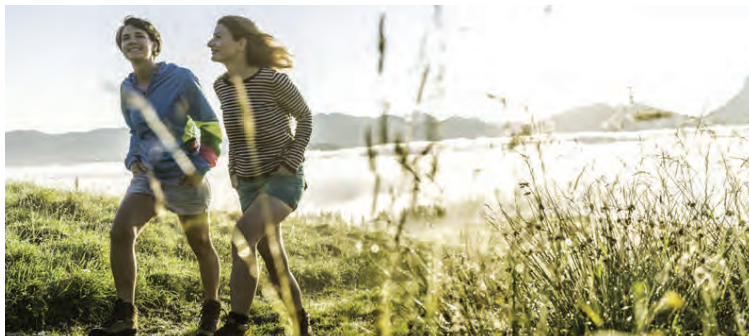
Göngur utandyra bæta heilsuna.

Skynsamlegt er að fá einhvern með í gönguna; vin eða maka. Sé maður einn á ferð er gott að hlusta á tónlist, það léttir á göngunni og tíminn líður hraðar. Best er að hreyfa sig á hverjum degi. Gangan kemst smátt og smátt upp í vana sem fólk vill ekki vera án.