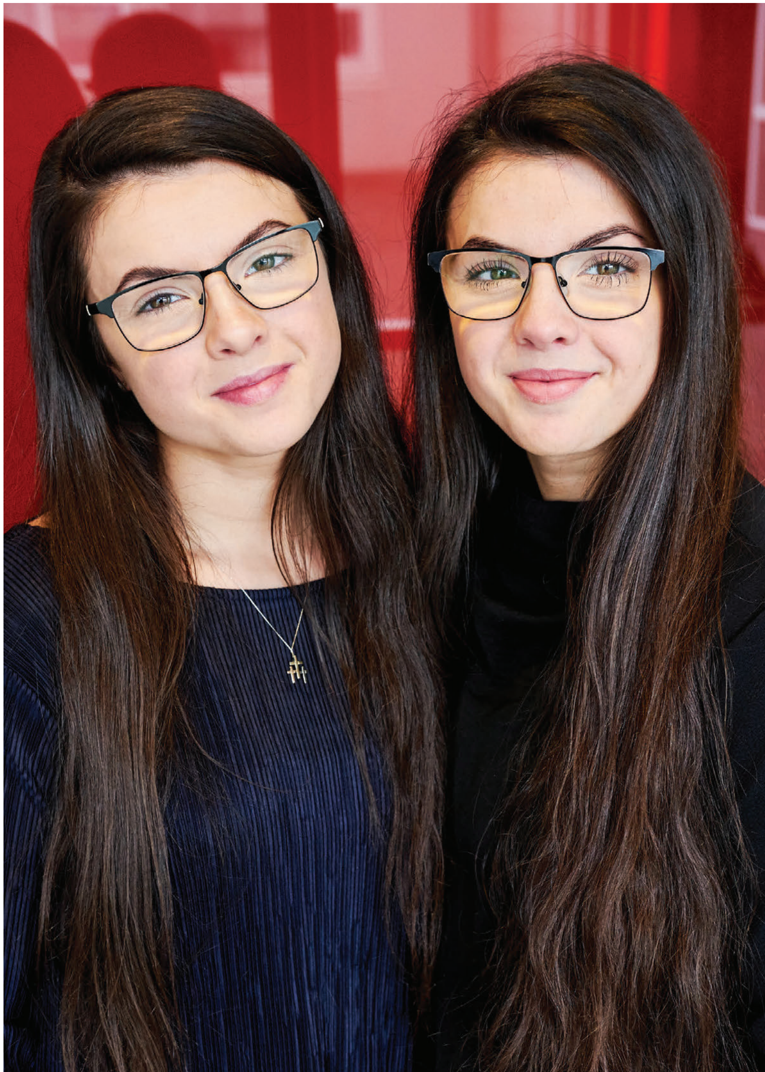
Þær Ósk og Thelma kenna báðar við Grunnskólann í Sandgerði. Þær stefna báðar á innanhússarkitektúr í haust.