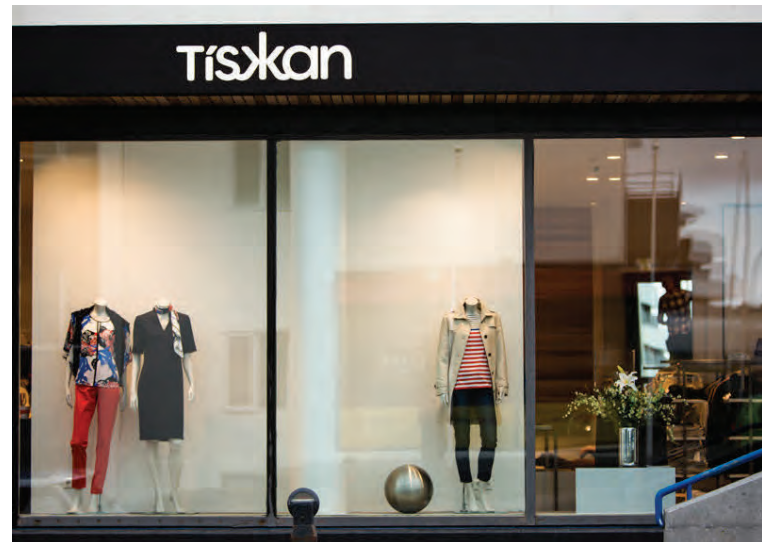
Tískan er ung og fersk, spennandi og ný og von er á mörgum nýjum merkjum.

Tískan er í Skipholts 21, á horni Skipholts og Nóatúns. Sjá nánar á tiskan.is