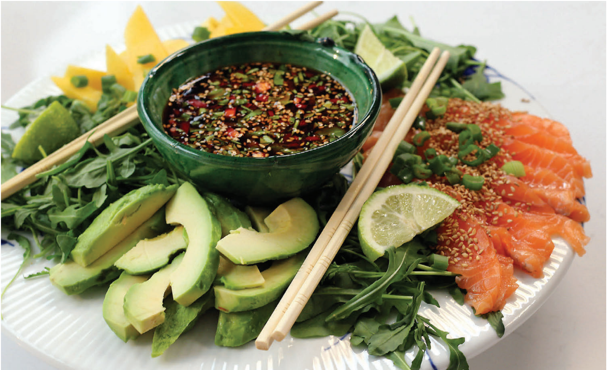
Sashimi-salat, einföld uppskrift að sumarlegu sushi sem er tilvalið sem forréttur eða léttur aðalréttur.