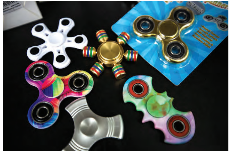
Fidget spinner var tilnefnt skrifstofuleikfang ársins 2017 af Forbes.