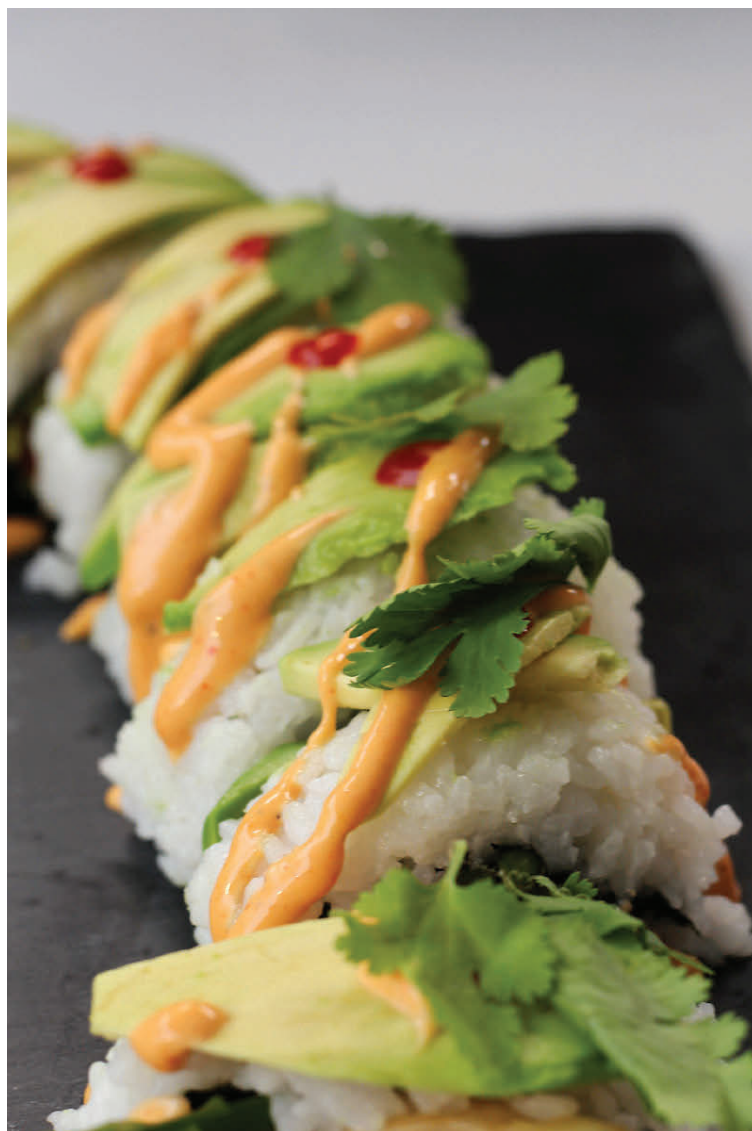
Rúllan er skreytt með lárperu, chili-majónesi og kóriander.

Skolið hrisgrjónin mjög vel, mér finnst best að skola þau í góðu sigti. Það tekur svolítla stund eða um 5 – 7 mínútur. Leggið hrisgrjónin í ibleyti í köldu vatni í um það bil tvær klukkustundir, skiptið um vatn 2 – 3 sinnum. Setjið hrisgrjónin út í kalt vatn í þykkbotna pott og látið suðuna koma upp. Lækkið hitann þannig að rétt malli og sjóðið í 20 mínútur við lágsta suðuhita.