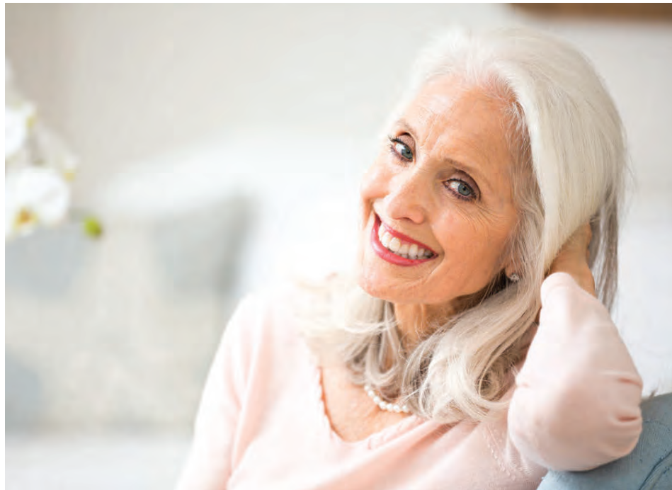
Það eru margar sögusagnir um tíðahvörf. Flestar eru bara vitleysa.

Algengt er hjá nútímakonum að eiga barn um og yfir fertugu. Vísindamenn benda á að erfitt getur