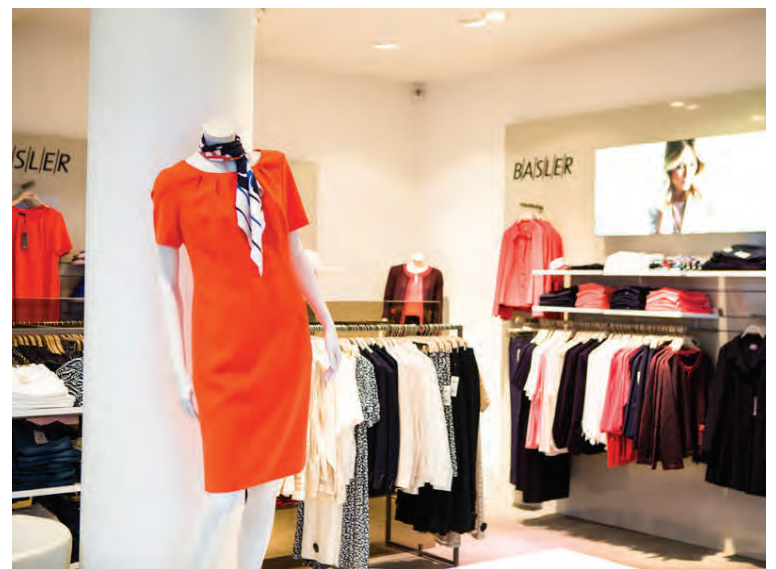
Meðal vörumerkja í Tískunni eru Basler og MaxMara í sex mismunandi línur.