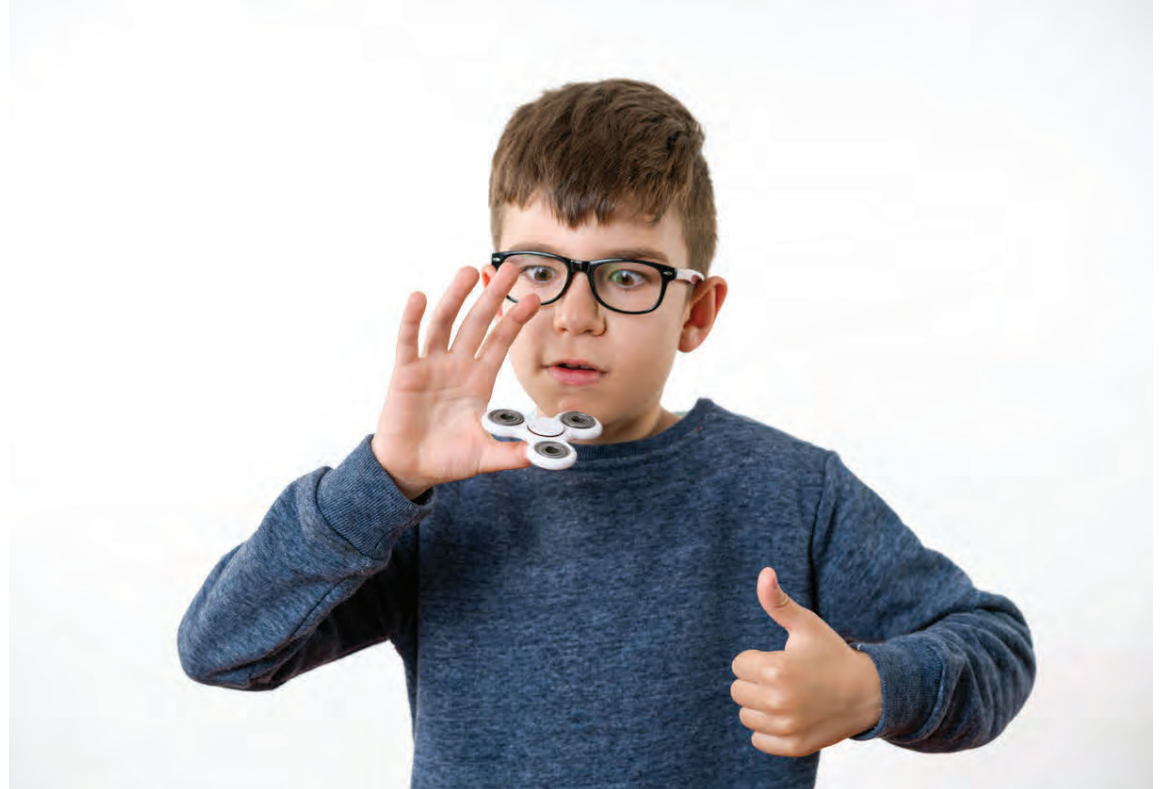
Skemmtilegast er að láta leikfangið snúast hratt á fingurgómunum og jafnvel nefbroddinum.