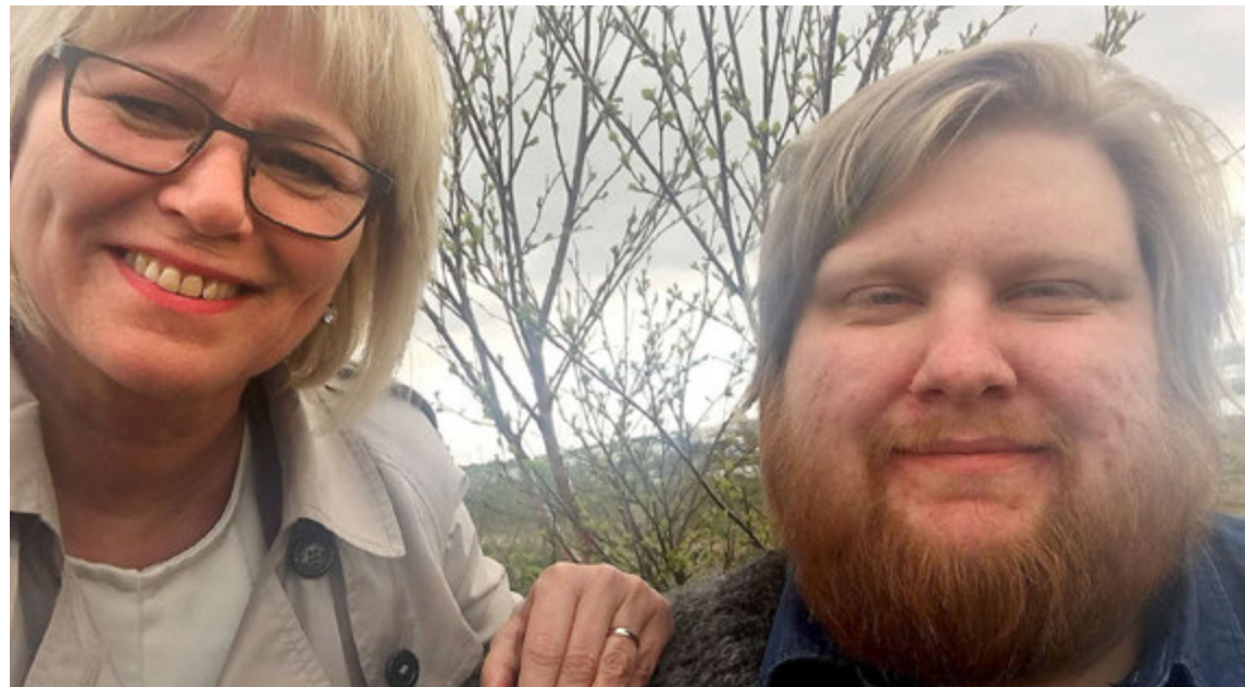
Valdimar tekur vel í að semja baráttulag fyrir Oddnýju og Samfylkinguna.

Já, ég er nú þegar kominn með helling eins og þú heyrir. Þannig að ég get reddað því.