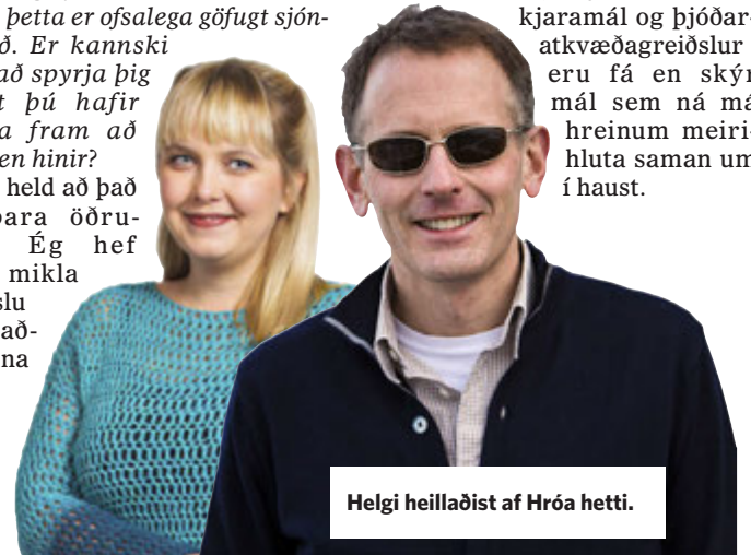
Helgi heillaðist af Hróa hetti.

kjaramál og þjóðar- atkvæðagreiðslur eru fá en skýr mál sem ná má hreinum meirihluta saman um í haust.