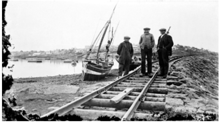
1918-1920, þrír karlmenn standa á Grandagarði á jarnbrautarteinnum sem lágu út í Örfirisey. Í fjöruborðinu liggur seglskúta, Drangey BA5.