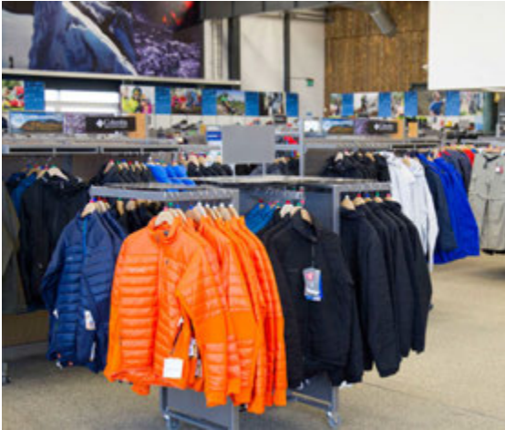
Í Ellingsen er mikið úrval af fallegum útivistarfatnaði.