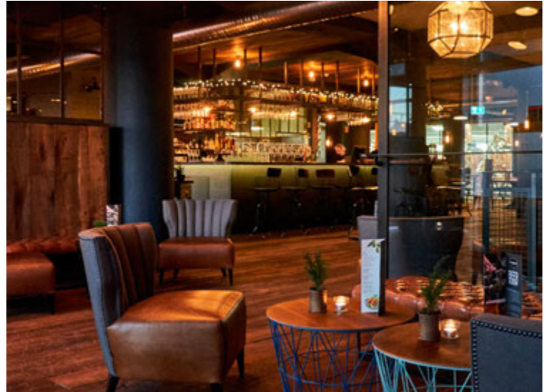
Að blanda saman brugghúsi og bistrói er þekkt út um allan heim.