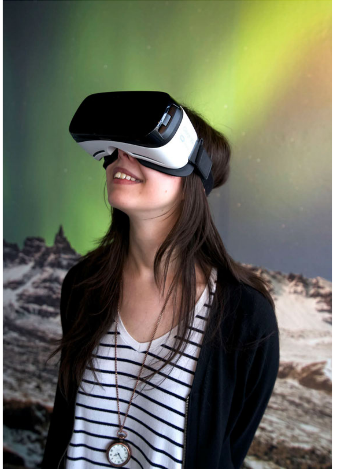
Gestur Aurora Reykjavík nýtur norðurljósanna í sýndarveruleika.