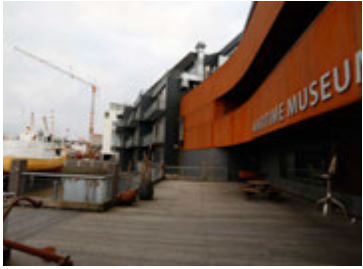
Sjóminjasafnið var sameinað öðrum borgarsögnum undir nafninu Borgarsögusafn Reykjavíkur árið 2014.