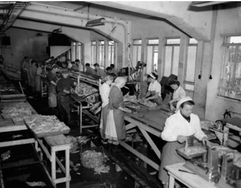
1950-1960, fiskvinnsla hjá Bæjarútgerð Reykjavíkur, BÚR við Grandagarð. Í þessum vinnslusal er í dag rekið Sjóminjasafn Íslands.

1960 var búið að byggja verbúðirnar löngu, sem eru svo einkennandi fyrir Grandann. Þær voru mjög mikilvægar því þeim var ætlað að vera brimbrjótur og veita skjól og þar höfðu sjómenn aðstöðu til að geyma veiðarfæri og jafnvel báta.