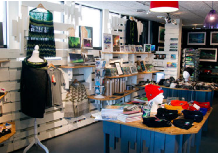
Mikið úrval af handunni íslenskrí vöru er í boði.