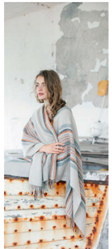
Falleg hönnun frá Farmers Market.