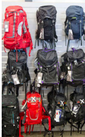
Vandaðir bakpokar fyrir ferðalagið fást í Ellingsen.