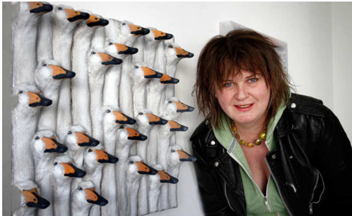
Hulda segist þurfa að vera í grófu umhverfi og að hún muni líklega hrökklast í burtu af Grandanum ef hann verður mikið fínt en hann er núna.

„Í Vestmannaeyjum er frábært að vera vegna þess að þar, eins og á Grandanum, er maður svo nálægt öflugum athafnalífi. Efníð er mjög sjávar tengt og það hefur kannski eitthvað smitast inn í vinnuna, það að hafa verið í kringum þetta athafnalíf.“