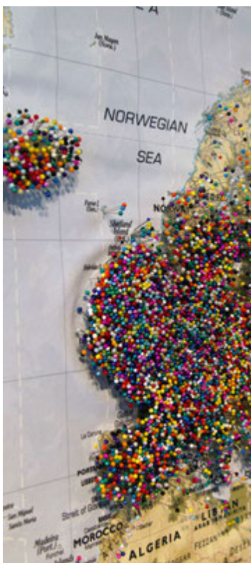
Eins og sjá má koma gestirnir viðsvegar að.