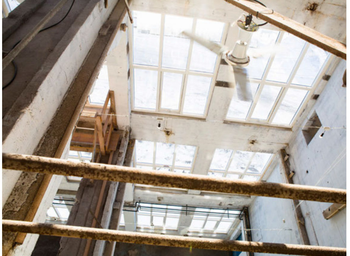
Verksmiðjan átti að geta unnið úr hátt í 700 tonnum af síld á sólahring og framleitt bæði mjöl og lýsi.