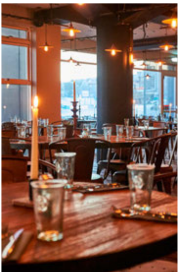
Bryggjan Brugghús starfrækir bjórskóla í samstarfi við Bjórákademíuna.