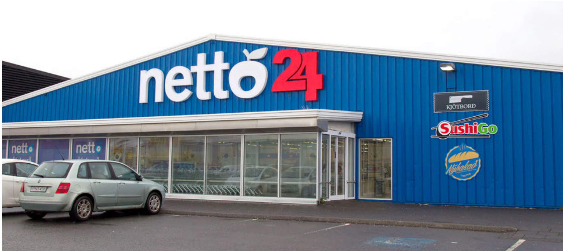
Nettóverslunin á Granda er við Fiskislóð. Verslunin er opin allan sólarhringinn.