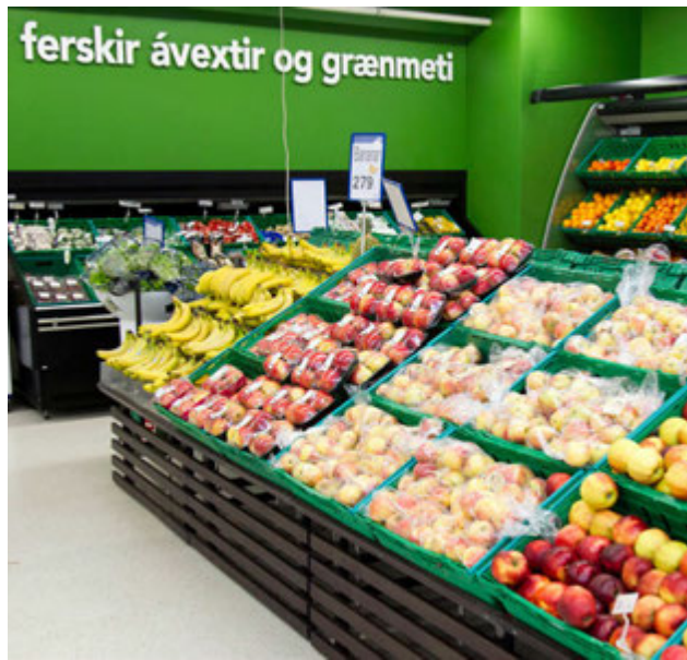
Ferskir ávextir og grænmeti í miklu úrvali.