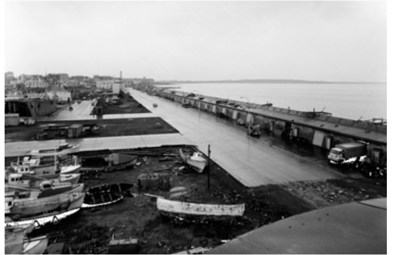
Um 1960. Verbúðir við Grandagarð. Skip við bryggju og bátar uppi á landi.