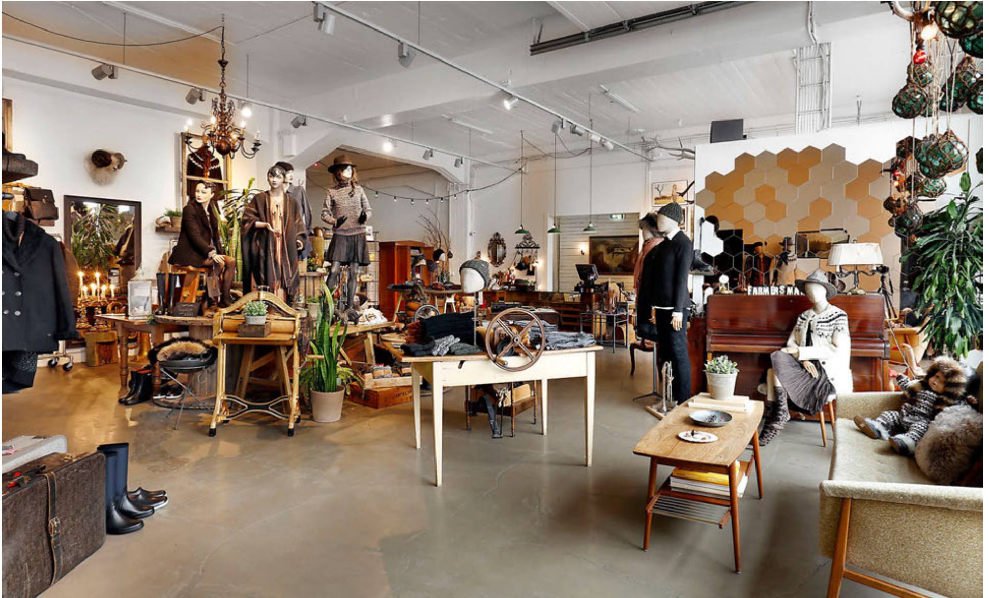
Verslunin Farmers & Friends er afar falleg og þangað er skemmtilegt að koma enda gaman að skoða þá fjölbreyttu hönnunarvöru sem þar er að finna.