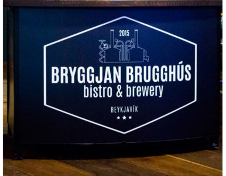
Hægt er að leigja dætur á Bryggjunni Brugghúsi fyrir veislur og stærri viðburði.