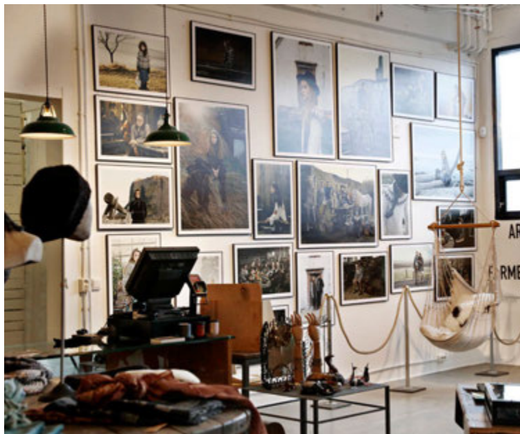
Í versluninni er einn veggur sem lagður er undir sýningar af ýmsu tagi. Um þessar mundir prýða vegginn auglýsingamyndir Ara Magg fyrir Farmers Market.