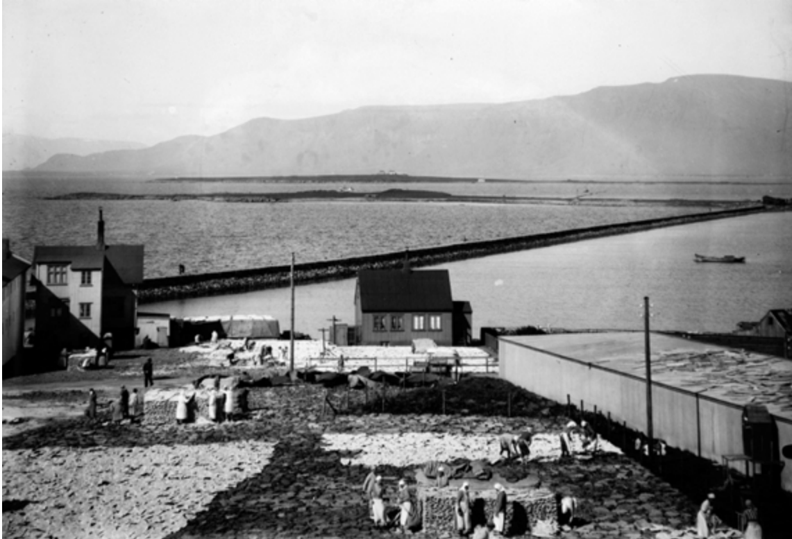
Um 1930, konur við saltfiskverkun á stakkstæði Alliance við Mýrargötu. Í baksýn eru hús við Mýrargötu, fjær er Grandagarður og Örfirisey.