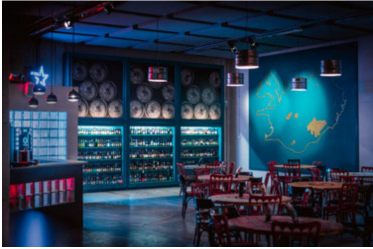
Í Ægisgarði eru bjór- og skemmtanamenningu Íslendinga gerð skil á ýmsan máta. Þar er eitt stærsta bjórsafn landsins til húsa og ýmsir munir til sýnis sem tengjast skemmtanasögu landans.