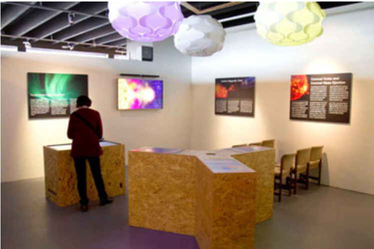
Eitt sýningarherbergja Aurora Reykjavík.