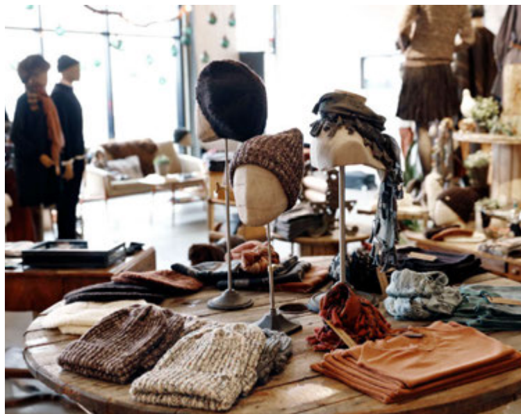
Ávallt bætist í úrvalið hjá Farmers Market.

Ávallt bætist í úrvalið hjá Farmers Market. „Undanfarið hafa verið að bætast við nýjungar í flesta flokka vörulínunnar okkar. Til dæmis undirföt, peysur, skyrturnar o.fl. Fyrir sumarið er svo væntanleg lítil sumarlína fyrir dömur sem ég hef verið að vinna að undanfarið og er mjög spennandi yfir.“