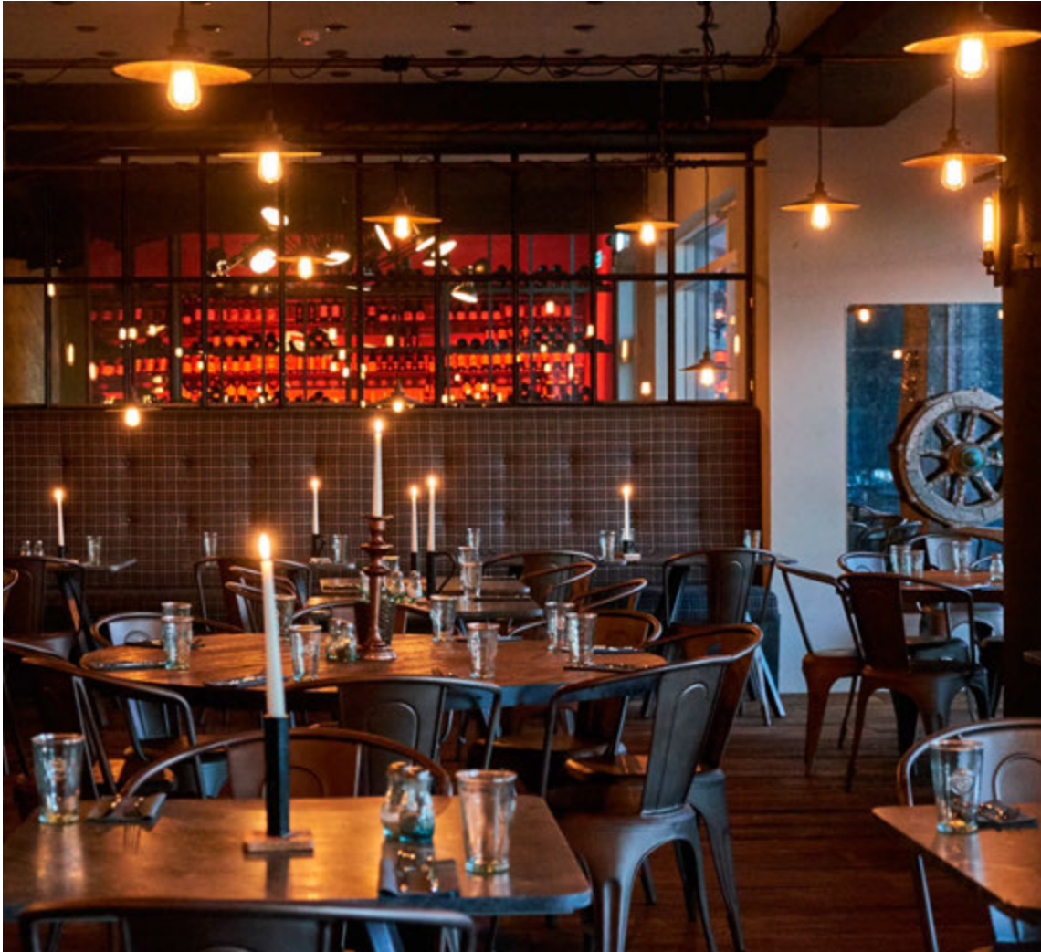
Brugghúsið sjálf leikur stórt hlutverk í útliti Bryggjunnar.