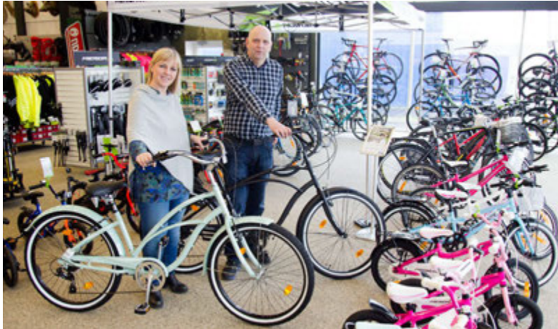
Ellingsen leggur áherslu á að bjóða gæðareihjól fyrir allan aldur. Hjólin eru þýsk og afar vönduð.