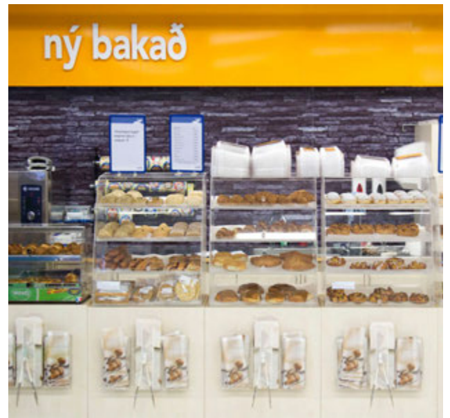
Í Nettó á Granda er bakað á staðnum.