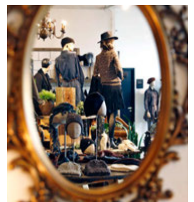
Verslunin er skemmtilega upp sett.