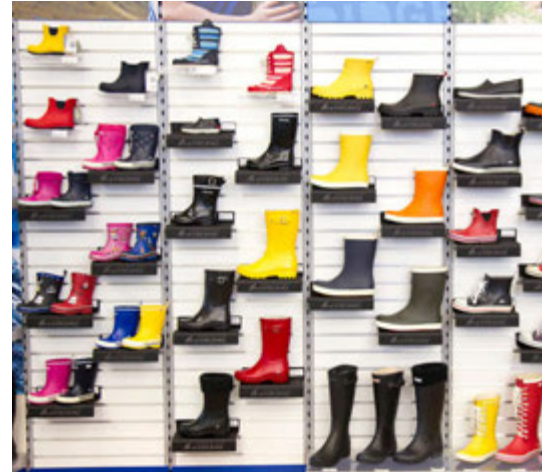
Stígvél á alla fjölskylduna.