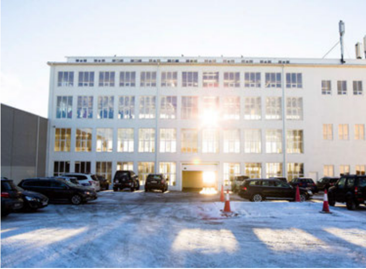
Bygging síldarverksmiðjunnar var að hluta til fjármögnuð með Marshall-aðstoð Bandaríkjanna eftir seinni heimsstyrjöld og þaðan er nafnið komið. Húsið mun lifna við í haust þegar Nýlistasafnið, Kling og bang og Ólafur Elíasson myndlistarmaður hefja þar starfsemi.