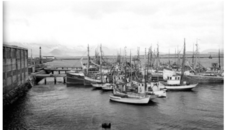
1947, Bæjarútgerð Reykjavíkur, BÚR, Grandagarði 8. Við bryggju liggur fjöldi vélbáta og skipa.