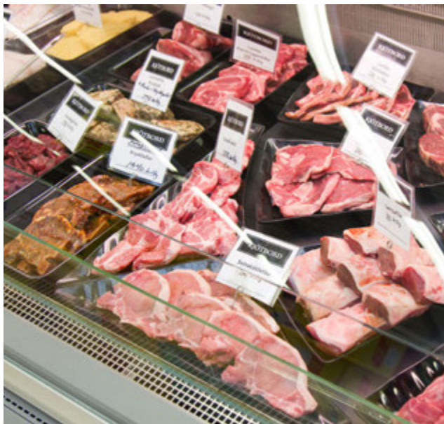
Kjötborðið er spennandi með úrvali af kjöti og fiski.