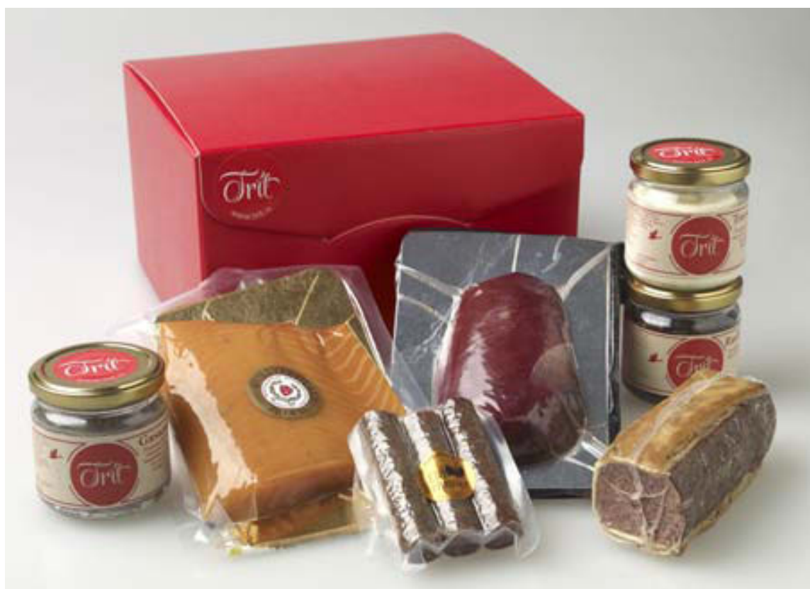
Körfurnar eru ólíkar að uppbyggingu og verðbilið breitt. Ýmsar samsetningar má sjá á www.trit.is .

næstu vikum. Þar er um ræða gæsaliðarmús, eða foie gras, og gæsaconfit, sem eru gæsælari steikt í andafitu og tætt niður í krukku. Þetta er einkar ljúffengt til dæmis með rauðlaukssultu. Pylsurnar sem Trít býður upp á koma úr Skaftafelli og eru í tak-