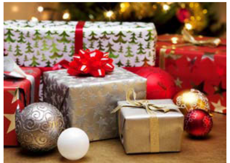
Mismunandi er hversu miklu Norðurlandþjóðirnar eyða í jólagjafir.