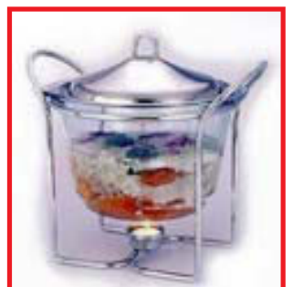
TARÍNUR M/HITARA & AUSU FRÁ KR.11.595