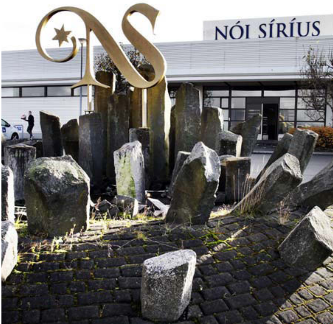
Gjafakörfurnar frá Nóa Síríusi hafa verið vinsælar í gegnum tíðina.