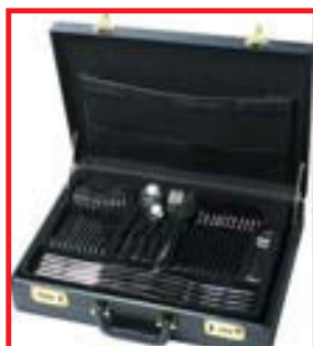
HNÍFAPARATÖSKUR F/12 M/FYLGJH. FRÁ KR.24.995