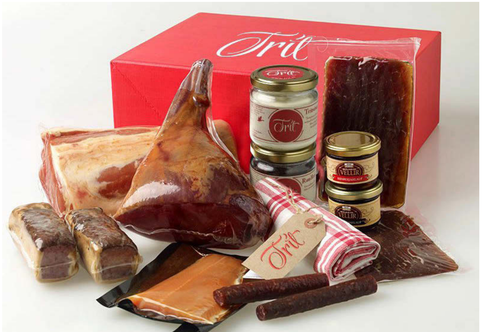
Matarkörfurnar frá Trít eru gómsætar og glæsilegar. Hér er Hátíðartrít, vegleg gjöf sem býður upp á allt það helsta sem tengist íslenskri jólahefð.

Trít er sjálft að setja á markað vörur úr gæsaafurðum á