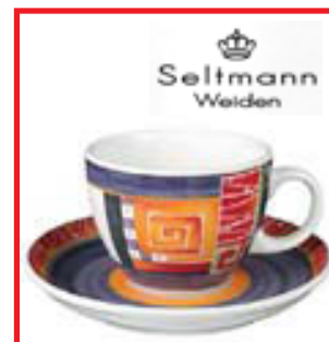
SELTMANN BOLLAR -15%

MIKIÐ ÚRVAL AF VÖRUM Á ALLT AÐ 50% AFSLÆTTI