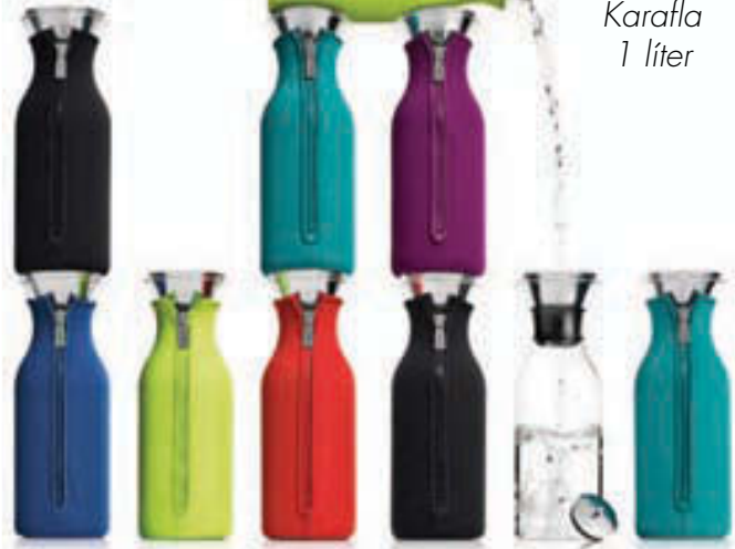
Karaffa 1 líter