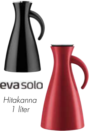
eva solo Hitakanna 1 líter