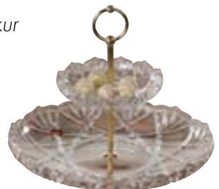
2ja hæða á fæti

Grillpanna og steypujárnspottur margir litir