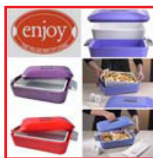
ENJOY HITAFÖT -20%