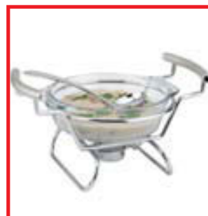
SÓSUSKÁL M/HITARA & AUSU KR.7.995