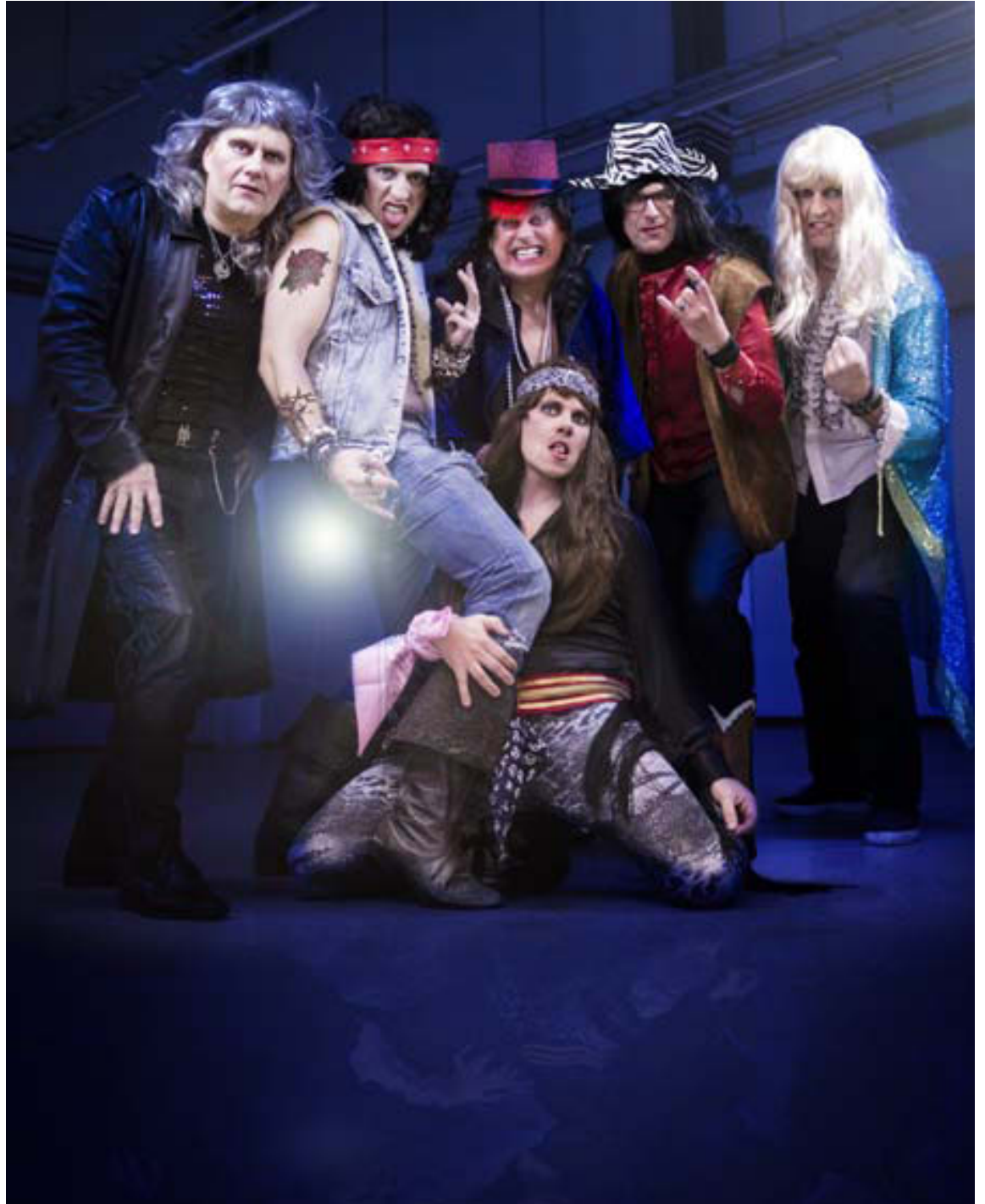
N1 lagði mikinn metnað í bæði lag, búninga og sviðsframkomu árið 2013.

Hún segir löngu ljóst að verkefnið hafi jákvæð áhrif á vinnustaði og fólk sem vinnur þar. „Þessi keppni er líka frábær leið til þess að kynna fyrirtækið,