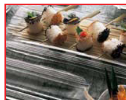
IVV METROPOLIS -15%