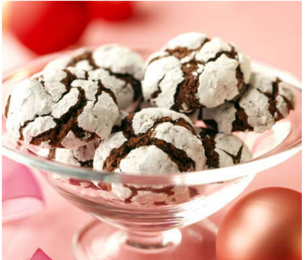
Brownie-smákökur sem slá munu rækilega í gegn á kaffistofunni.

Uppskrift fengin af vefsíðunni: www.homecooking.about.com