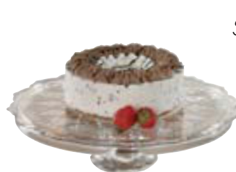
36sm á fæti