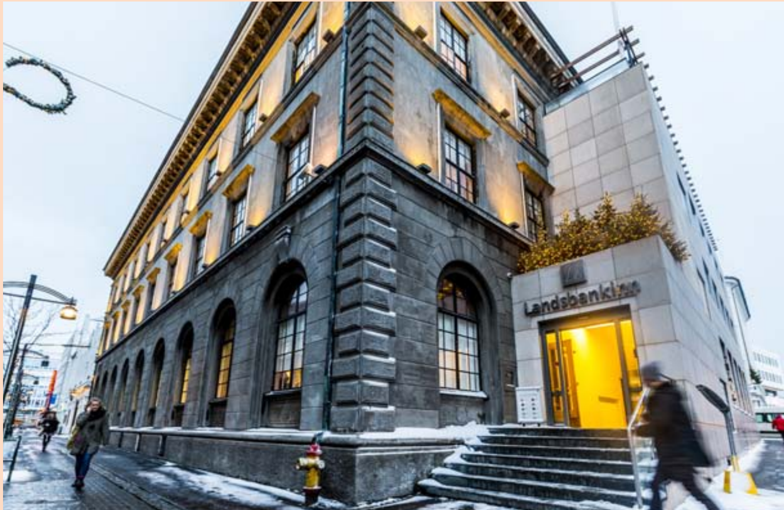
LANDSBANKINN Í JÓLABÚNINGI Fólk á hraðferð í jólaönnum við höfuðstöðvar Landsbankans í Austurstræti í Reykjavík.

„Á tyllidögum segja stjórnendur ríkisbankans að þeir vilji vera í fararbroddi hvað varðar ábyrgar fjárfestingar á Íslandi. Ógagnsætt söluférlí á greiðslumiðlunar-fyrirtækinu Borgun hefur hins vegar valdið bankanum orðsporshnekki, meðal annars vegna þess að alls endis er óvíst hvort bankanum hafi tekist að hámarka verðmæti eignarhlutar síns,“ segir einn dómnefndarmaður í umsögn sinni og bendir á að bankarnir hafi ekki