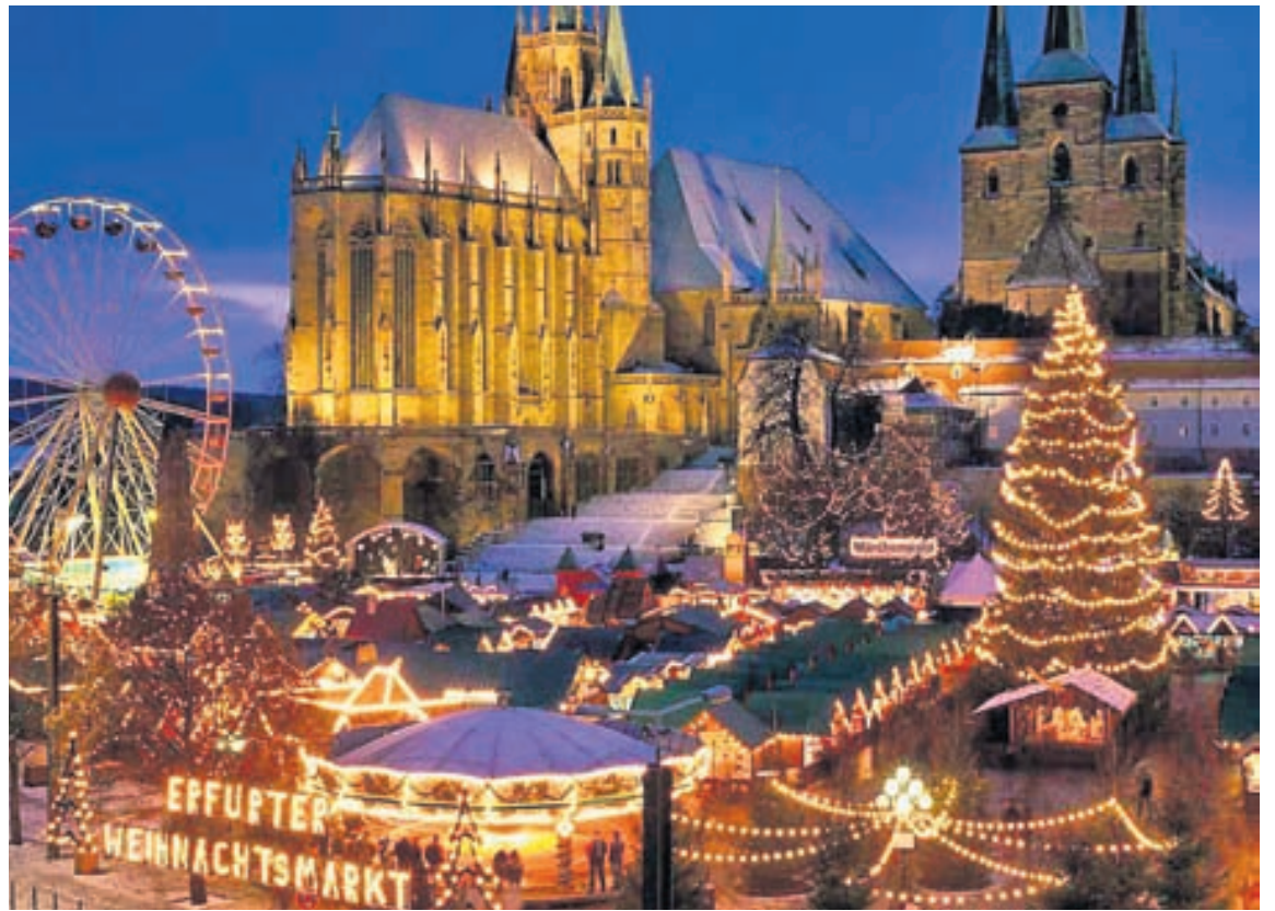
Einstaklega fallegur jólamarkaður í Erfurt í Þýskalandi. Það þykir ævintýri líkast að koma þangað.

Borgin liggur á milli Dortmund og Dresden, og þar er einn af flottustu jólamörkuðum Þýskalands. Í gamla bænum eru sögulegar byggingar eins og St. Mary-dómkirkjan og St. Severus-kirkjan sem standa nálægt hvor annarri en umhverfið þar er gríðarlega fallega skreytt með alls kyns ljósum og jólasakrauti. Meðal þess sem sjá má er 25 metra há skreyttur pýramídi. Fyrir utan allar falletu skreytingarnar er hægt að gera góð kaup í alls kyns góðgæti á jólaborðunum. Jólaveinninn býður upp á leiðsögn um Erfurt-jólaþorpið.