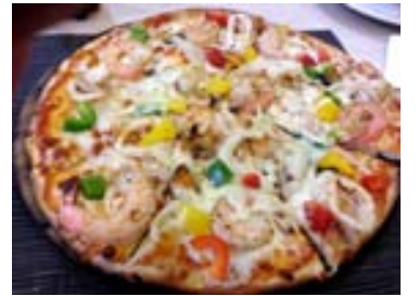
Ljúffeng sjávarréttapítsa á Pattaya-ströndinni á Taílandi.

inn maður og kaftaði heillengi við liðið.“