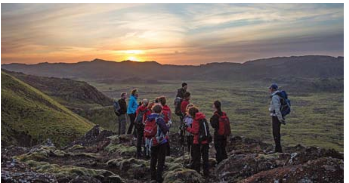
Kynningarfundur á starfi Íslenskra fjallaleiðsögumanna verður haldinn þriðjudaginn 2. desember klukkan 20 að Stórhöfða 33.

Fleiri sérhæfðir hópar eru starfræktir hjá Íslenskum fjallaleiðsögumönnum, svo sem Skíðagengið, sem hugsað er fyrir vant svigskíðafólk sem langar að vikka