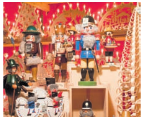
Listafólk og handverksmenn selja gripi sína á jólamörkuðum. Þar fæst margt fallegt.