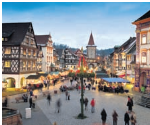
Fólk flykkist á jólamarkaði í Þýskalandi í desember, enda margt skemmtilegt að sjá og gera.