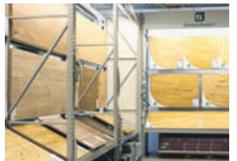
Austurrískt hágæða spónlagt smelluparket frá Steirer er til í miklu úrvali hjá BYKO.