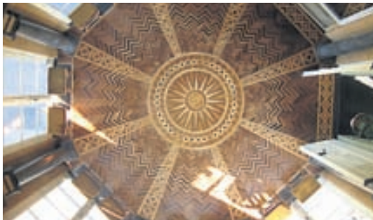
De Notaler í Antwerpen, skáli byggður á 18. öld með fagurlega lögðu parketi.