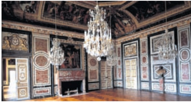
Fiskibeinamynstur í einu herbergja Versalahallar. Þegar marmaragólf í salarkynnum var skipt út í höllinni á 17. öld voru gólf hallarinnar fagurlega lögð með viðarborðum í ýmis mynstur. Parkett komst í tísku í höllum og í heldri manna húsum.

Fiskibeinamynstur, tígla-mynstur og stjörnur mátti sjá víða í höllum og á heldri manna heimilum. Efnaminna fólk brá á það ráð að mála mynstur á gólfborðin hjá sér. Með iðnbyltingunni um