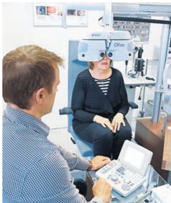
Allar sjónmælingar eru framkvæmdar í versluninni með fyrsta flokks tækjum og áhersla lögð á að hver viðskiptavinur fái góðan tíma.

Ýmis önnur tilboð í tilefni afmælisins. Sjón er sögu ríkari.