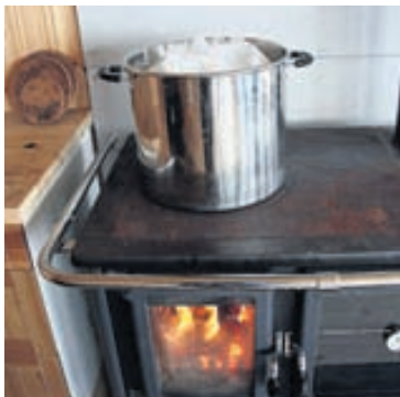
Í skálanum við Nordenskjöld-jökulinn þurfti að ná í is úr jöklinum til að bræða sem drykkjar- og saunuvatn.