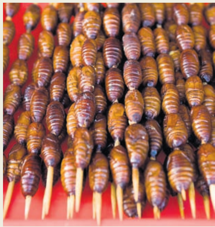
Púpur silkiorma þræddar upp á spjót á Donghuamen-næturmarkaðinum í Kína.