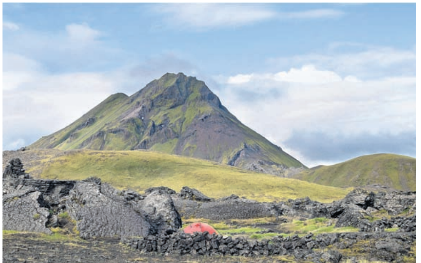
Tjald í Hvanngili með Stóru-Súlu í baksýn.

Bókin verður einnig fáanleg erlendis sem og á Amazon og ferðabókunarvefjum.