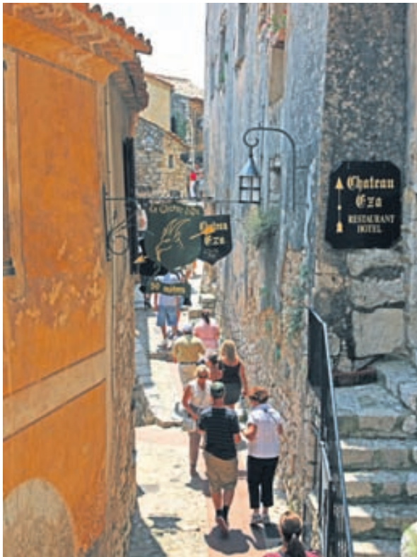
Bærinn Eze á frönsku rivierunni. Þangað ættu matgæðingar að fara.