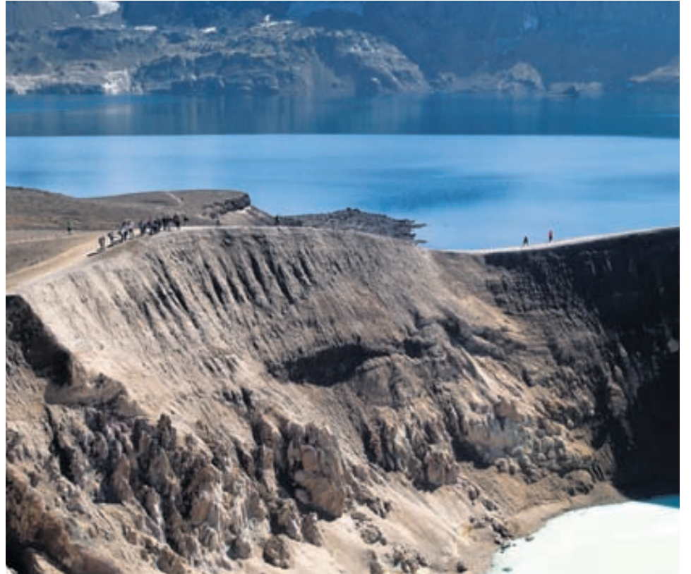
Ferðamenn við Víti.