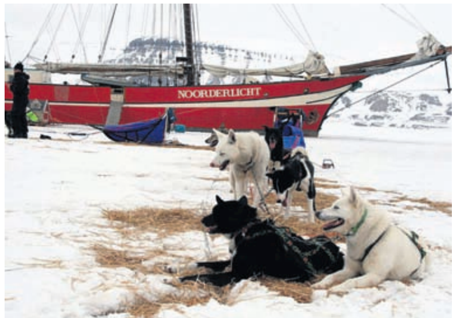
„Hótel“ Noorderlicht er í raun skúta sem frosin er föst í firði. Í forgrunni er eitt hundateymi sem hvílir lúin bein.