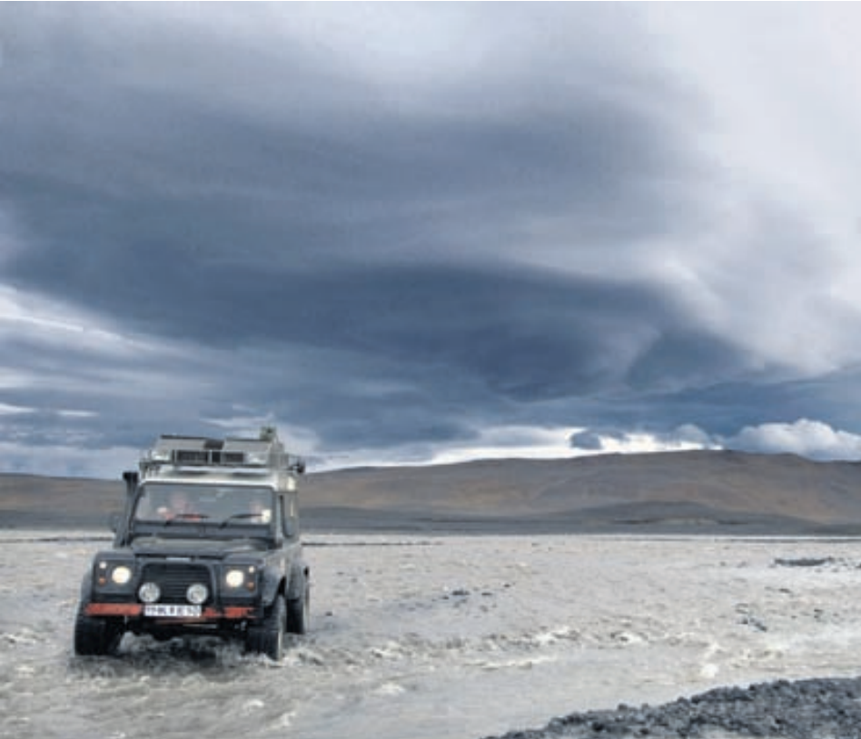
Farið yfir Blöndukvíslar vestan við Hofsjökul.