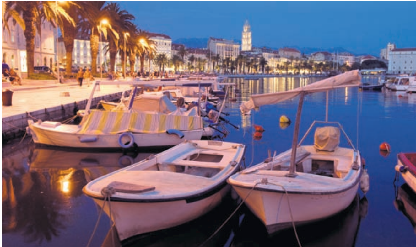
Split í Króatíu. Í Króatíu eru góðar strendur og skemmtilegar borgir og bæir.

► á himneskan mat og útsýni yfir Miðjarðarhafið. Síðan má gera sér ferð á Ajuna niður við ströndina sem er toppveitingastaður.