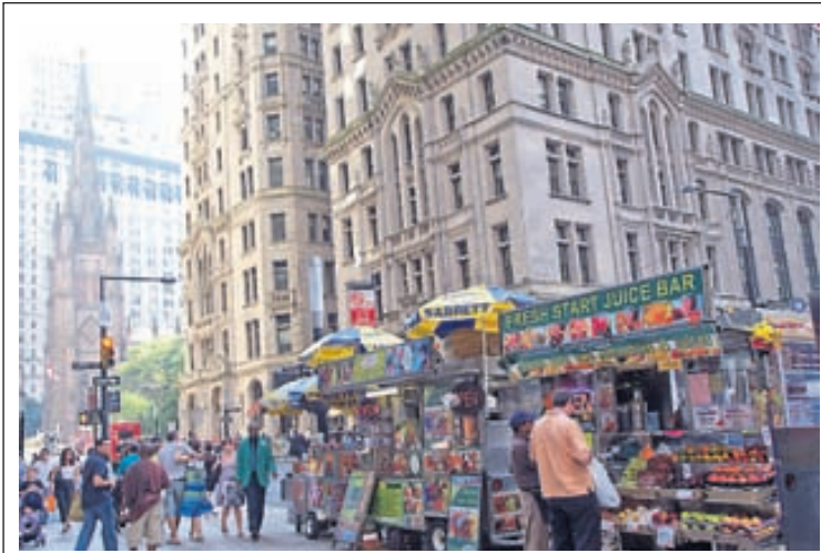
Djúsbar og matsöluastaðir framan við Trinity-kirkjuna í New York.