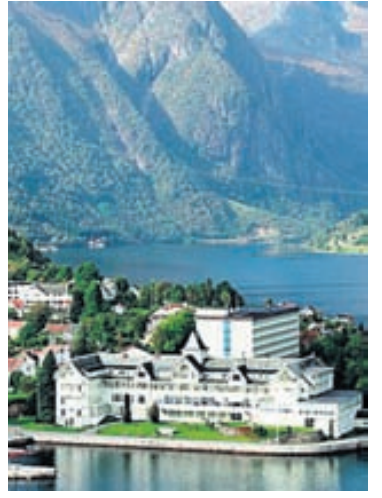
Kviknes-hótelið í Balestrand við Sognefjörð í Noregi.