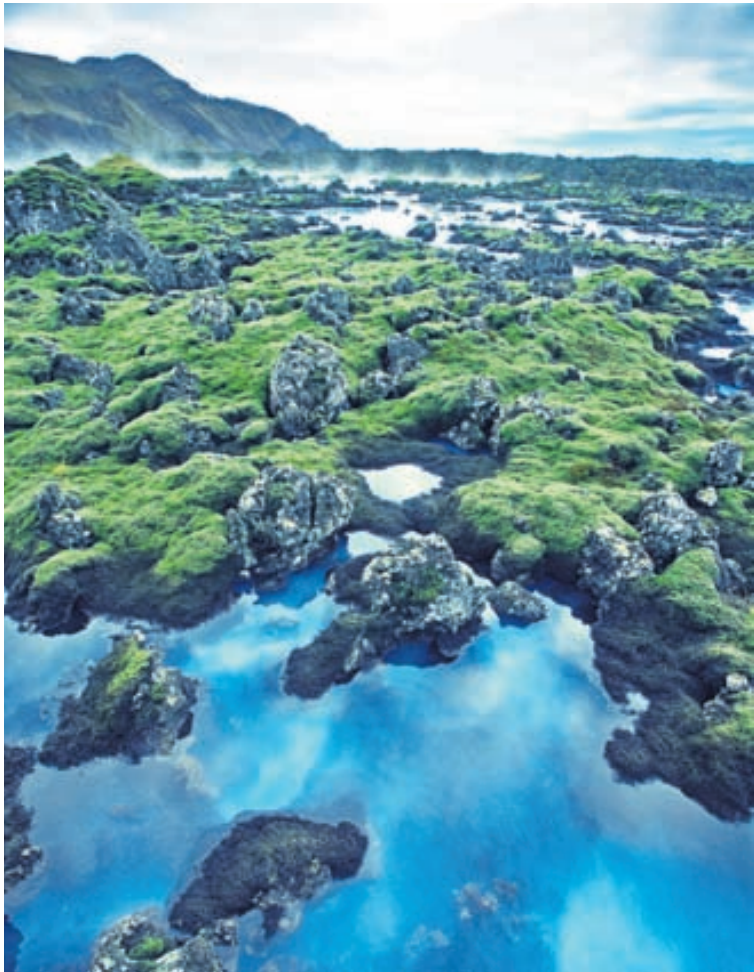
Svartsengi við Bláa Lónið á Reykjanesi.

Ferðalangar velja sjaldan Reykjanesið sem fyrsta valkost þegar ferðast er um landið. Þangað er þó margt áhugavert og skemmtilegt að sækja eins og fallegar strendur, merkar minjar og söfn. Miklar vonir eru bundnar við nýstofnaðan Jarðvang á Suðurnesjum.