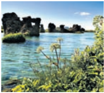
Mývatn um sumar.