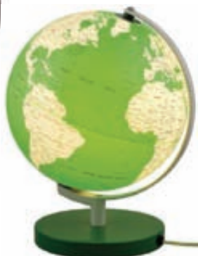
Hnattlíkón í mörgum litum, stærðum og gerðum