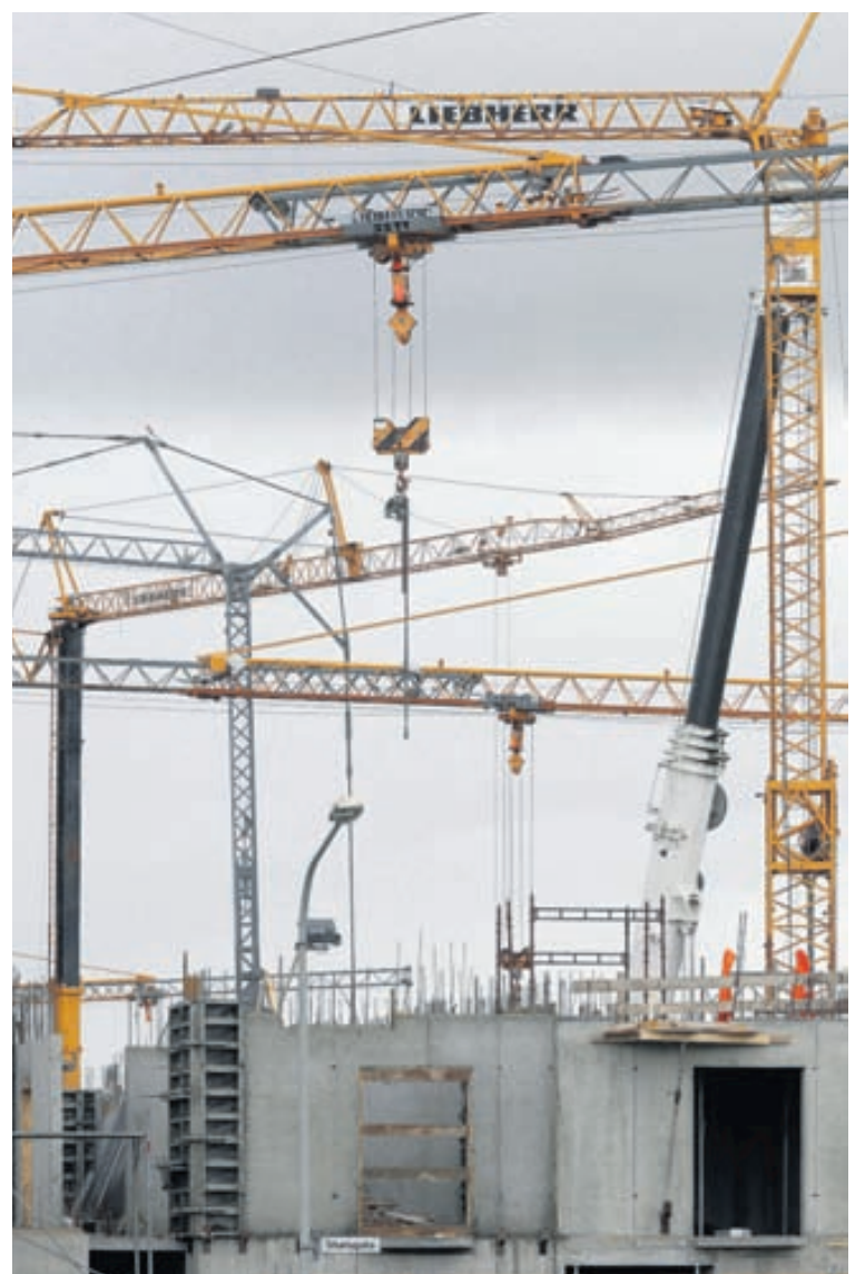
Fjórir kranar frá Örmum ehf. eru nú í Vatnsmýrinni þar sem nýir stúdentagarðar eru í byggingu.

Nánari upplýsingar um kranaleigu og steypumót Arma ehf. má finna á armar.is .