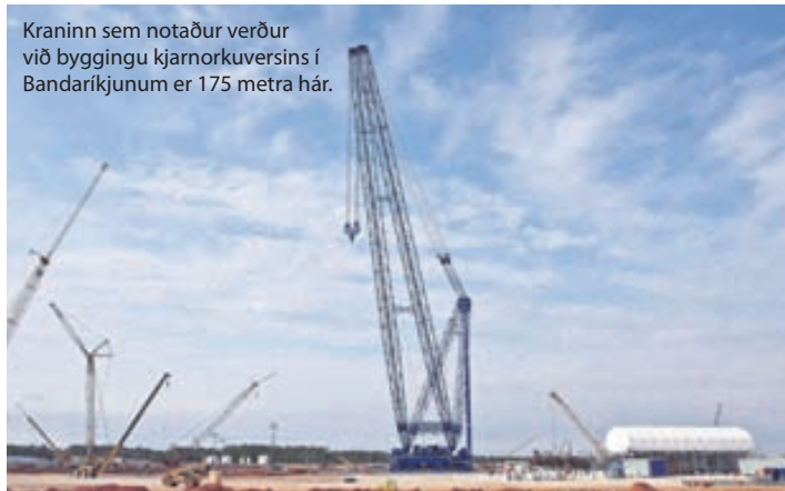
Kraninn sem notaður verður við byggingu kjarnorkuversins í Bandaríkjunum er 175 metra há.

Aðspurður hvort halda eigi upp á afmæli Körfubíla segir Harry að starfsmenn muni lyfta sér upp þegar sumarfríum er lokið „En ef einhver þarf að lyfta sér upp þá er um að gera að hafa samband við Körfubíla.“ Sjá nánar allar upplýsingar á www.korfubilar.is .