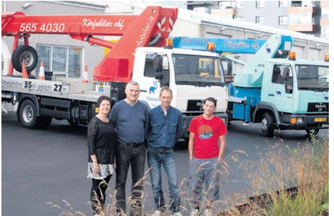
Fjórir starfsmenn starfa hjá Körfubílum, allir með mikla reynslu af vinnu við körfubíla.

„Það er gaman að segja frá því að í júlí síðastliðnum var fyrirtæk-