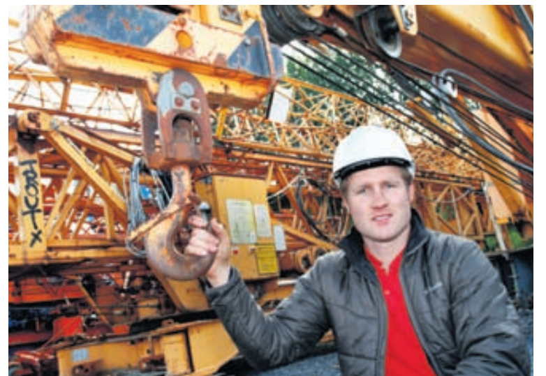
Hallgrímur segir um 95 prósent kranastjórnenda héraðs stýra krönum með fjarstýringu af jörðu niðri og aðeins tvo stýra krönum úr stýrishúsum á toppi krana.

„Góðir dagar fela í sér magnað útsýni í veðurblíðu en í frosti og kafaldsbyl veltir maður því stundum fyrir sér hvers vegna