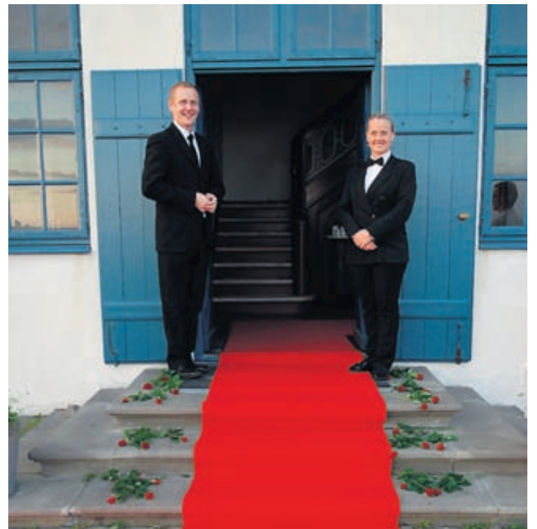
Í Viðeyjarstofu fá brúðhjónin konunglegar móttökur og þar er stjánað við þau í hvívetna.