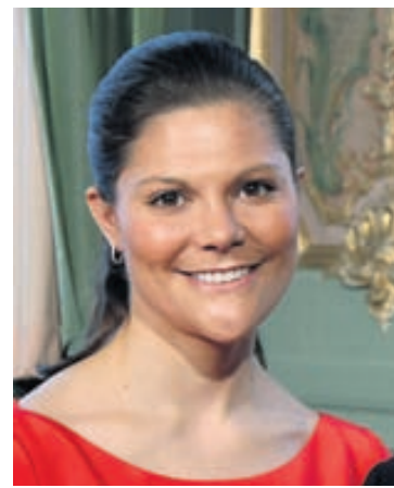
Viktória krónprinsessa er ein þeirra sem hefur borið skart frá Daisy við hátíðleg tilefni.