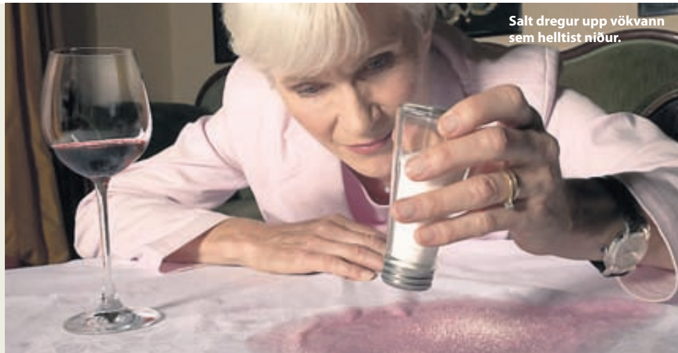
Salt dregur upp vökvann sem helltist niður.

Rauðvínsbletti skal þurrka vel upp með klút eða pappír. Þá má strá vel af salti yfir blettinn en saltið dregur vökvann upp. Ef hvítvín er við höndina er hægt að hella því strax yfir og þurrka svo upp með svampi. Eins virkar vel á rauðvínsbletti að bera uppþvottalög á blettinn og setja í poka. Dúkurinn er síðan þvegin í vél eftir að þessi ráð hafa verið reynd. Sjá Leiðbeiningastöð heimilanna.