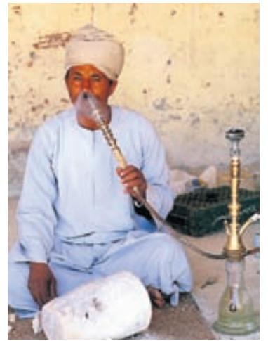
Egyptskur maður með vatnspípu.