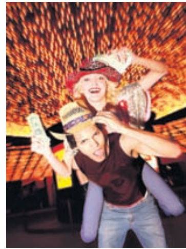
Viva Las Vegas.

þar á milli. Í Vínarborg verður gíst í tvær nætur, þaðan farið til Bratislava í Slóvakíu og Györ í Ungverjalandi, gíst þar aðrar tvær nætur og í lokin er kynnisferð um Búdapest.“