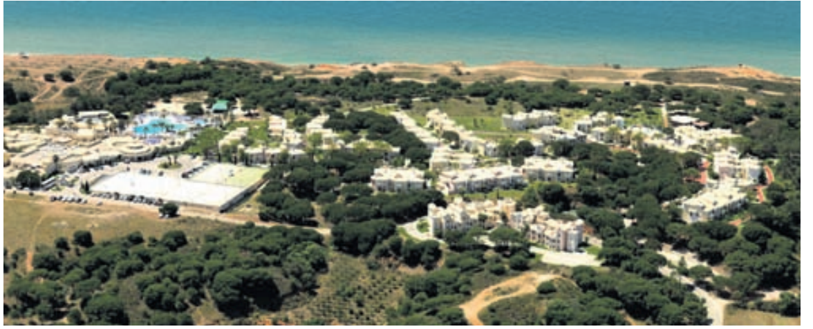
Adriana Beach Club-hótelíð á Algarve er vinsæll valkostur fjölskyldufólks sem kys notalegheit í smáhýsum og líflega afþreyingu í sundlaugargarðinum, en hótelíð stendur einnig skammt frá ströndinni.