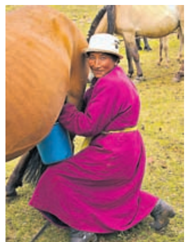
Náð í merarmjólkina.