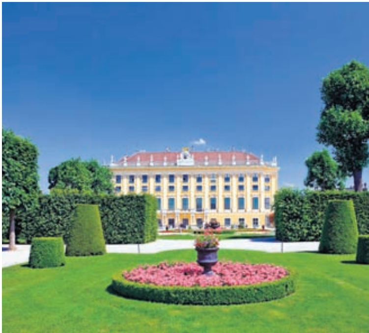
Schönbrunn í Vín er glæsileg bygging með fögrum garði umhverfis.