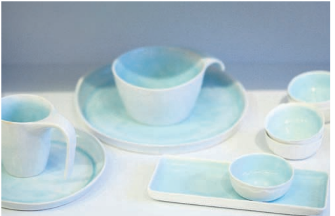
Stellið er hannað með þarfir fólks sem á erfitt með fínhyringar í huga.

Hlíðasmára | / 201 Kópavogur / 534 7777 / www.modern.is