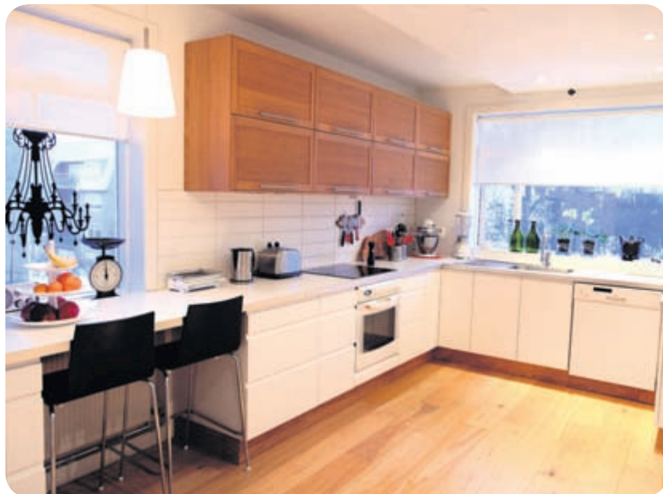
Í eldhúsinu eru meðal annars borðvigt sem Edda keypti í Englandi og önnur sem hún erfði eftir ömmu.