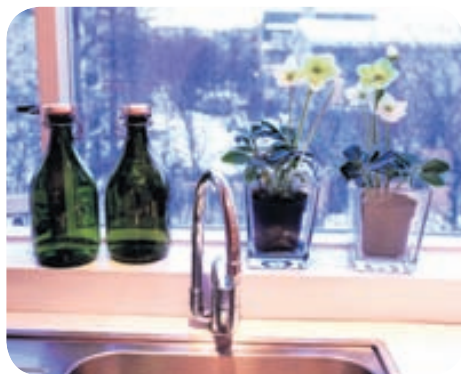
Flöskurnar í eldhúsglugganum voru skildar eftir í bílskúrnun af fyrri eigendum.