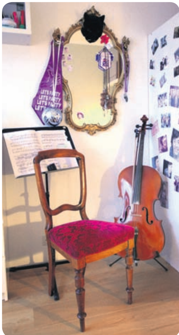
Agnes Edda, ungfrúin á heimilinu, hefur huggulegt í kringum sig.