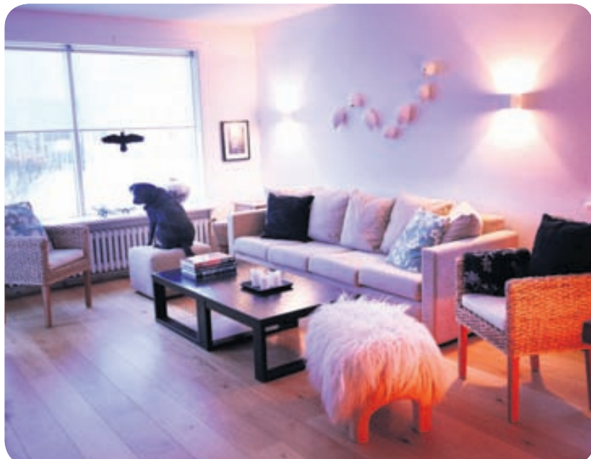
Foreldrar Eddu keyptu sófaborðin tvö áður en hún fermdist. Leirlistaverk ofan við sófann er útskriftarverkefni hennar úr Myndlistarskólanum og gærukollurinn er eftir hana.