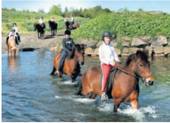
Á hestbaki Það er gaman að ríða yfir vatnsföll.