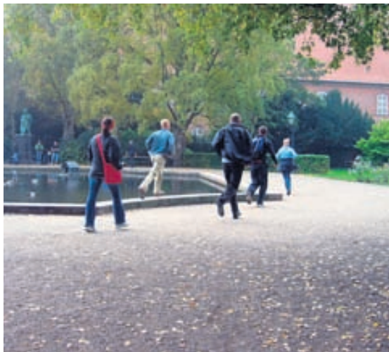
Stokkið af stað Nú gildir að vera fljótur að hlaupa, hugsa og framkvæma.