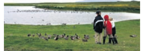
Við Seltjörn Stöðuvötn eru frábær til fuglaskoðunar.