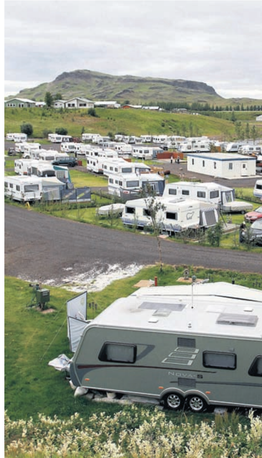
Sterk tengsl Fólk á svæðinu hefur kynnst hvert öðru vel og það gengur á milli hjólhýsa.