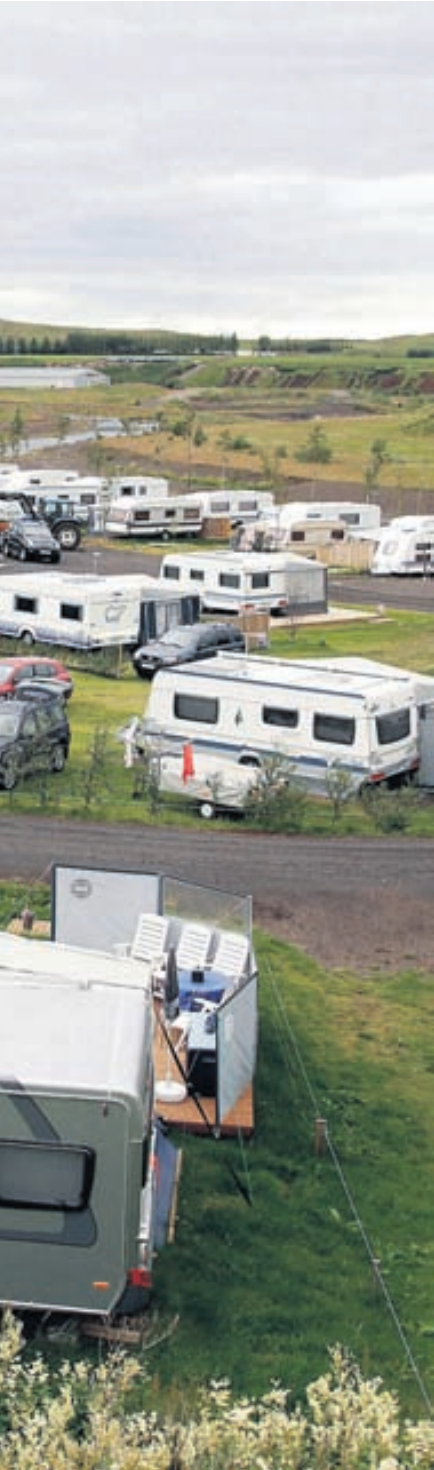
sa og drekkur kaffið á náttfötunum.