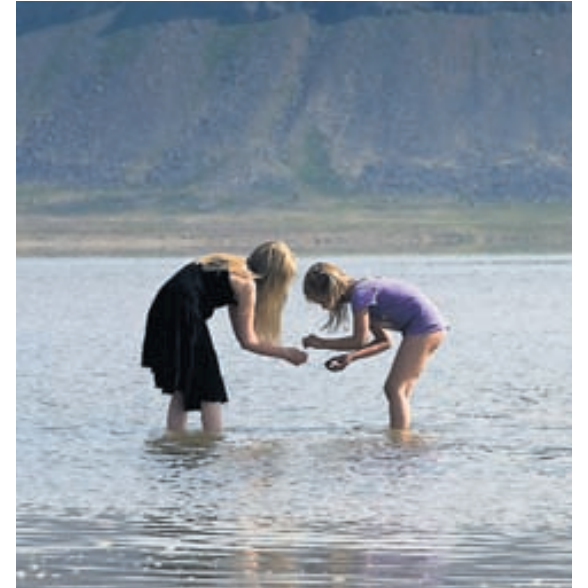
Á Rauðasandi Fjaran er staður uppgötvana.