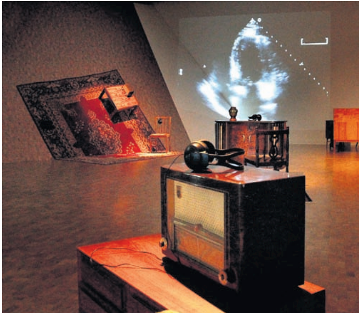
Innsetningin nýtur sín betur hér en í Hafnarhúsinu á sínum tíma að mati gagnrýnanda. Umgjörðin sér síðan um að við gleymum ekki því umróti sem dauðinn skapar í lífi þeirra sem eftir sitja.

Sími: 511 5090 Netfang: einarben@einarben.is Veffang: www.einarben.is