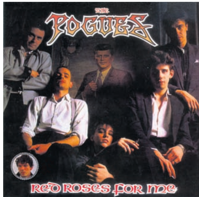
Red Roses For Me, fyrsta plata The Pogues, frá árinu 1984.