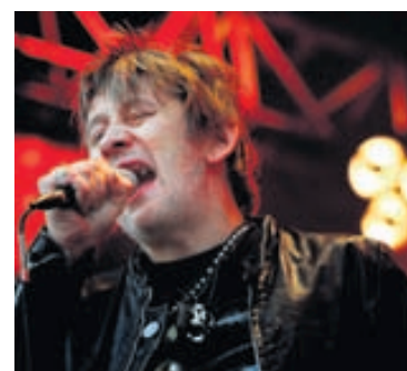
Shane MacGowan á tónleikum, aldarfjórðungi síðar.

Ræflarokkið hafði fyrir löngu útvatnast í nýbylgjuna svokölluðu og nýrómantíkin réði ríkjum á vinsældalistum þegar meðlimir The Pogues röngluðu, ekki líkt og skrattinn úr sauðarlegnum heldur eins og rallhálfir ungpönkarar í gömlukalla-jakkafötum, inn á sjónarsviðið fyrir rétt rúmum aldarfjórðungi. Eins og með allar góðar hugmyndir virkar upphaflegt manifestó Pogues-liða sáræinfalt og fullkomlega lógískt eftir á; að hræra saman kraftinum, ádeilunni og ungæðislegri gleðinni sem fólst í þöknunni við undirliggjandi dramatík aldagamallar írskrar þjóðlagatónlistarhefðar. Liggur í augum uppi, ekki satt? En sú var fráleitt raunin í Thatcher-Bretlandi níunda áratugarins. „Mér fannst fáránlegt að enginn annar væri að gera þetta, þannig að við drifum bara í þessu sjálfir,” sagði höfuðpaurinn Shane MacGowan í kringum útgáfu fyrstu breiðskífu The Pogues, Red Roses for Me, árið 1984.