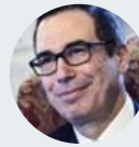
Steve Mnuchin, fjármálaráðherra Bandaríkjanna.

herra lagðist stýrivaxtahækkun Seðlabanka Bandaríkjanna þann 19. desember illa í fjárfesta. Ekki bættu úr skák ummæli Jays Powell seðlabankastjóra um að engin ástæða væri fyrir bankann til þess að draga hægar úr skuldabréfakaupum sínum.