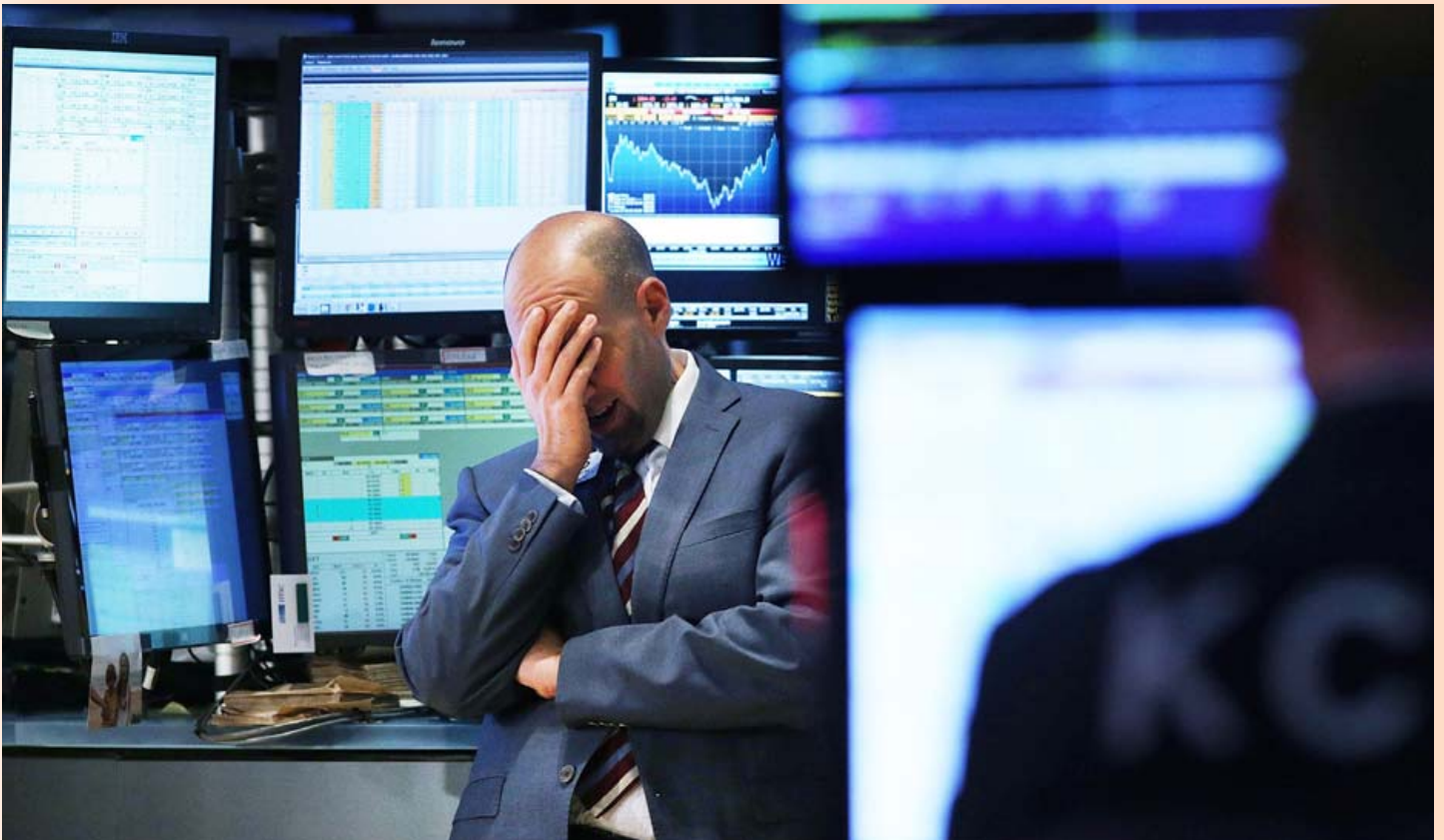
Vansæll verðbréfamiðlari í kauphöllinni í New York. Fjárfestar hafa ekki haft yfir miklu að gleðjast í ár en árið er það versta á fjármálamörkuðum heimsins frá því í kreppunni fyrir áratug.