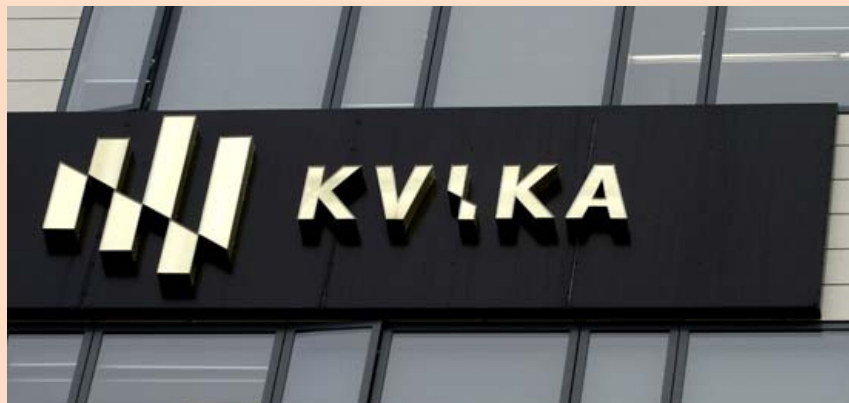
Kvika og rekstrarfélög bankans verða með yfir 400 milljarða í stýringu eftir kaupin á GAMMA.

Netfang auglýsingaheildar auglysingar@frettabladid.is Veffang frettabladid.is