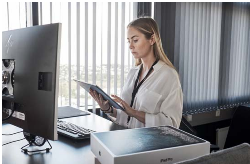
Spennandi afmælisútgáfa er væntanleg með nýju andliti og viðmóti á bókhaldshugbúnaði dk.