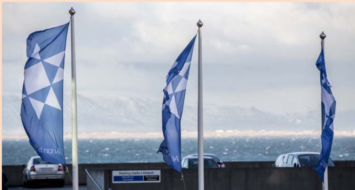
Eignarhaldsfélagið BG12, sem Arion banki átti 62 prósentu hlut í, seldi 45,9 prósentu hlut sinn í Bakkavör í ársbyrjun 2016.

Bankasýslan telur fram í minnisblaðinu til ráðherra að í kjölfar almenns útboðs á hlutabréfum í Bakkavör og skráningar þeirra í kauphöllina í Lundúnum í nóvember í fyrra hafi komið í ljós að verðmæti eignarhlutar BG12 í matvæla-