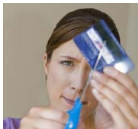
Ungt fólk í Danmörku er ekki nægilega meðvitað um fjármál sín.