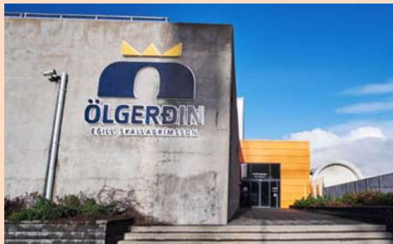
Ölgerðin missti húsnæðið 2010 í fjármálahrununum.

til landsins í gegnum fjárfestingaleið Seðlabankans, eins og fram hefur komið í Markaðnum. Fyrirtækið hefur einkum fjárfest í fasteignum.