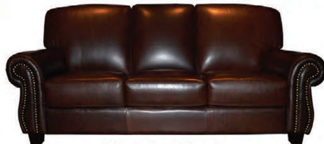
Houston sófasett alklætt hágæða leðri