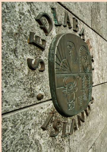
Stefnt er að því að slíta Lindarhvoli á fyrri hluta næsta árs.

Fram kemur í greinargerðinni að það sé mat Lindarhvols að ekki sé heppilegt að setja önnur óskráð hlutabréf, sem eru í umsýslu félagsins, í söluférli að svo stöddu.