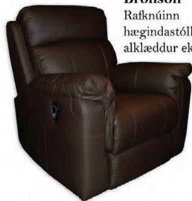
Bronson Rafknúinn hægindastóll alklæddur ekta leðri