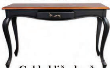
Golda hliðarborð málað, Hnota