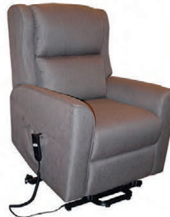
2 mótoru lyftistóll í sterku áklæði