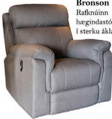
Bronson Rafknúinn hægindastóll í sterku áklæði

Skoðið úrvalið í vefverslun okkar - www.husgagnabankinn.is