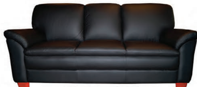
Classico sófasett alklætt ekta leðri