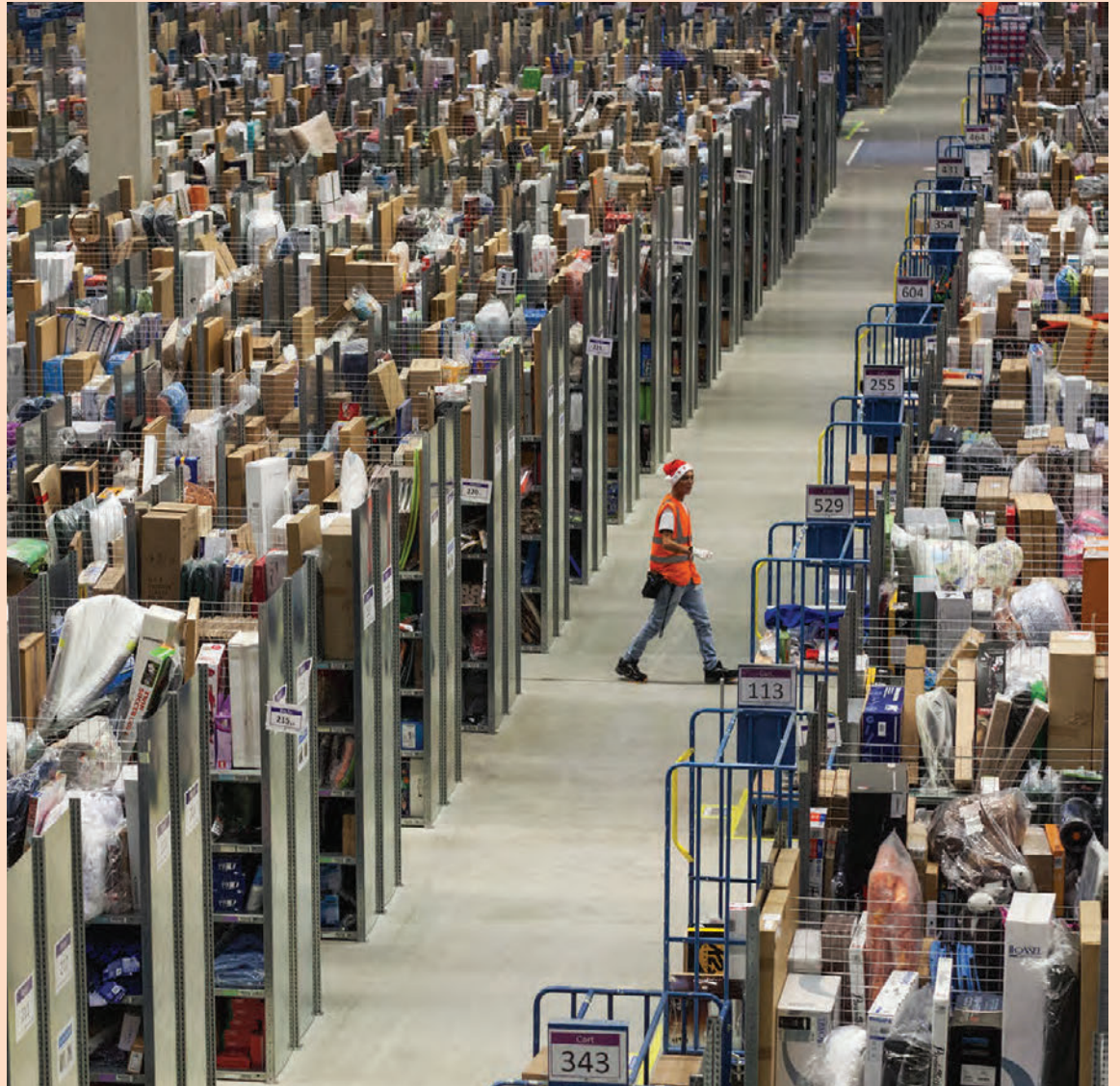
Frá dreifingarmiðstöð Amazon, stærstu vefverslunar heims, í Bandaríkjunum. Að reka vefverslun felur í sér sömu áskoranir og að reka hefðbundna verslun. Hins vegar er mögulegt markaðssvæði mun stærra.

Í næsta pistli verður fjallað um ný tekjumódel í greiðslum.