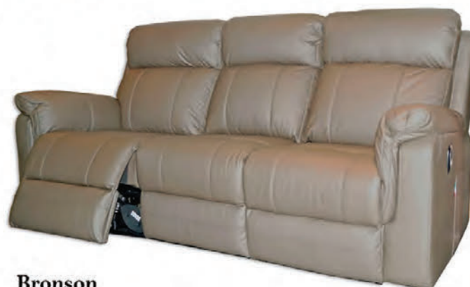
Bronson rafknúinn hægindasófi alklæddur ekta leðri