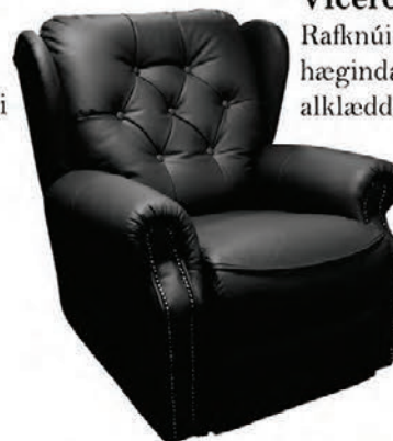
Viceroy Rafknúinn hægindastóll alklæddur ekta leðri