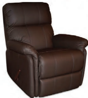
Hægindastóll alklæddur ekta leðri, snúningur og rugga