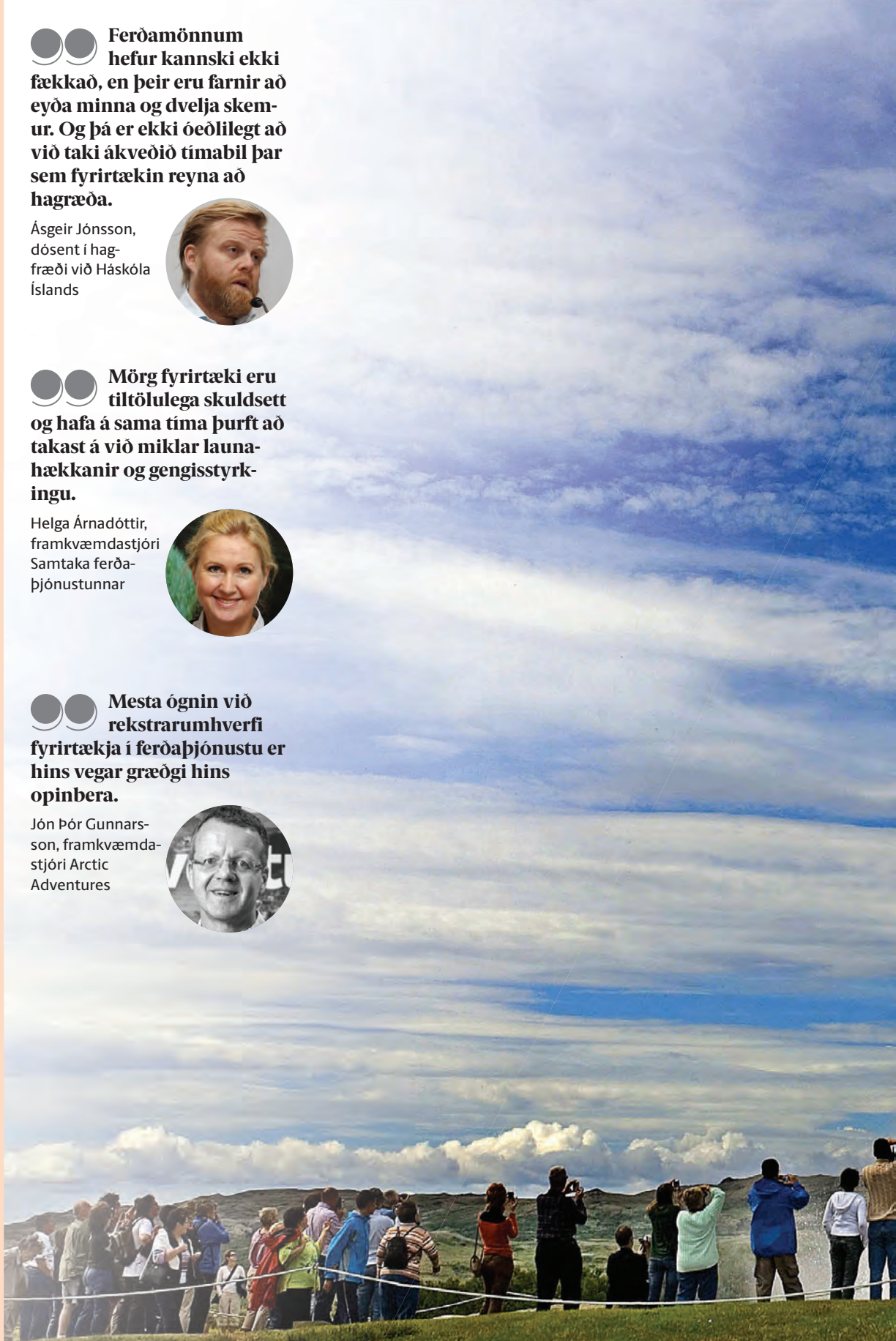
Ferðaþjónustan stendur um margt á tímamótum um þessar mundir. Fyrirséð er að mörg ferðaþjónustufyrirtæki verði að bregðast við erfiðu rekstrarumhverfi með hagræðingu í rekstri og sameiningum.