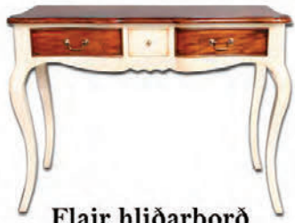
Flair hliðarborð málað, Hnota