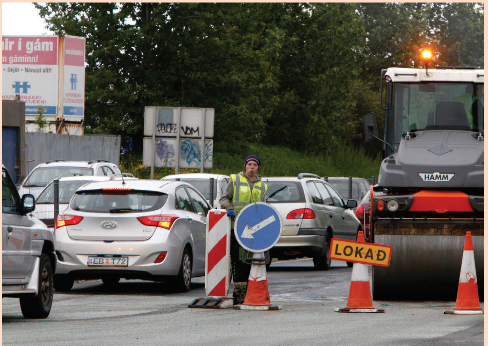
Mjög hefur dregið úr fjárfestingu í innviðum hér á landi á síðustu árum. Á árunum 1990 til 2008 nam árleg nýfjárfesting í innviðum um 5,5 prósentum af vergri landsframleiðslu að meðaltali en hlutfallið var 3,8 prósent í fyrra. Hlutfallið náði sögulegu lágmarki 2012 þegar það var 2,5 prósent.

Ómar Örn segir að héraendis eigi hið opinbera næstum alla innviði landsins, ólíkt því sem tíðkist í öðrum ríkjum. „Þrátt fyrir að við höfum notið mikils hagvaxtar og vel hafi gengið að komast út úr kreppunni, þá er ekki eins og hirslur hins opinbera séu fullar af peningum. Ríkið skuldar mikið, yfir 1.800 milljarða ef lífeyrisskuldbindingar eru teknar með í reikninginn, og hefur hreinlega ekki bolmagn til þess að ráðast í alla þá uppbyggingu sem þörf er á.“