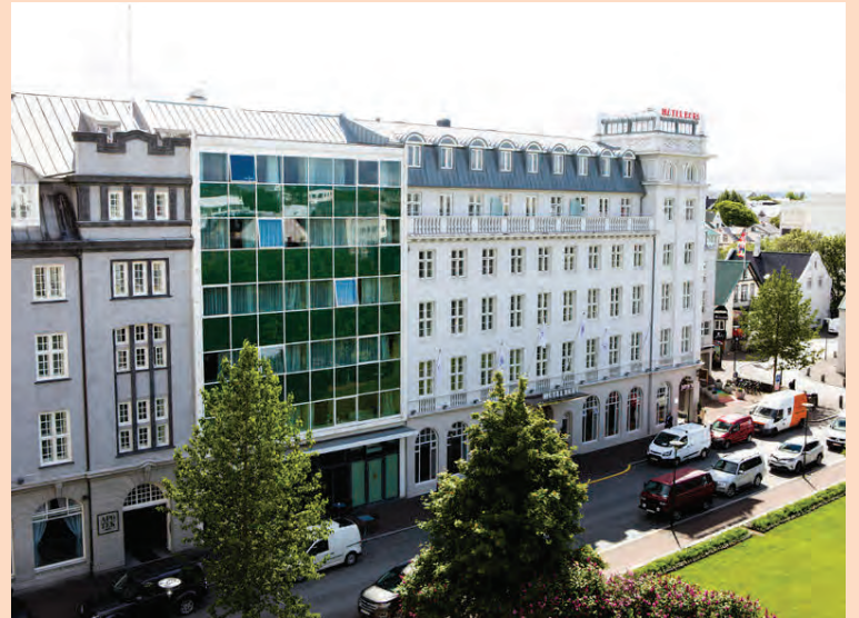
EBITDA-hagnaður Keahótela var um milljarður í fyrra.

JL Properties er stærsta fasteignapróunarfélagið í Alaska en auk þess hefur fyrirtækið meðal annars