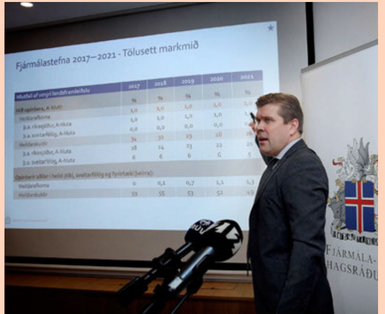
Ráðherranefnd um efnahagsmál samþykkti í fyrra að fela þáverandi fjármálaráðherra að skipa nefnd um endurskipulagningu bankakerfisins.

Ráðherranefnd um efnahagsmál var á þessum tíma skipuð auk Bjarna, sem gegnir nú embætti forsætisráðherra, þeim Sigurði Inga Jóhannssyni, þáverandi forsætisráðherra, Ólöfu Nordal, þáverandi innanríkisráðherra, og Lilju Dögg Alfreðsdóttur, þáverandi utanríkisráðherra. Samkvæmt heimildum Markaðarins var gert ráð fyrir því að nefndin myndi í störfum sínum meðal annars vinna tillögur að uppstokkun á bönkunum í því skyni að minnka efnahagsreikning þeirra og draga úr kerfislagri áhættu. Þá átti hún að koma með tillögur um hvort æskilegt væri að ríkið færi til framtíðar með eignarhald á bönkunum, hvort sem það væri í formi ráðandi