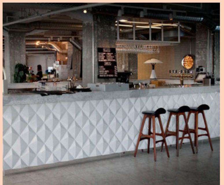
Veitingastaðurinn Bazaar og hótelið Oddsson eru rekin í JL-húsinu.