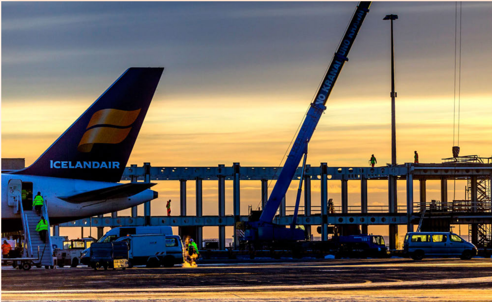
Icelandair flutti alls 3,7 milljónir farþega í millilandaflugi 2016 og fjölgaði þeim um 20% frá fyrra ári. Þrátt fyrir að bréf félagsins hafi lækkað mikið á síðasta ári þá var rekstrarniðurstaða Icelandair sú næstbesta í 80 ára