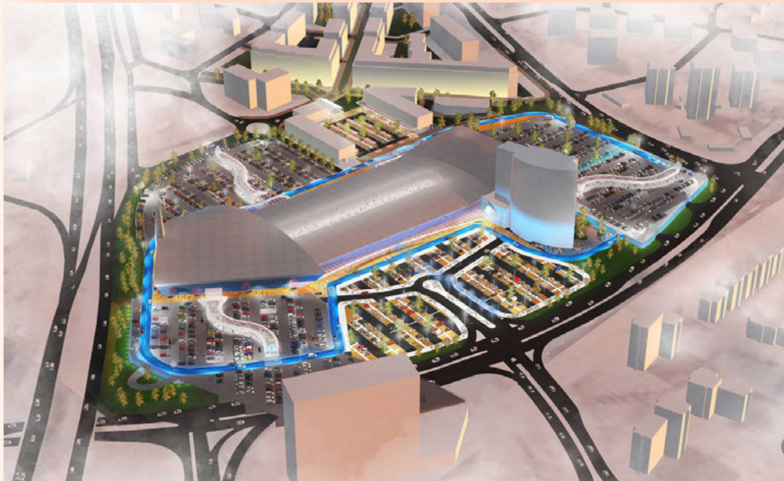
Hér má sjá teikningu af Smáralindinni, Norðurturinum og fyrirhuguðum framkvæmdum Klasa. 201 Smári er efst á myndinni fyrir miðju.

Eignarhaldsfélaginu Smáralind og Kópavogsbæ hefur verið stefnt vegna áforma um íbúðahverfið 201 Smári. Framkvæmdastjóri Norðurturans segir gengið á rétt félagsins. Forstjóri Regins segir BYGG, stærsta eiganda turnsins, vera á bak við málaferlin.