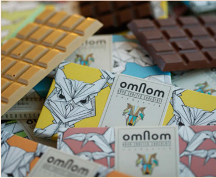
Súkkulaði Omnom er nú fáanlegt í 17 löndum.