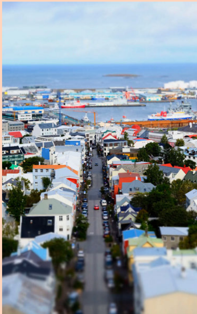
Forstjóri Homeexchange.com er meðvitaður um miklar vinsældir Airbnb hér á landi.