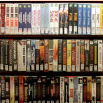
Ekki er lengur hægt að kaupa nýtt VHS-tæki.