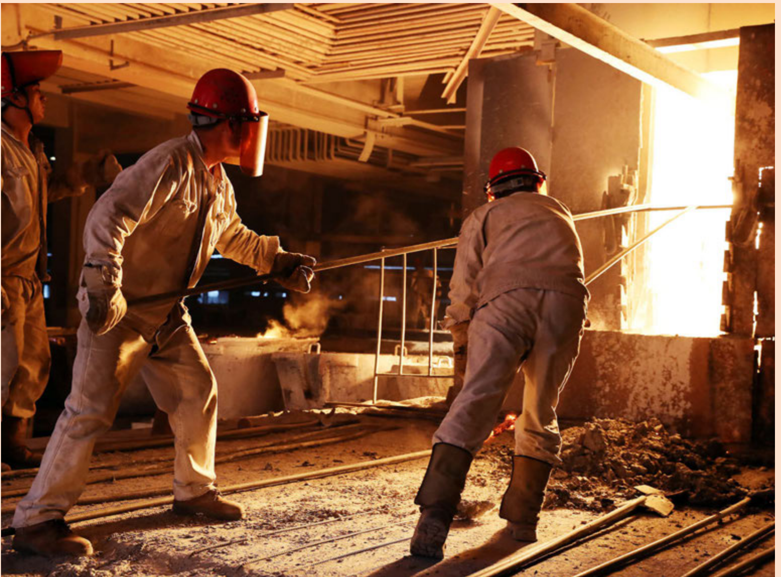
Í nóvembermánuði jókst hagnaður iðnaðarfyrirtækja í Kína vegna verðhækkunar á kolum og málmum. Hagnaður í iðnaðinum jókst um 14,5 prósent samanborið við árið áður og nam 7.774,6 milljörðum júana eða um 111 milljörðum dollara samkvæmt tölum hagstofu Kína.