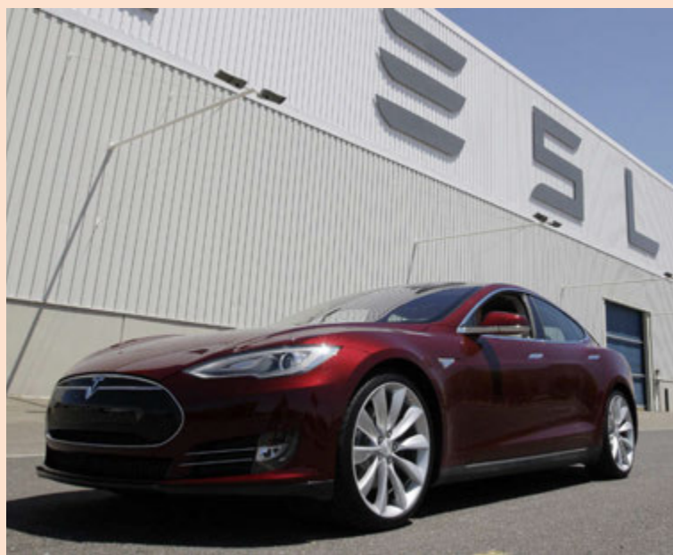
Tesla Model S fyrir utan Tesla-verksmiðjuna í Kaliforníu.