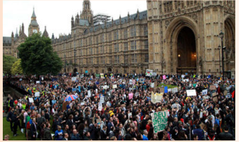
Fjöldmenn mótmæli vegna Brexit voru fyrir framan breska þingið á þriðjudaginn.

Nýjar tölur frá YouGov sýna að fjöldi þeirra sem hafa minni trú á bresku efnahagslífi hefur tvöfaldast frá Brexit-kosningunum, úr 25 prósentum í 49 prósent. Ef dregur úr trú fjárfesta á breska hagkerfinu getur það leitt til lægri fjárfestingar og þar af leiðandi minnkandi hagvaxtar. saeunn@frettabladid.is