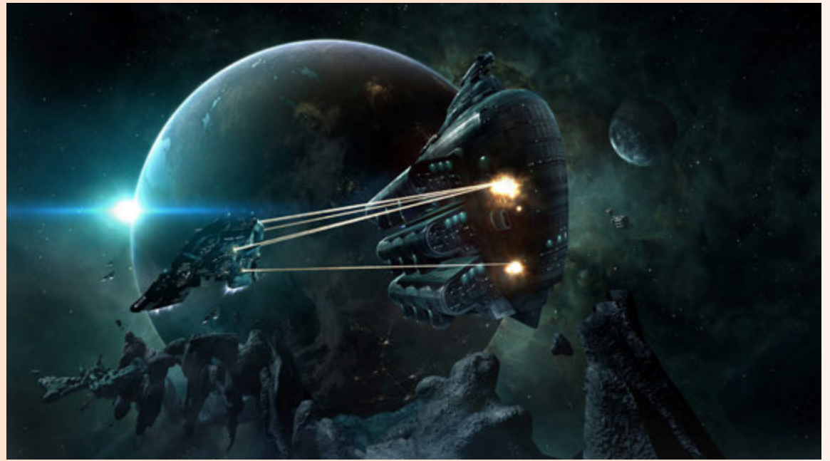
CCP hefur notið aðstoðar fjölmargra erlendra sérfræðinga við að þróa leiki sína allan þann tíma sem fyrirtækið hefur starfað.

að umtalsvert stærðarhagkvæmni virðist í greininni. Stærri fyrirtæki eða samstarfsnet fyrirtækja hafa meiri möguleika á að efla markaðs-sókn og vörubrúun og bjóða heildarlausnir. Í öðru lagi séu stöðugt fleiri fyrirtæki innan Sjávarklasans að feta sig áfram í öðrum greinum matvælaíðnaðarins. – jhh