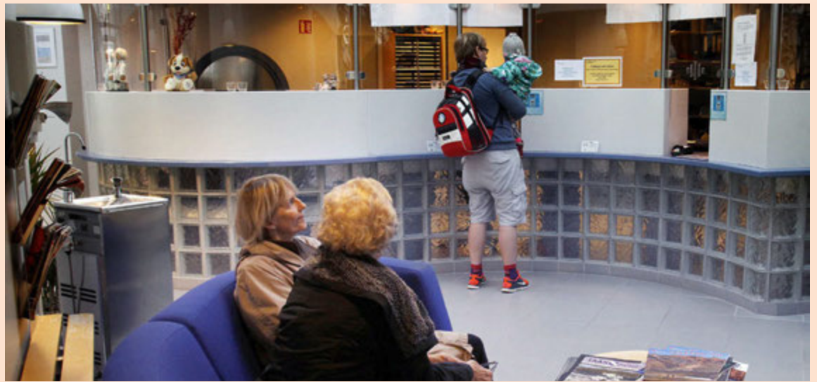
Einkareknar heilsugæslustöðvar eiga að taka á vanda heilsugæslunnar.