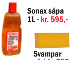
Sonax sápa 1L - kr. 595,-