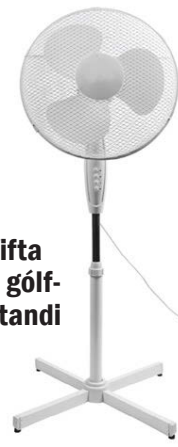
Vifta á gólf- standi