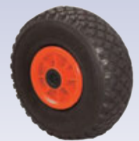
Dekk og hjól í ótrúlegu úrvali