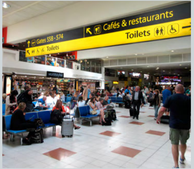
Dohop gekk til samninga við Gatwick-flugvöll í fyrra.

á mánuði hjá okkur er kannski bara tíu prósent af öllum bókunum. Margir sem maður hittir á Íslandi segjast bóka flugið með Dohop en ekki hótél. En þeir eru í auknum mæli að nýta síðuna til hótélbókana. Íslendingar standa fyrir 85 prósentum af hótélbókunum okkar, en töluvert minna af flugbókunum. Hótélvöxturinn hjá okkur er nú sjötíu til áttatíu prósent milli ára. Það er eftir meiru að slægjast fyrir okkur á þeim markaði en meðal hótélbókun skilar okkur þrjátíu evrum í þóknun miðað við tíu evrur í flugi.“