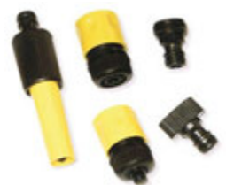
Slöngutengi - frá kr 195,-