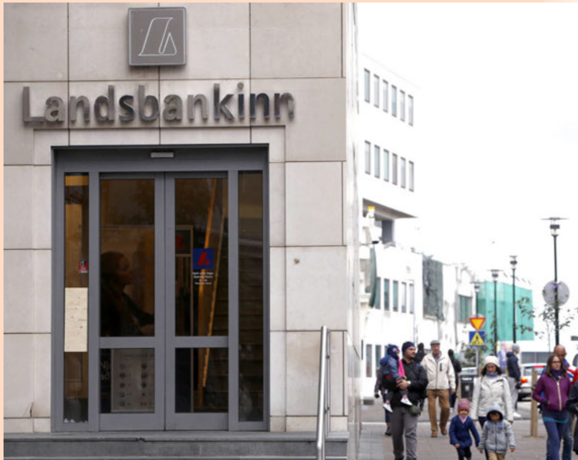
Landsbankinn seldi eignarhaldsfélagið Vestia til þess að efla eiginfjárstöðu í kjölfar gengislánadóma.

Markaðurinn spurði Fjármálaeftirlitið út í málið og fékk þau svör að ekki yrðu veittar upplýsingar um málefni einstakra eftirlitsskyldra aðila. „Á hinn bóginn má geta þess að Fjármálaeftirlitið fylgdist sérstaklega náið með eiginfjárstöðu lánastofnana vegna óvissu um bókfært virði gengislána á umræddum tíma. Í athugun Fjármálaeftirlitsins á áhrifum gengislánadóma Hæstaréttar frá 16. júní 2010 kom í ljós að dekksta sviðsmyndin hefði haft veruleg neikvæð áhrif á eiginfjárstöðu lánastofnana en eins og kunnugt er varð sú sviðsmynd ekki að veruleika,“ segir í svarinu.