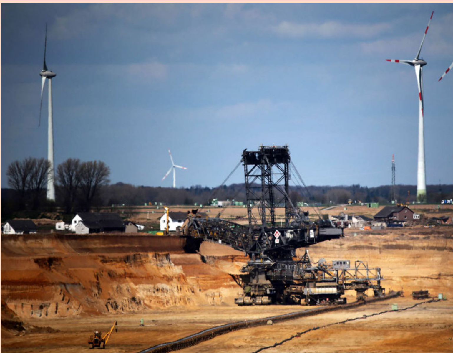
Hugveitan Agora Energiewende leggur til að brúnkolanámugreftri í Nordrhein-Westfalen, stærsta ríki Þýskalands, verði hætt fyrir árið 2039. Hugveitan rannsakar orkunotkun Þjóðverja og hvernig þeim gengur að breyta orkunotkun sinni úr kjarnorku í endurnýjanlega orku.