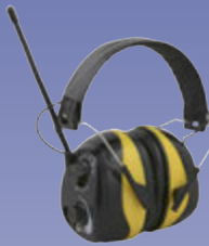
Heyrnahlífar með útvarpi