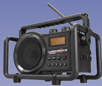
Lunchbox útvarpin loksins komin aftur!