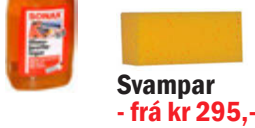
Svampar - frá kr 295,-