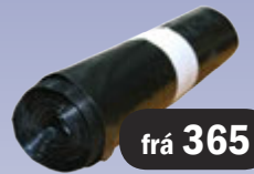
Ruslapokar 120L/140L/190L 10/25/50 Stk. Einnig glærir