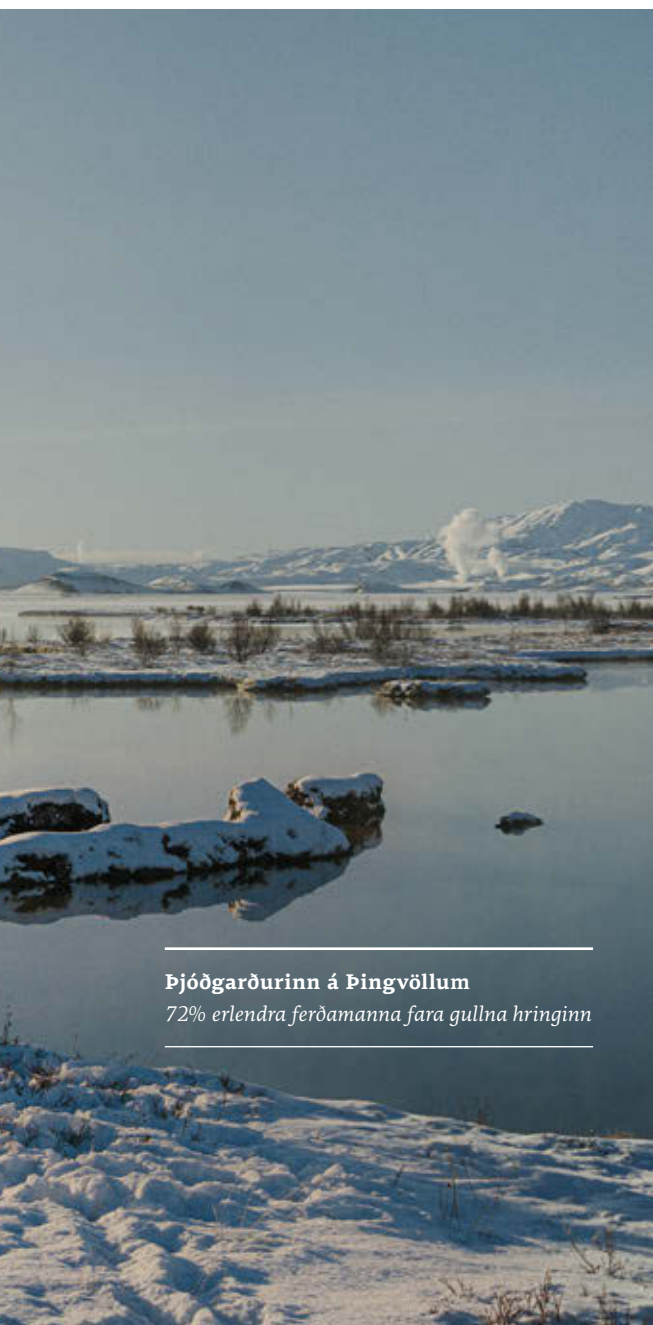
Þjóðgarðurinn á Þingvöllum 72% erlendra ferðamanna fara gullna hringinn

Úr svari Fjármálaeftirlitsins við fyrirspurn Markaðarins