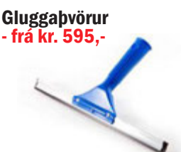
Gluggapvörur - frá kr. 595,-