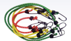
Strekkibönd og teygjur