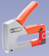
Heftibyssur, Hand-, rafmagns- og loftheftibyssur, frábært verð.