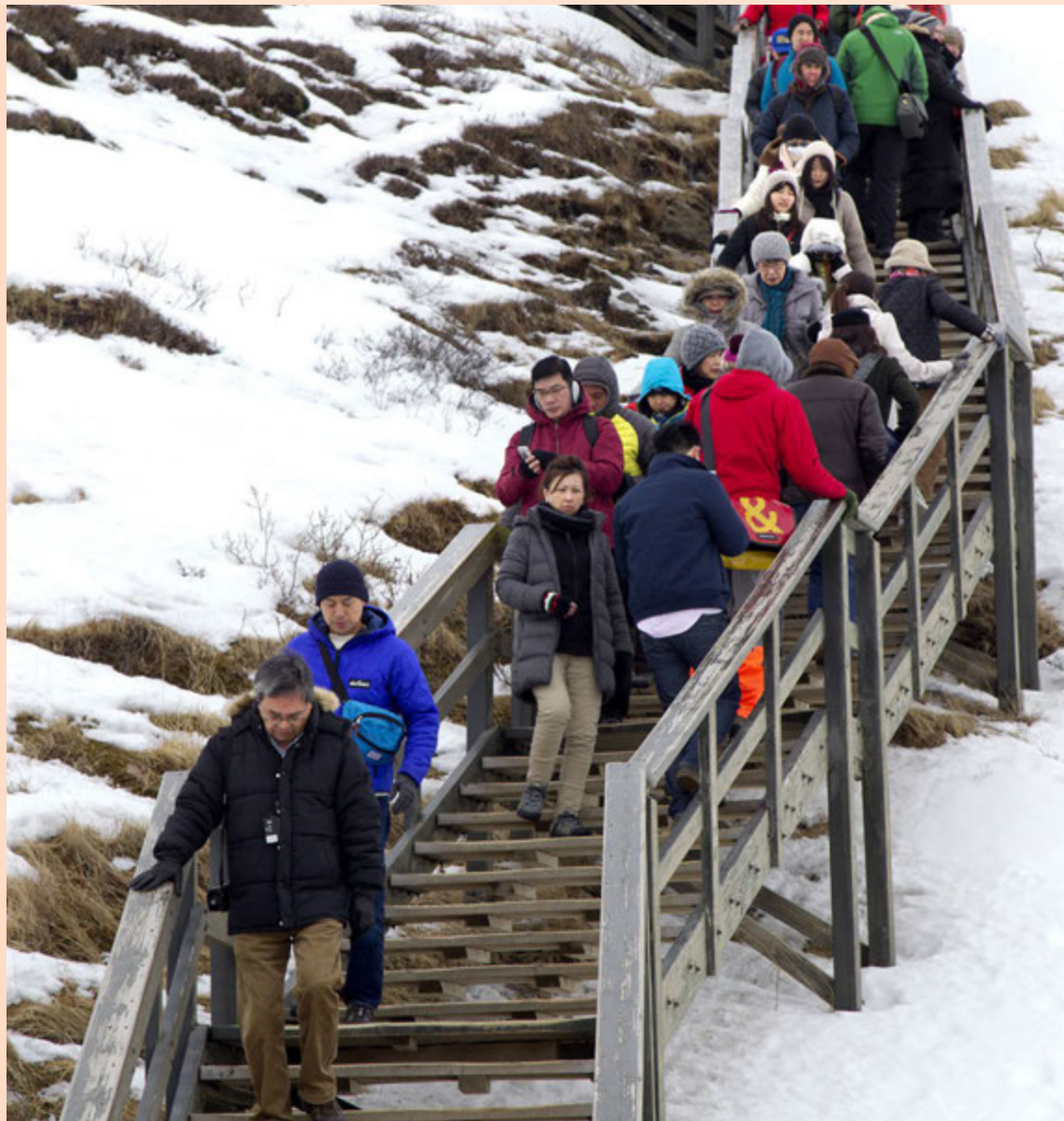
Tveir starfsmenn vinna hjá Stjórnstöðinni. Kostnaður ríkisins við Stjórnstöðina er 65 milljónir á þessu ári.