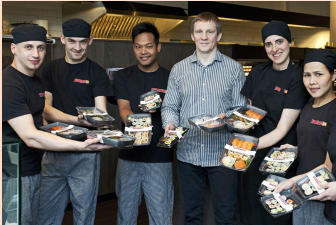
Tokyo Sushi var með 17,1 prósent markaðshlutdeild meðal tíu vinsælastu veitingastaða í Reykjavík.