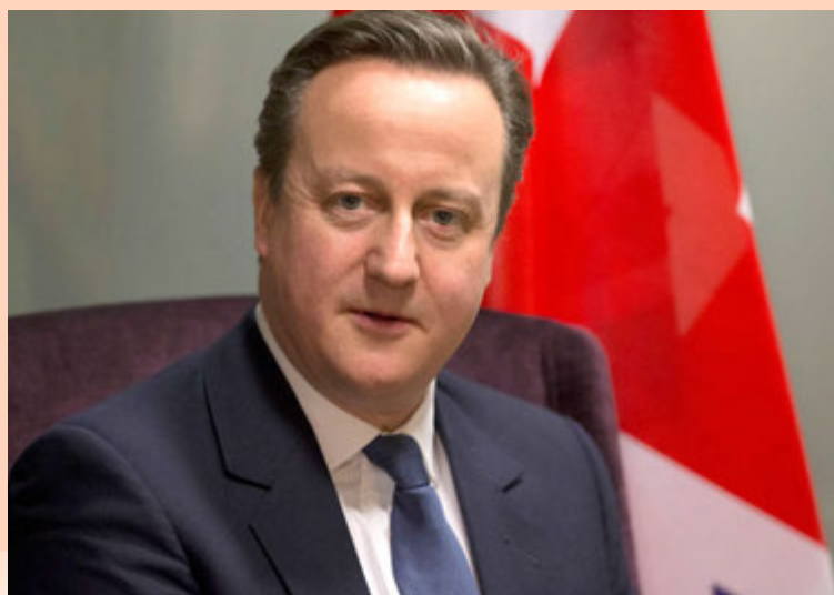
David Cameron hefur áður talað um að beita sér gegn skattaskjólum.

Í næsta mánuði mun Cameron stýra alþjóðlegum leiðtogafundi í London um skattasvik og skattaskjól. Frá árinu 2009 hafa nú þegar sjö hundruð samningar verið undirritaðir til að ýta undir gagnsæi í skattamálum á alþjóðavettvangi. – sg