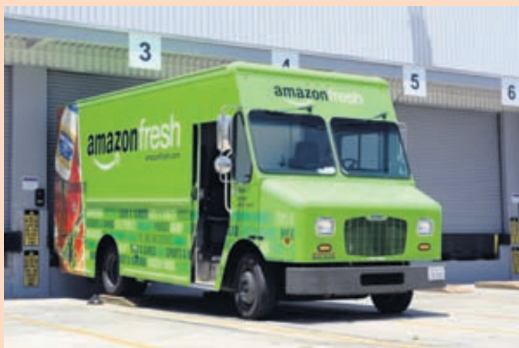
AMAZON Netverslunin hóf að selja mat með sendingarþjónustu árið 2013. Nú herma heimildir, sem þó hafa ekki verið staðfestar, að opnuð verði lúguverslun.

Netverslunin Amazon er sögð leita leiða til að auka umsvif í matvöru: