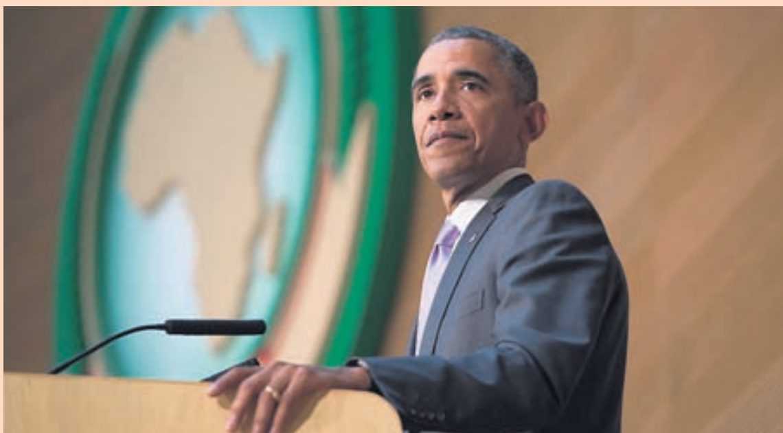
ÁVARPAÐI AFRÍKUBANDALAGIÐ Barack Obama, forseti Bandaríkjanna, flutti ræðu í höfuðstöðvum Afríkubandalagsins í Addis Ababa í gær. Hann sagði að það væri tími til kominn fyrir allan heiminn að breyta viðhorfi sínu gagnvart Afríku. Obama er fyrsti forseti Bandaríkjanna sem ávarpar Afríkubandalagið.