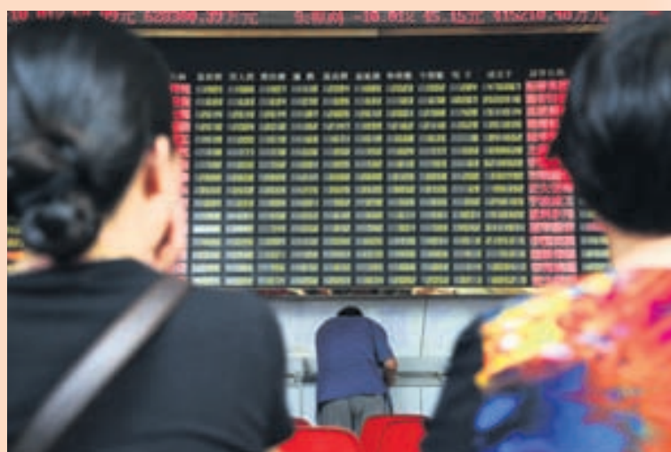
SVEIFLUR Kínverskir fjárfestar fylgdust áhyggjufullir með þróun hlutabréfamarkaðarins á mánudaginn.

Wall Street Journal segir aftur á móti að lækkunin á mánudag bendi til þess að fjárfestar hafi ekki trú