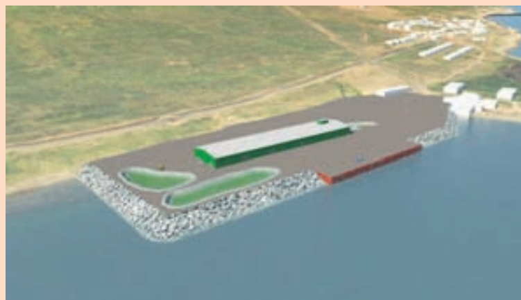
VERKSMIÐJAN Svona gæti verksmiðjan á Súðavík litið út. Kalkþörungana verður nær helmingi meira en í kalkþörungaverksmiðjunni á Bíldudal.