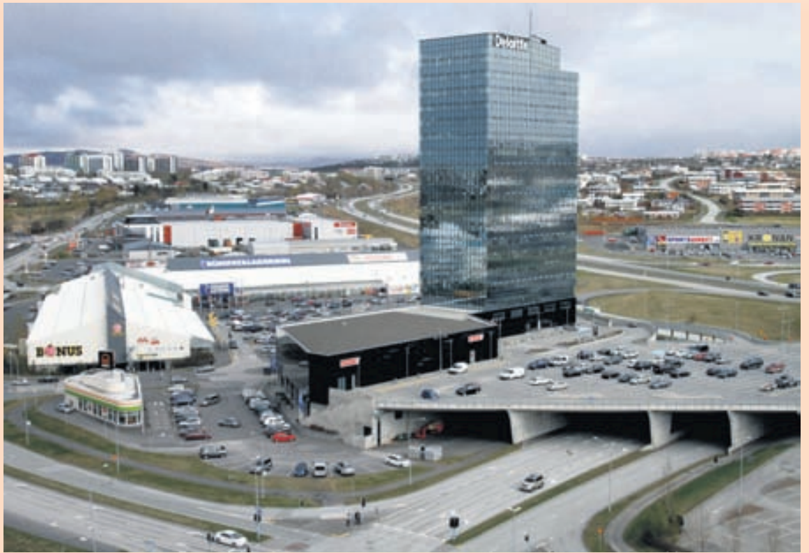
TURNINN Í SMÁRANUM Á meðal þeirra eigna sem Eik keypti fáeinum mánuðum áður en félagið var skráð á markað voru stórar eignir í Kópavogi.