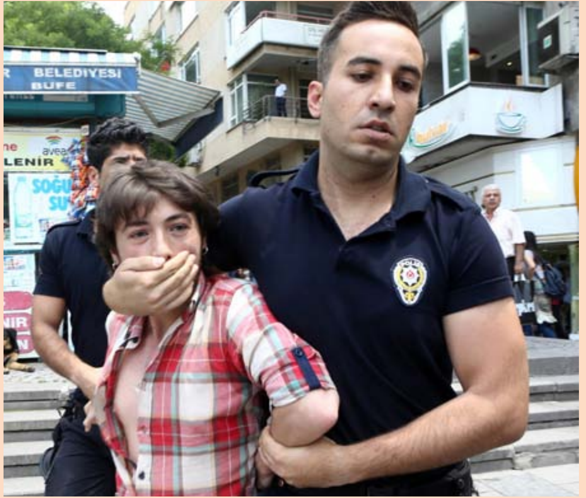
HANDTEKIN Það voru engin vettlingatök höfð þegar tyrkneskir lögreglumenn handtóku mótmælendur fyrir framan menntamálaráðuneytið í Ankara á mánudaginn. Nemendur mótmæltu flóknu prófakkerfi.