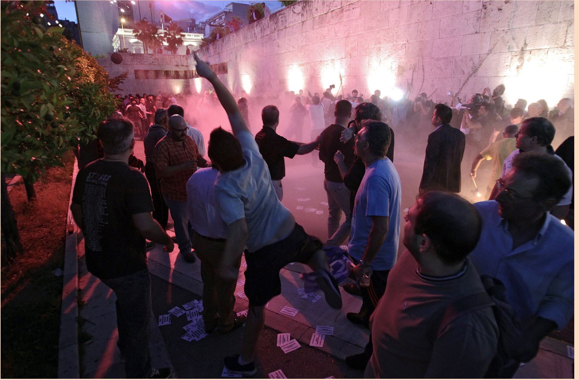
MÓTMÆLT Í AÐENU Mótmælendur komu saman við Þinghúsið í Aþenu á mánudaginn, á sama tíma og leiðtogar evruríkja komu saman til þess að ræða vandann í Grikklandi. Viðmælendur Markaðarins eru sammála um að vandi Grikkja verði leystur til skamms tíma. Til lengri tíma litið glímur ríkissjóður landsins aftur á móti við mikinn vanda.