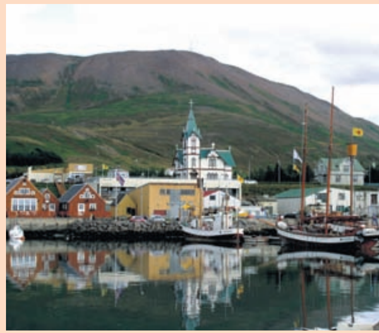
Á HÚSAVÍK Hvalaskoðun skiptir verulegu máli fyrir atvinnulífið á Húsavík.

Á föstudaginn birti Rannsóknarsetur verslunarinnar tölur yfir greiðslukortaveltu erlendra ferðamanna í maí. Þar kemur fram að