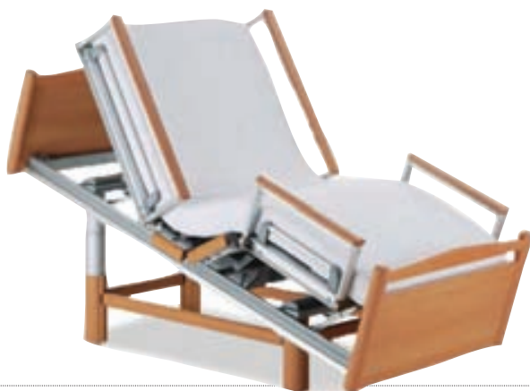
Vönduð rúm og húsgögn