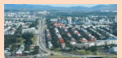
Í REYKJAVÍK Sala á íbúðum í eigu íbúðalánasjóðs gengur vel.