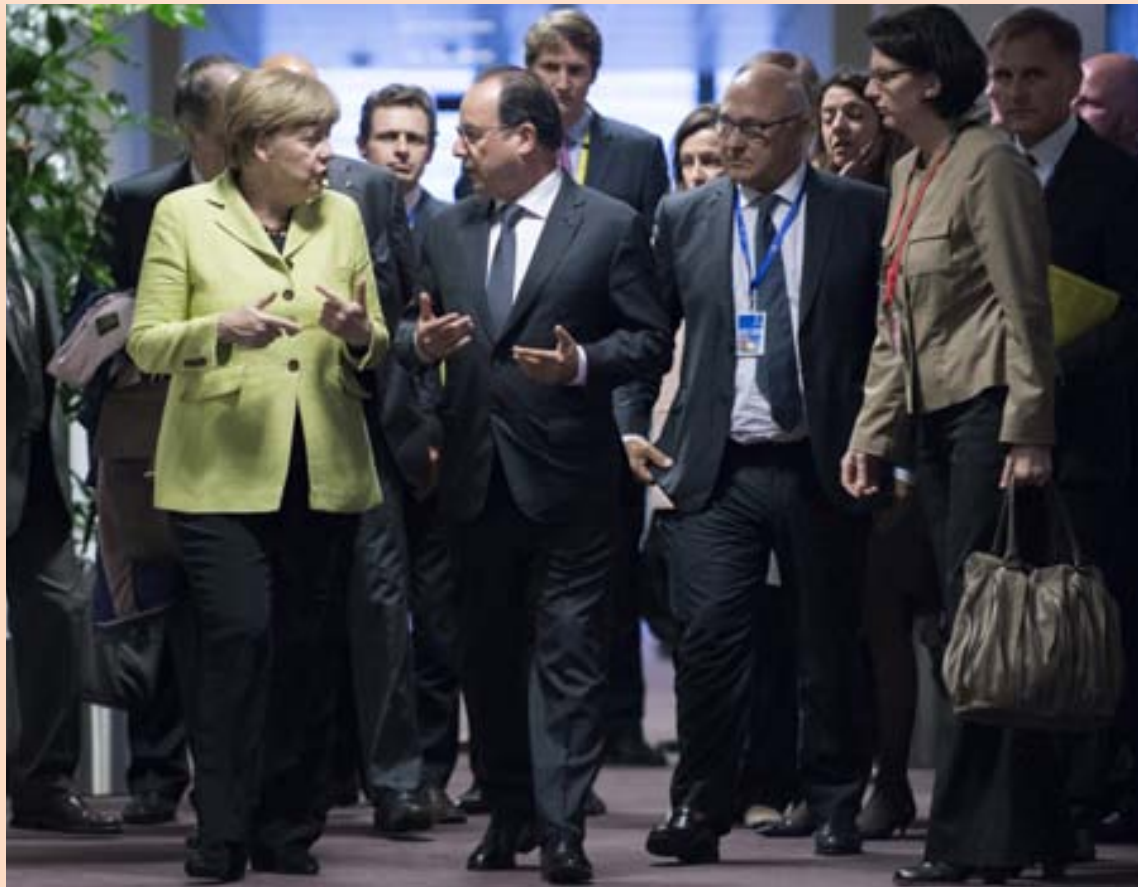
LEIÐTOGAR BERA SAMAN BÆKUR SÍNAR Vel fór á með þeim Angelu Merkel, kanslara Þýskalands, og Francois Hollande þegar þau komu saman til fundar á mánudag. Báðum er þeim umhugað um að samstarf Evrópusambandsins gangi sem best.