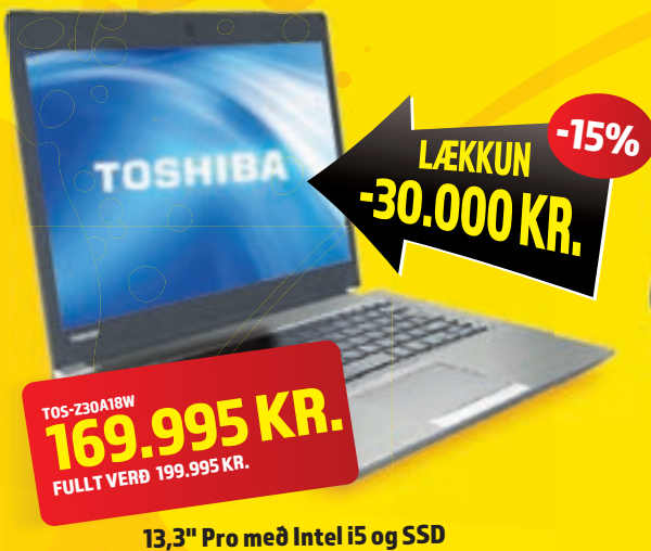
13,3" Pro með Intel i5 og SSD