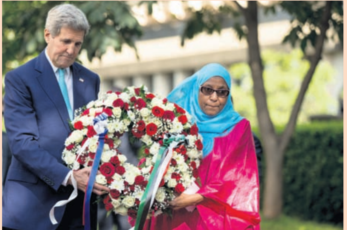
BYÐUR FRAM AÐSTOÐ John Kerry, utanríkisráðherra Bandaríkjanna, tók á mánudaginn þátt í minningarathöfn um þá sem fórust í hryðjuverkaárásunum á sendiráð Bandaríkjanna í Naíróbí í Kenía árið 1998. Um leið og Kerry minntist fórnarlambanna bauð hann fram aðstoð Bandaríkjanna í baráttunni gegn þeirri ógn sem sómölsk hryðjuverkasamtök eru orðin.