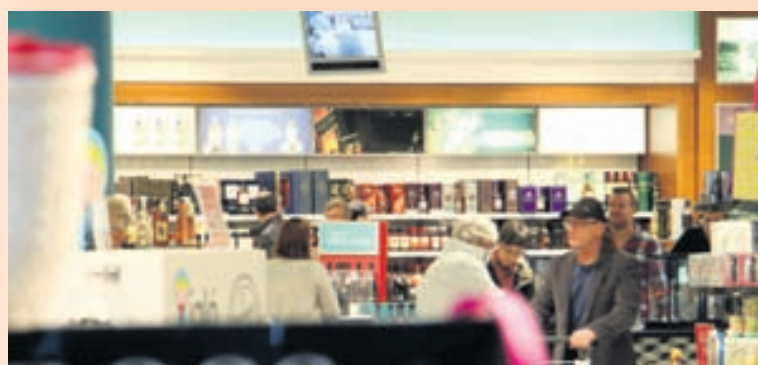
VERSLUN FRÍHAFNARINNAR Hagnaðurinn er umtalsvert minni í ár en hann var í fyrra.

Velta Fríhafnarinnar 8,6 milljarðar króna í fyrra samkvæmt reikningi: