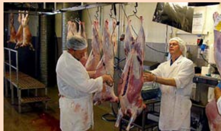
Í SKOÐUN Kauptilboðið stendur til 21. maí og munu bændur þurfa að taka afstöðu innan þess tíma.

hefur í nokkurn tíma átt fasteignir Norðlenska á Akureyri og hafa umræður um sameiningu félagsanna staðið yfir með hléum frá árinu 2008. Norðlenska og Kjarnafæði eru bæði stórir aðilar í kjötvinnslu á Íslandi. Rekstur fyrirtækjanna hefur verið þungur síðustu ár. Norðlenska tapaði um 50 milljónum á síðasta ári og Kjarnafæði tapaði einnig um 40 milljónum. Kauptilboðið er liður í því að ná hagræði í rekstri fyrirtækjanna til þess að vera samkeppnishæfir í verði á kjötafurdum innanlands.