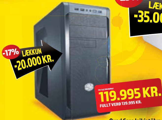
Quad Core leikjatölva