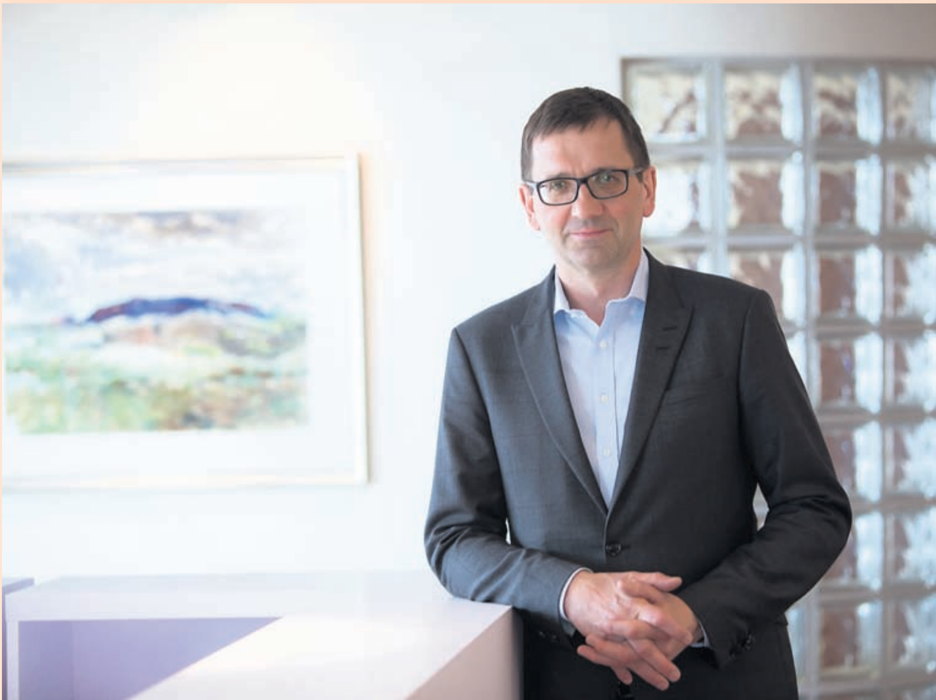
VILL SKILA MEIRU Hördur segir að miðað við stærð fyrirtækisins og styrk eigi það að geta skilað miklu meiri arði.