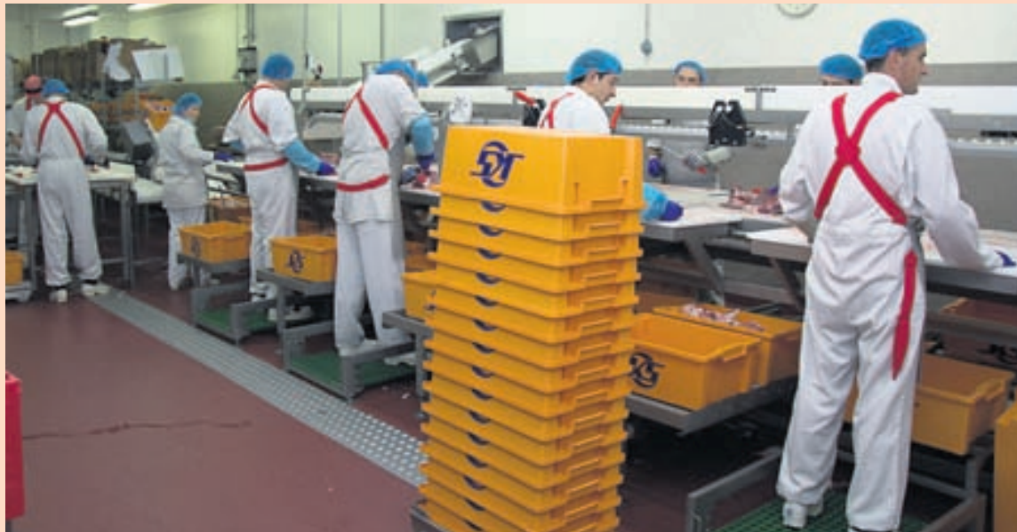
KJÖTAFURDASTÖÐ KAUPFÉLAGS SKAGFIRÐINGA.