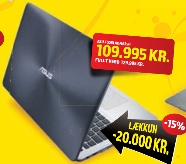
15,6" FHD Intel i5