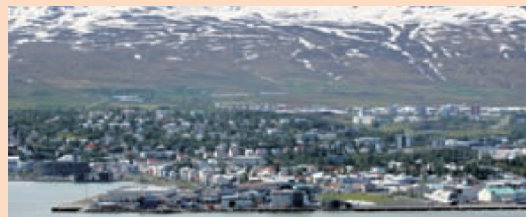
AKUREYRI Fallorka framleiðir og selur rafmagn og er að öllu leyti í eigu Norðurorku á Akureyri.

vött. „Við erum þessa dagana að hefja útboð á vél- og rafbúnaði fyrir nýja virkjun ofan Akureyrar. Ef allt gengur að óskum verður sú virkjun tekin í notkun snemma árs 2017,“ segir Andri. Með þessum framkvæmdum opnast möguleikar almennings á því að nýta sér Glerárdalinn sem fólkvang. „Í leiðinni munum við leggja nýjan göngustíg inn Glerárdalinn sem mun gera dalinn mun aðgengilegri fyrir Eyfirðinga og ferðamenn til útivistar.