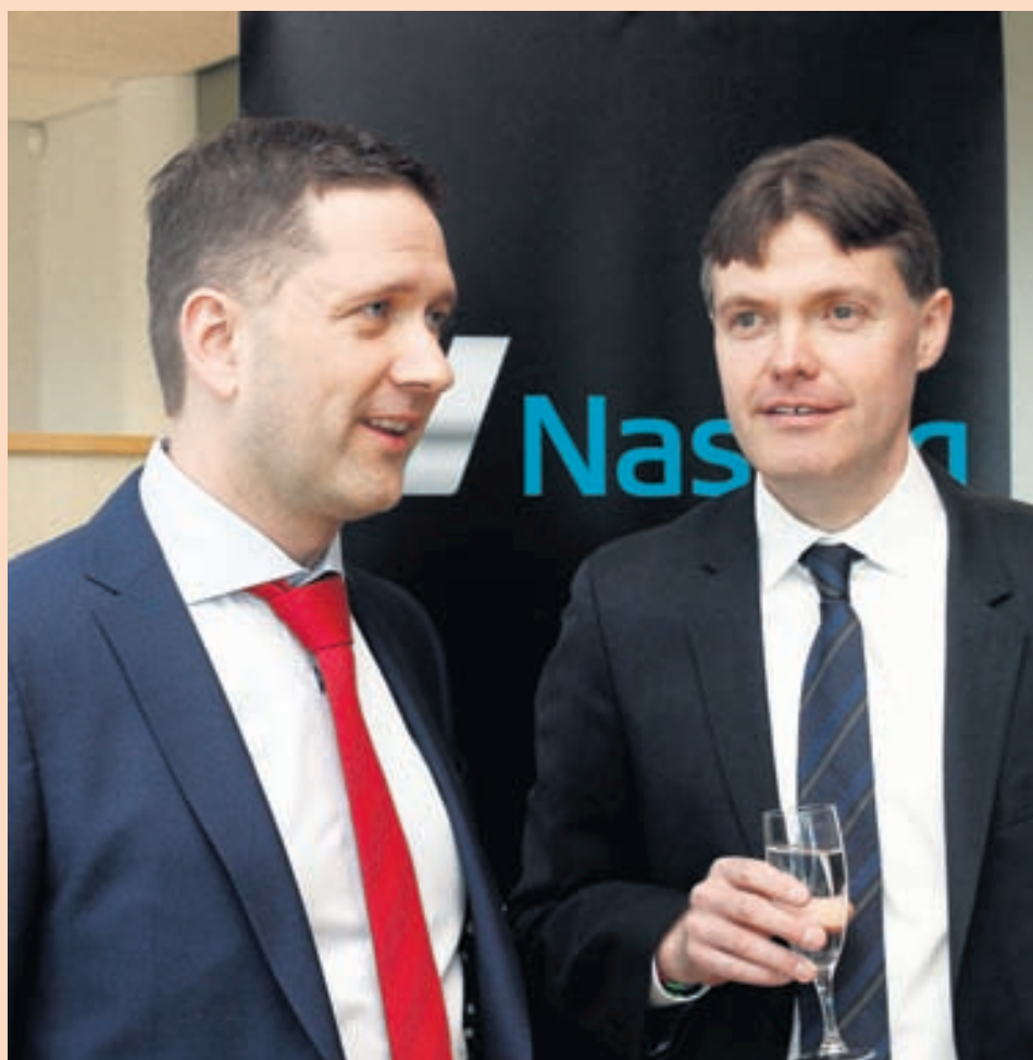
FAGNAD Það þótti ærin ástæða til að fagna þegar Fasteignafélagið Eik var skráð á Markað í síðustu viku.

„Ein af þessum tillögum sneri að möguleika lífeyrissjóða til þess að fjárfesta á markaðstorgi fjármálagjörninga. Ég get ekki séð betur en að það sé þverpólitískur stuðningur við það frumvarp sem er inni á þingi sem myndi leiða til þess að lífeyrissjóðirnir fengju aukaheimild upp á fimm prósent af sínu eignasafni til þess að fjárfesta á markaðstorgum fjármálagjörninga. Það frum-