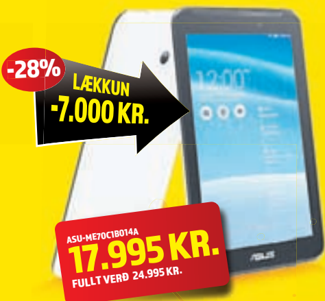
7" Asus Intel Atom spjaldtölva