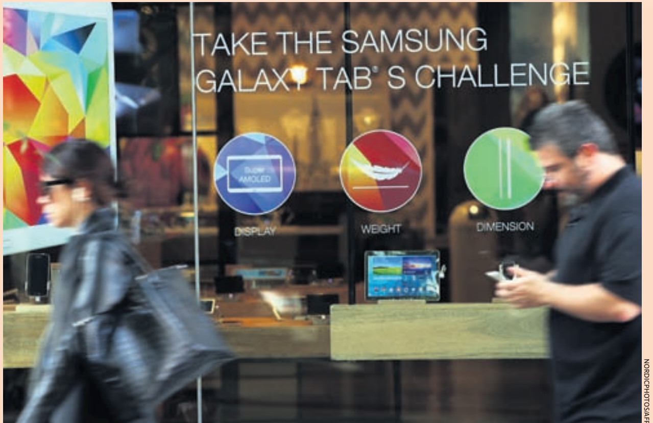
HARÐNANDI SAMKEPPNI Hagnaður raftækjarisans Samsung dróst saman um allt að 60 prósent á þriðja ársfjórðungi þegar hann nam 3,8 milljörðum Bandaríkjadala. Minni sala á Samsung Galaxy-snjallsímum er sögð aðalástæðan en undanfarin ár hafa þeir verið helsta tekjulind fyrirtækisins.

Varðstaða um landbúnaðarkerfið og kjördæmapot er að vísu ekkert nýtt og ekkert sem einkorðast við núverandi stjórnarflokka. En flokkar sem þora ekki að gera nauðsynlegar breytingar til heilla fyrir almenn-ing, þeir eiga ekki erindi í stjórnarmeirihluta.