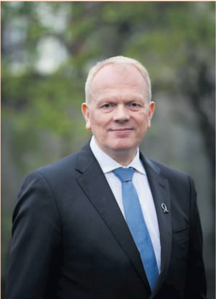
MIKILVEGUR ARFUR Ráðherra segir að það þurfi að skoða mörg verkefni sem Ríkisútvarpið þarf að sinna.