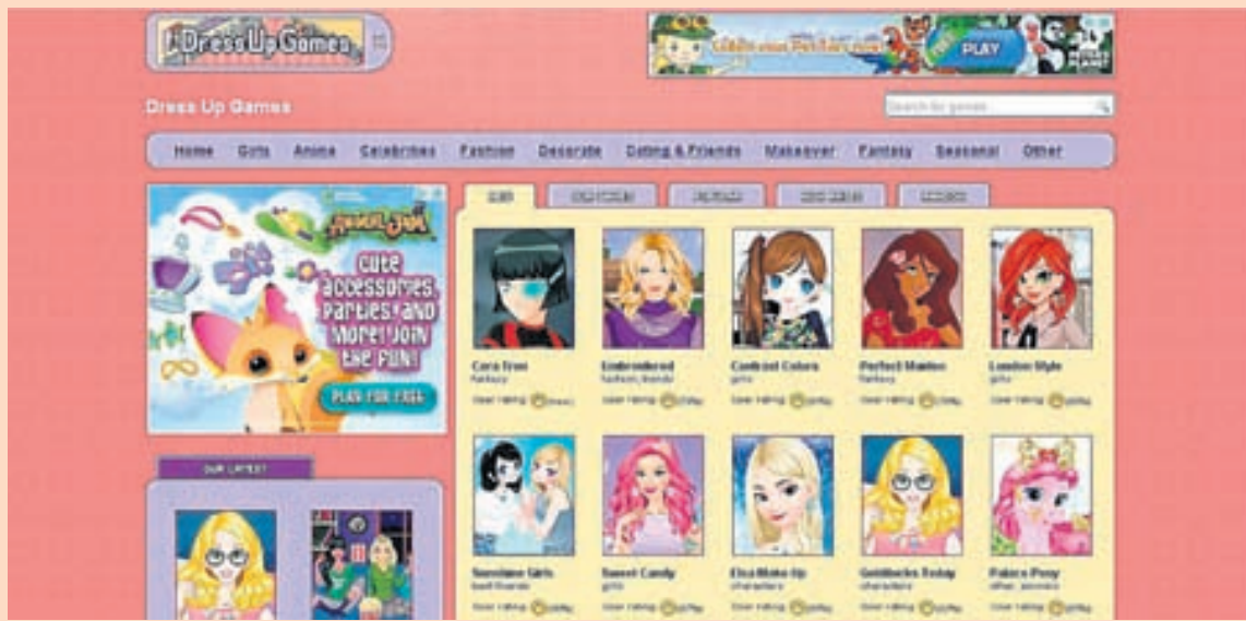
DRESSUPGAMES.COM Vefurinn var opnaður fyrir 16 árum en afkoman hefur aldrei verið betri en árið 2010 þegar hún var jákvæð um 111 milljónir.

þessu af stað og ég held að það sé ástæðan fyrir því af hverju fólk gefst oft upp á þessu.“