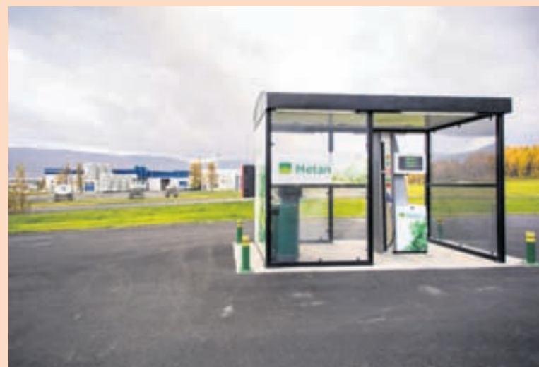
METANSTÖÐIN Framleiðsla Norðurorku á að nægja fyrir 600 fólksbíla á ári til ársins 2030.