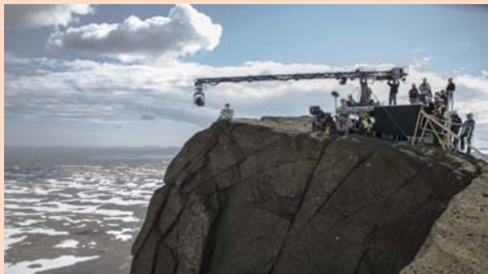
ÞAÐ SEM ÁÐUR VAR Árið 2012 unnu Íslensk framleiðslufyrirtæki við mörg stór verkefni og þar á meðal kvikmyndirnar Noah og Oblivion og þættina Game of Thrones.