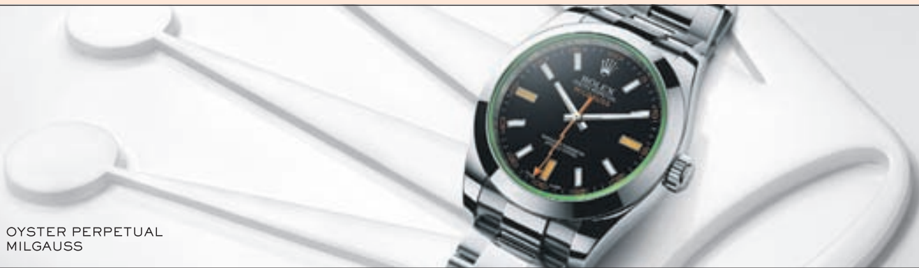
OYSTER PERPETUAL MILGAUSS