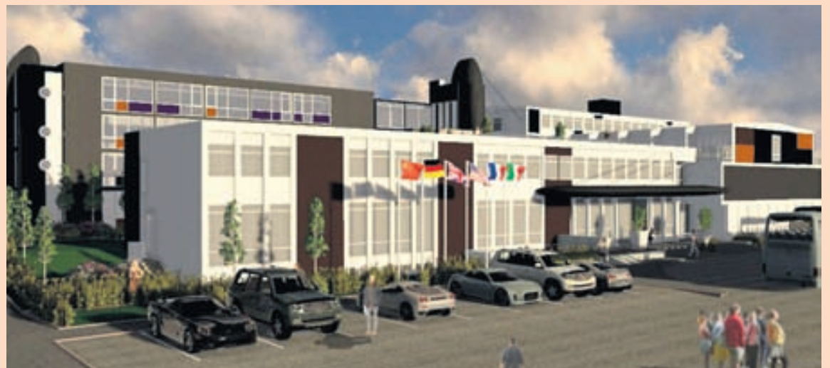
TEIKNING Hótelíð á Húsavík verður stækkað um 4.700 fermetra. Framkvæmdirnar munu kosta um einn milljarð króna.