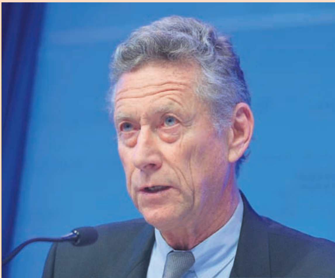
BLAÐAMANNAFUNDUR AGS Olivier Blanchard er aðalhaffræðingur Alþjóðagjaldeyrissjóðsins.

Alþjóðagjaldeyrissjóðurinn og systurstofnunin, Alþjóðabankinn, munu halda vörfundu sína í Washington um helgina þar sem fjármálaráðherrar og seðlabankastjórar G-20 ríkjanna munu hittast. Aðalmálefni-