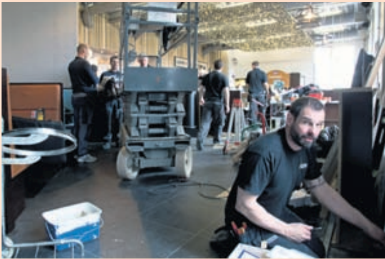
ALLT Á FULLU Nýi veitingastaðurinn er á svipuðum slóðum og Hard Rock Café á sínum tíma.

Nýr staður Hamborgarafabrickunnar nánast tilbúinn: