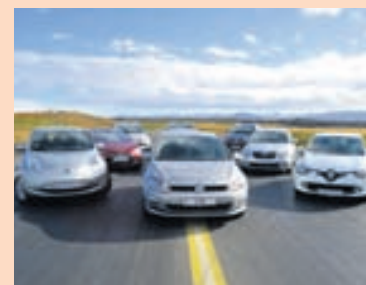
HÆKKUN Stórkaupavísitalan hefur ekki verið hærrá frá hrúni.

hafi mælinga hefur hún að jafnaði mælst 24,2 stig.