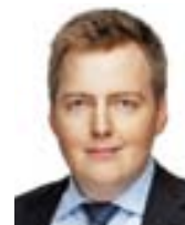
Sigmundur Davíð Gunnlaugsson