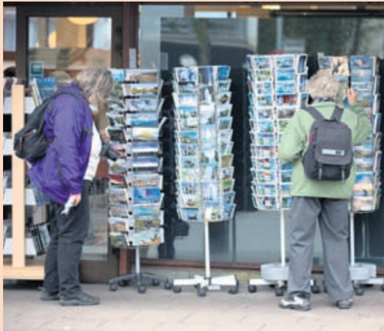
TÚRISTAGILDRA Framsögumenn á fundinum í gær voru sammála um að Ísland mætti ekki verða túristagildra.