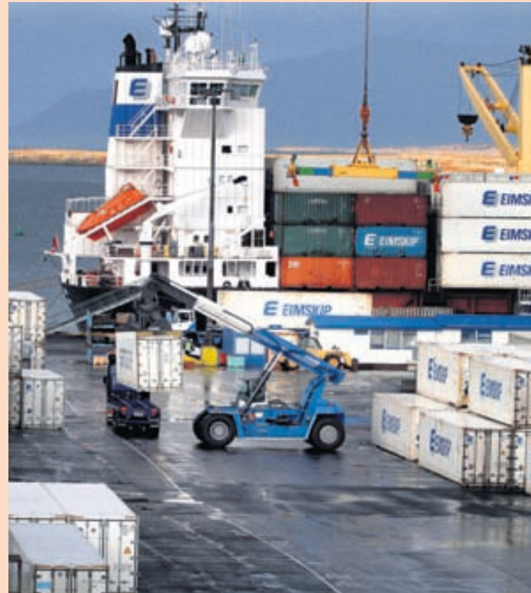
ALPJÓDAVÆDING Evrópa er langmikilvægasti markaður Íslendinga.

Niðurstöðurnar gefa til kynna að staða Norðurlandanna á útflutningsmörkuðum hafi versnað hlutfallslega á tímabilinu. Heildarútflutningur landanna árið 2012 var 402 milljarðar evra, en hefði verið 31 milljarði hærri