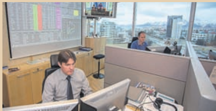
Í KAUPHÖLLINI! Gengi bréfa félagsins hefur verið að taka við sér og stendur nú í 30,6 krónum á hlut.