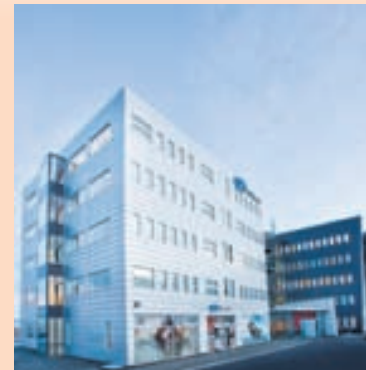
TÍMAMÓT Nýherji hefur nú dregið úr öllum rekstri í Danmörku.

Vísitalan fyrir bifreiðakaup hækkar um tæp 7 stig frá síðustu mælingu, og mælist hún nú 25,2 stig sem er hæsta gildi hennar í 6 ár. Töldu rúmlega 13 prósent aðspurðra það mjög eða frekar líklegt að þeir myndu festa kaup á bifreið á næstu 6 mánuðum, en tæplega 76 prósent mjög eða frekar ólíklegt. Þessi vísitala hefur lægst farið niður í 10,5 stig, sem var í árslok 2008, en frá upp-