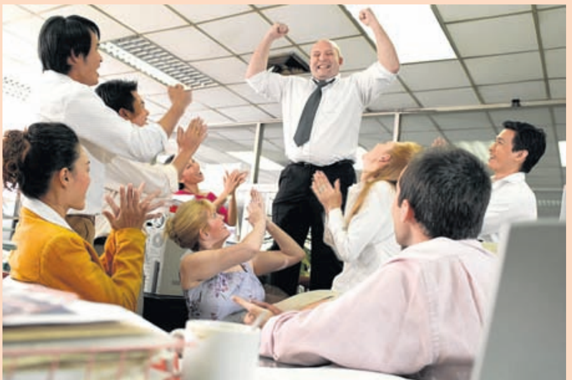
STÆRST Könnunin um val á Stofnun ársins er stærsta reglulega vinnumarkaðskönnun landsins.

Könnunin um val á Stofnun ársins er óumdeilanlega stærsta reglulega vinnumarkaðskönnun landsins og með niðurstöðum hennar hefur skapast verðmætur grunnur til samanburðar og rannsókna á launapróun í landinu sem er afar mikilvægt, jafnt fyrir launafólk, stéttarfélagin og stjórnendur stofnana og fyrirtækja. Könnunin nær, eins og áður sagði, bæði til starfsmanna á almennum markaði (VR) og opinberum markaði og gefur þannig enn mikilvægari upplýsingar um samanburð á starfsumhverfi og launapróun starfa á milli opinberra og almenna vinnumarkaðarins. Upplýsingarnar geta starfsmenn notað til að meta eigin vinnustað í samanburði við aðrar stofnanir og fyrirtæki og stjórnendum gefst tækifæri til að kortleggja stöðu stofnunarinnar, hvort sem