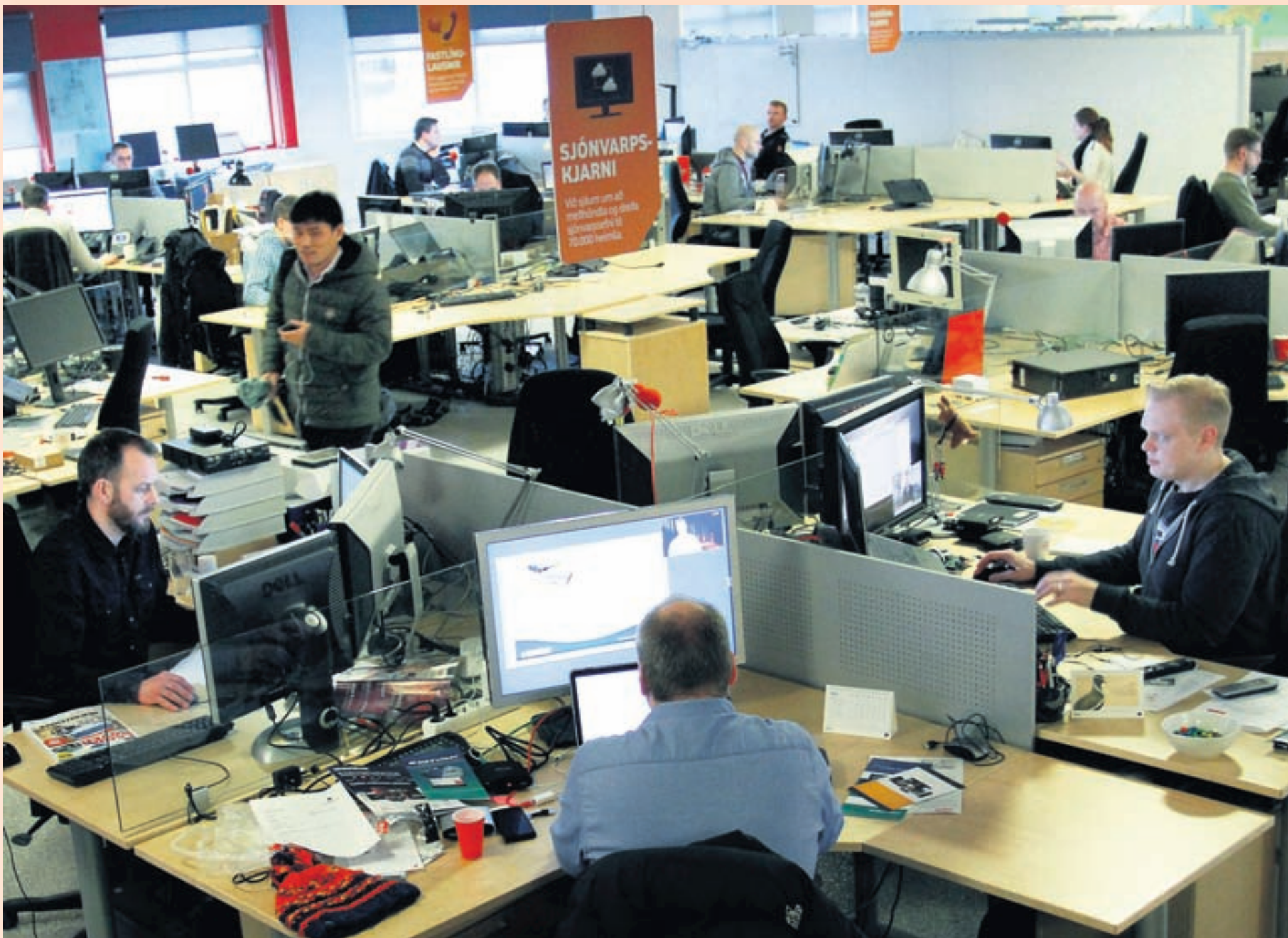
Í HÖFUÐSTÖÐVUNUM Viðskiptavinir Vodafone fengu í síðustu viku bréf þar sem forstjórinn fór yfir þær aðgerðir sem félagið hefur ráðist í til að efla öryggismál.