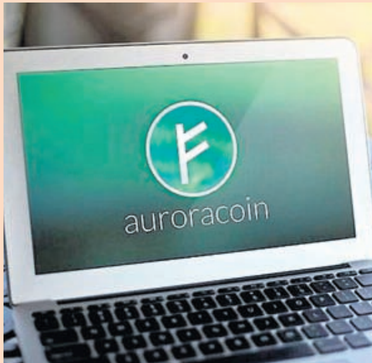
RAFEYRIR Virði einnar Auroracoin er um 11 Bandaríkjadalir eða 1.250 krónur.

Á heimasíðu myntarinnar segir að tilgangur miðilsins sé að gefa Íslendingum kost á að nota annan gjaldmiðil en ís-