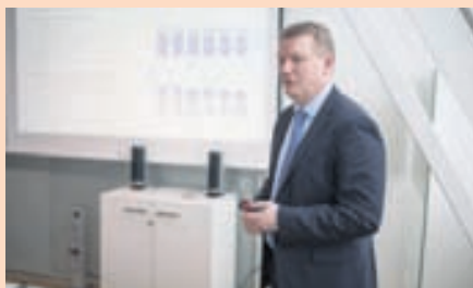
Á MARKAÐ Almenn útböð á 23 prósent hlut í Sjóvá hefst á morgun.