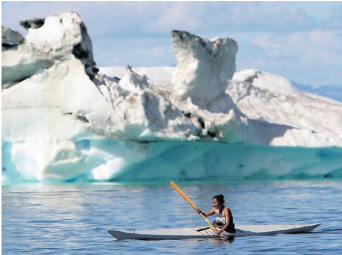
MENNINGARÁREKSTRAR Þau skref sem stigin verða í nýtingu náttúruauðlinda Grænlands munu hafa áhrif á alla samfélagsgerð Grænlandinga. Ljóst er að ekki er vilji hjá öllum íbúum landsins að stíga stórt skref í átt að vestrænni menningu. Þeir vilja flýta sér hægt.

Í fyrrahaust kynnti grænlandska ríkisstjórnin nýja áætlun um velmegun og velferð á Grænlandi