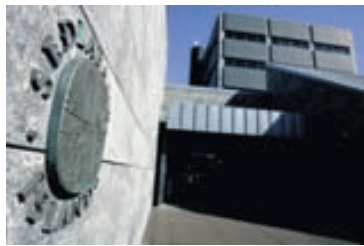
TAP Seðlabankinn lánaði Kaupþingi 500 milljónir evra og tók veð í FIH. Tugmilljarða króna tap verður á þeim viðskiptum.

Seðlabankinn taldi sig á hinn bóginn bundinn þagnarskyldu. Á það féllst úrskurðarnefndin eftir að hafa fengið afhenta greinargerð frá Seðlabankanum þar sem fjallað var um „stöðu á skuldabréfi sem tengist sölu á danska bankanum FIH og samninga sem staðið hefur verið að um breytingar og/eða uppgjör þess“. Í úrskurði hennar segir að „af enni þeirra er óhjákvæmilegt annað en