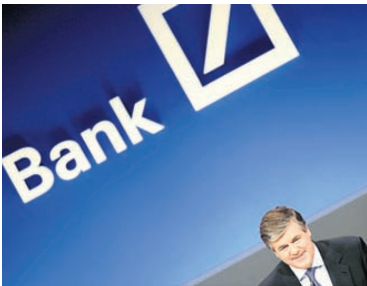
DEUTSCHE BANK Þýski bankinn hefur víðtækar heimildir til að fara með málefni Peru ehf., komi til viðvarandi vanefnda á skuld félagsins við hann. Josef Ackermann var forstjóri Deutsche Bank fram til loka maí síðastliðins.

Hins vegar er ekki leyfilegt samkvæmt lögum að skerða réttindi sjóðsfélaga í opinberu lífeyrissjóðunum og því eina leiðin til að laga tryggingafræðilega stöðu þeirra sú að hækka iðgjöld að óbreyttum lögum.