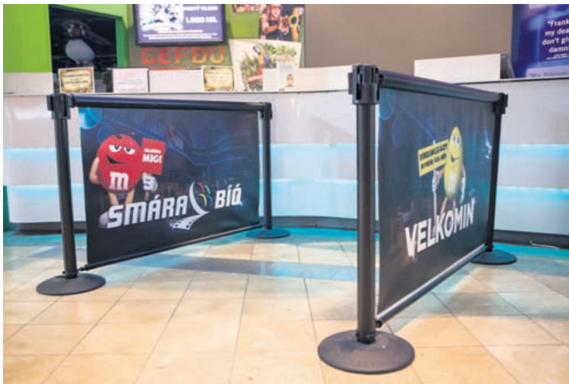
ROLLERSIGNS Skiltin eru þegar komin upp á ýmsum stöðum hérlandis. Á meðal þeirra aðila sem nýta þau til auglýsinga er Smárabíó í Smáralindinni.