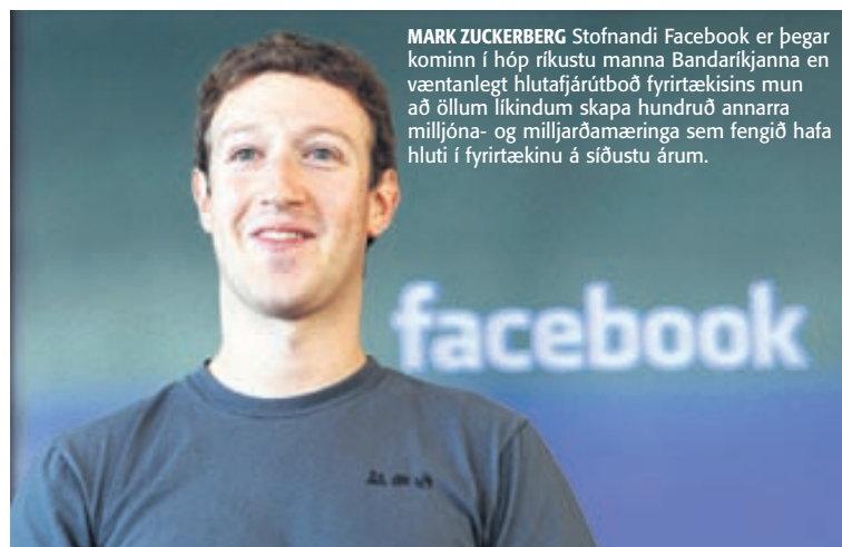
MARK ZUCKERBERG Stofnandi Facebook er þegar kominn í hóp ríkustu manna Bandaríkjanna en væntanlegt hlutfjárútbóð fyrirtækisins mun að öllum líkindum skapa hundruð annarra milljóna- og milljarðamæringa sem fengið hafa hluti í fyrirtækinu á síðustu árum.

Almennt virðast greinendur nokkuð bjartsýnir á gengi hlutfjárútböðsins. Sumir greinendur telja sig þó sjá líkindi með vænting-