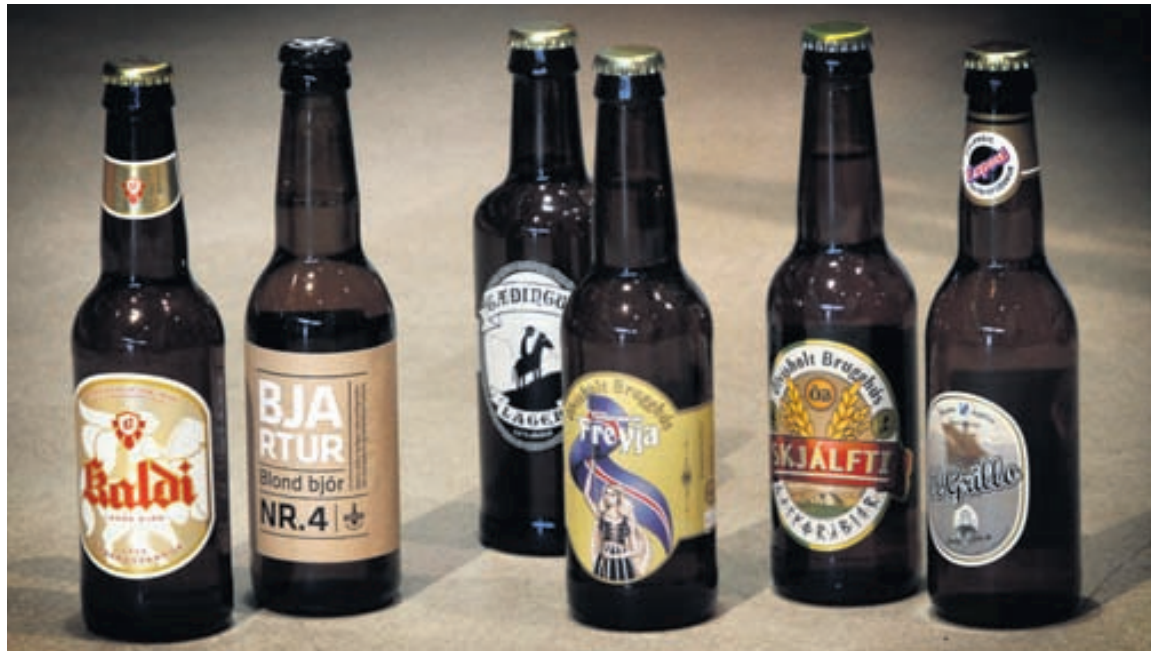
ÍSLENSK FRAMLEIÐSLA Íslenskum bjórtegundum sem seldar eru í Vínbúðunum hefur fjölgað um helming á síðustu árum.

Iceland Foods matvörukeðjan er langstærsta seljanlega eign Landsbankans, sem á 67% hlut í henni. Hún er með um 2,1% markaðshlutdeild í Bretlandi og selur vörur árlega fyrir á fimmta hundrað milljarða króna. Talið er að þrotabú Landsbankans og Glitnis vilji fá rúmlega 220 milljarða króna fyrir hluti sína. Ekkert hefur verið gefið upp opinberlega um hversu mörg né hversu há tilboðin voru. - þsj