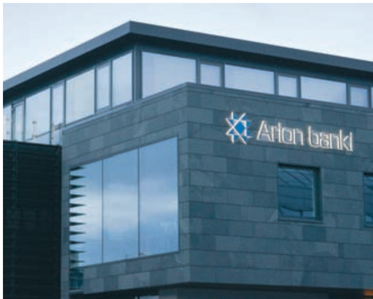
ARION BANKI Viðskiptavinum bankans býðst nú að kaupa greiðslufallstryggingar á vegum tryggingarisans Euler Hermes, sem er að meirihluta í eigu Allianz, og er með starfsemi í rúmlega 50 löndum.

Fjöldi Facebook-notenda var um síðustu áramót 845 milljónir og hafði aukist um 39 prósent á milli ári. Aukist fjöldi notenda á sama hraða næstu mánuðina verður hann 1 milljarður einhvern tímánn í sumar.