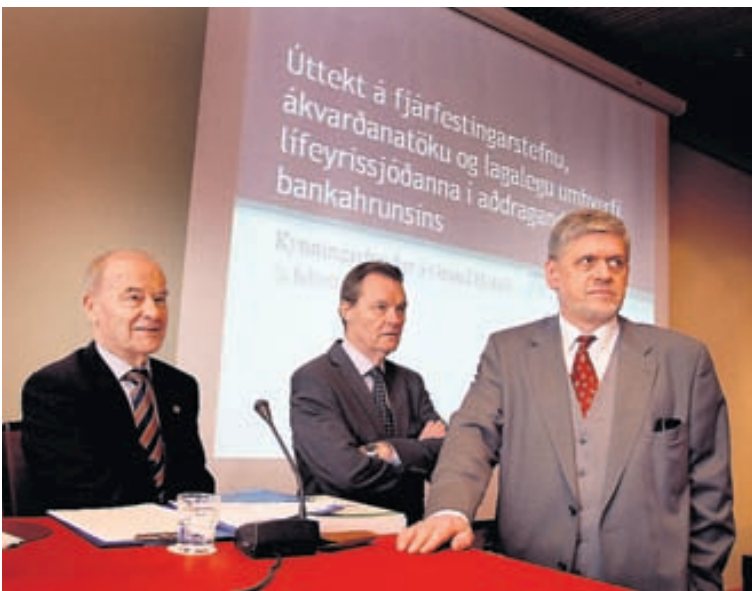
NEFNIN Skýrsla um starfsemi lífeyrissjóða í aðdraganda bankahrunsins var kynnt síðastliðinn föstudag.