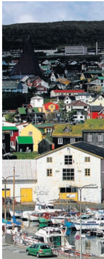
HIARTA ÞÓRSHAFNAR Í FÆREYJUM Forstjóri færeyska markaðs.

Føroya Banki bættist í hópin ári síðar og Eik Banki um mitt ár 2007, um sléttum tveimur árum eftir skráningu fyrsta færeyska félagsins. Fjórdi félagið, Atlantic Airways, var síðan skráð um miðjan desember 2007. Það var jafnframt síðasta nýskráningin hér á landi ef frá er skilin skrá-