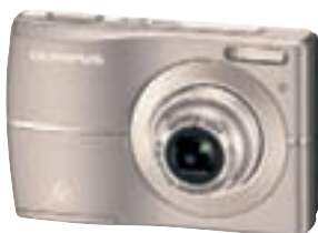
OLYMPUS FÓKUS Á GÆÐI OG GOTT VERÐ

512 5000 | STÖÐ2.IS | VERSLANIR VOGAÐENE | VERSLANIR OG ÞJÓUSTUVER SÍMANS 800 7000