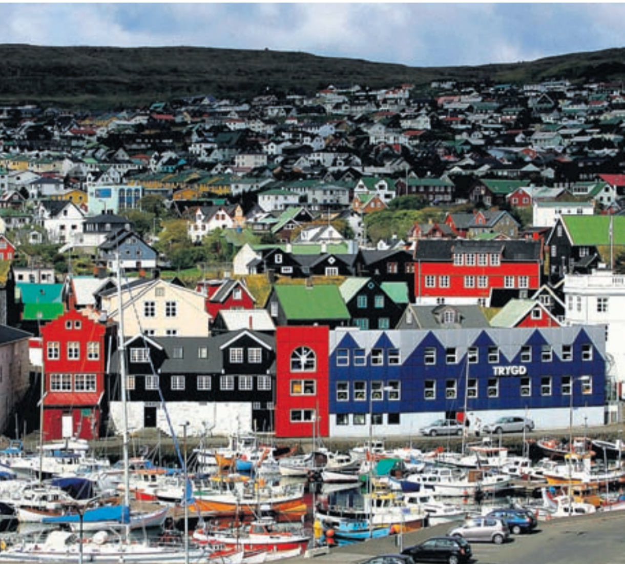
reyska verðbréfamarkaðarins reiknar með að fleiri færæysk fyrirtæki leiti fyrir sér með skráningu á markað hér þegar jafnvægi kemst á fjármála-