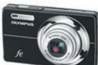
OLYMPUS MEÐ ALLT INN Í MYNDINN