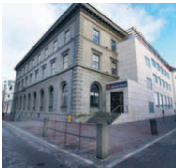
LANDSBANKINN Viðskipti með hlutabréf Landsbankans námu rúnum níu milljörðum í gær.