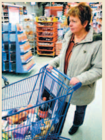
KEYPT Í MATINN Mesta verðbólgan innan aðildarríkja OECD mældist hér á landi í ágúst.