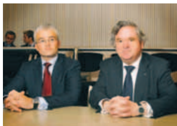
TILKYNNT UM KAUPIN Kaup ríkisins á 75 prósent hlut í Glitni urðu til þess að matsfyrirtækið Fitch lækkaði lánsþæfismatseinkunnir bankanna.

Lánsþæfismatseinkunn vegna langtímaskuldbindinga Kaupþings var lækkuð úr A- í BBB. Þá fer Landsbankinn úr A í BBB, Glitnir fer úr A- í BBB- og Straumur úr BBB- í BB+.