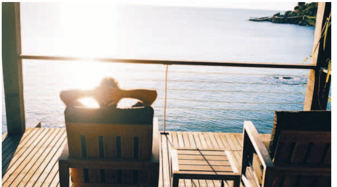
BJART YFIR Yfirskrift greinarhöfundar um að bjart sé framundan á við langtímahorfn en ekki horfur til skemmri tíma í hagkerfinu enda harkaleg aðlögun í gangi. Grunnstöðirnar séu hins vegar traustar og á þeim byggja björt framtíð.

Lífskjör Íslendinga undanfarin ár hafa verið mjög góð. Þau hafa því miður reynst betri en verðmætasköpun landsmanna stóð undir. Það þarf því eitthvað að draga úr neyslu um tíma meðan tekið er til eftir óreiðu undanfarinna ára og grynnkað á skuldum. Miklar erlendar skuldir verða þó ekki greiddar niður á skömmum tíma. Við munum súpa seyðið af þeim allengi. Þrátt fyrir þær er þó ekkert því til fyrirstöðu að við náum þegar til lengdar lætur að verja stöðu okkar meðal þeirra þjóða heims sem búa við best lífskjör. Það hlýtur að vera stefnan.