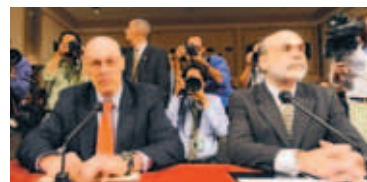
RÁÐHERRANN OG BANKASTJÓRINN Henry Poulson, fjármálaráðherra Bandaríkjanna og Ben Bernanke seðlabankastjóri.