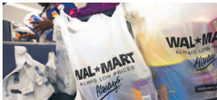
Í VERSLUN WAL-MART Bandaríska stórfyrirtækið Wal-Mart tók upp stefnu í umhverfis- og samfélagsmálum fyrir nokkrum árum. Að því er greinarhöfundur bendir á batnaði ímynd fyrirtækisins í kjölfarið, auk þess sem hagnaður þess jókst.

Að móta stefnu á sviði samfélagslegrar ábyrgðar er ferli sem er einstakur fyrir hvert og eitt fyrirtæki. En alþjóðleg samkeppni í viðskiptum er hörð og áherslur hafa verið að breytast eins og dæmið um Wal-Mart sýnir. Neytendur leggja aukna áherslu á gæði og uppruna vörunnar í stað þess að einblína á verð og sífellt fleiri vilja leggja sitt af mörkum til að viðhalda stöðugleika, minnka fátækt og ágang á náttúruna. Þess vegna er samfélagsleg ábyrgð ekki einungis góðmennska þeirra sem vilja gera heiminn betri, heldur einnig fjárfesting sem getur skilað beinum arði til hluthafa.