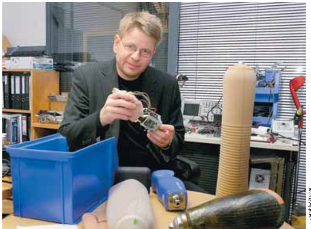
ÖSSUR SÉR Á BÁTI Áhugi erlendra fjárfesta á félaginu er mikill.

Alþjóðagjaldeyrissjóðurinn hefur viljað styrkja vinnslu tölfraeðlegra ganga fyrir markaðinn samkvæmt athugun sinni á Seðlabankanum.