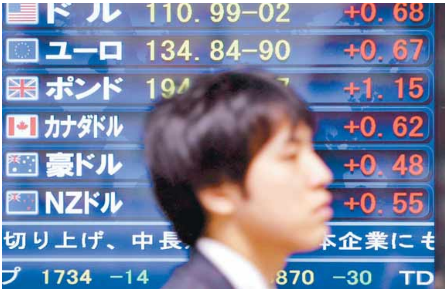
JAPANSKUR FJÁRFESTIR Hingað til hafa erlendir aðilar ekki verið umsvifamiklir á íslenskum hlutabréfamarkaði. Skuldabréfamarkaður og fyrirtækjalán hafa hins vegar aukist mikið og með þeim hætti taka erlendir aðilar þátt í íslensku viðskiptalífi.

Erlendir aðilar eiga um 13 prósent af hlutafé í Kauphöllinni eða fyrir um 190 milljarða króna, að Mosaic meðtalið. Flestir þessara erlendu aðila eru þó eignarhaldsfélög Íslendinga. Fjármunir þessara Íslendinga koma að einhverju leyti erlendis frá.