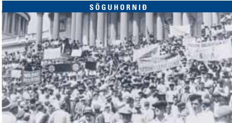
BÓNUSHERINN FYRIR UTAN ÞINGHÚSIÐ Tugir þúsunda hermanna söfnuðust saman fyrir utan þinghúsið í Washington og fóru fram á að fá greiddan bónus sem þeir töldu sig eiga inni frá því í fyrri heimsstyrjöldinni.