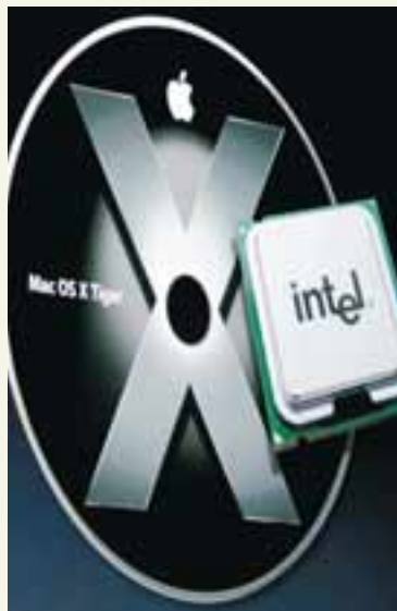
INTEL Í SÓKN Tekjur félagsins jukust milli ára.

Intel er bandarískt hátækniyrirtæki sem framleiðir meðal annars örgjörva og aðra íhluti í tölur. -dh