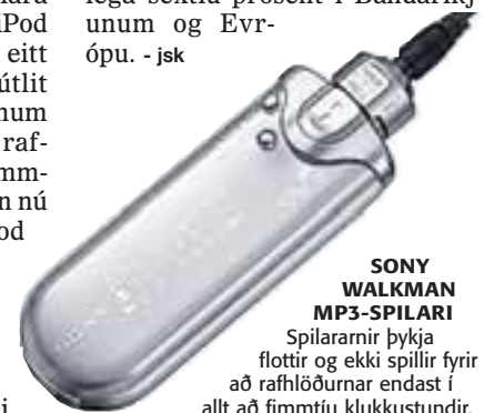
SONY WALKMAN MP3-SPILARI Spilararnir þykja flottir og ekki spillir fyrir að rafhlöðurnar endast í allt að fimm tíu klukkustundir.

Apple hefur hins vegar enn yfirburði er kemur að spilurum með enn meira minni og er markaðshlutdeild fyrirtækisins rúmlega sextíu prósent í Bandaríkjunum og Evrópu. - jsk