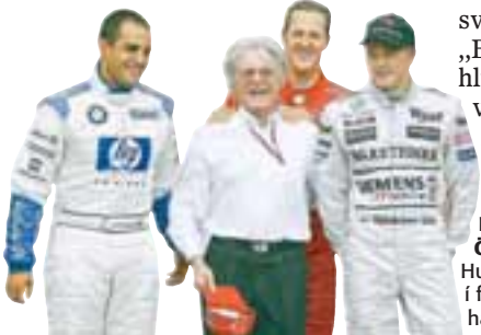
BERNIE ECCLESTONE MED VÖSKUM ÖKUPÓRUM Kínverski fjölmiðlarisinn Hutchison hyggst bjóða í 75 prósentu hlut í formúlu eitt. Þeir vilja þó fyrir alla muni halda Bernie Ecclestone góðum.

þekki ekki neitt í stað þeirra sem ég treysti?“ Innanbúðarmaður úr einum bankanna var þó ekki jafn svartsýnn fyrir hönd Hutchison: „Bankarnir vilja selja Hutchison hluti sína. Hutchison vilja hins vegar hafa Ecclestone með og hyggjast því gera allt til að halda honum góðum.“ -jrk