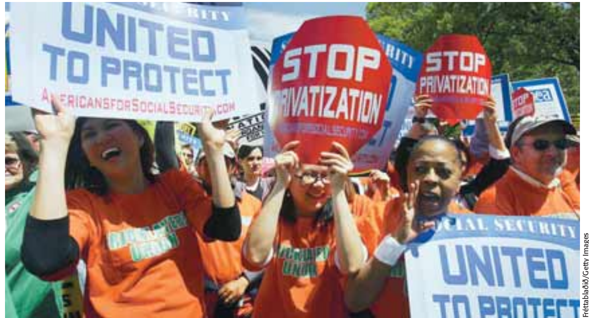
MÓTMÆLA EINKAVÆÐINGU Ekki eru allir ánægðir með einkavæðingarform ríkisstjórna víðs vegar um heiminn. Samkvæmt yfirmanni hjá fjármálafyrirtækinu Lehman Brothers hefur aðal ástæðan fyrir mikilli einkavæðingu í Frakklandi, Þýskalandi og Ítalíu verið sú að fá tekjur til að draga úr fjárlagahalla ríkissjóðs og/eða að borga niður opinberar skuldir. Megin tilgangurinn hafi ekki verið að minnka umsvif ríkisins á markaðnum og stuðla þannig að auknu frelsi, þótt það hafi auðvitað fylgt með í kaupunum og komið til góða.