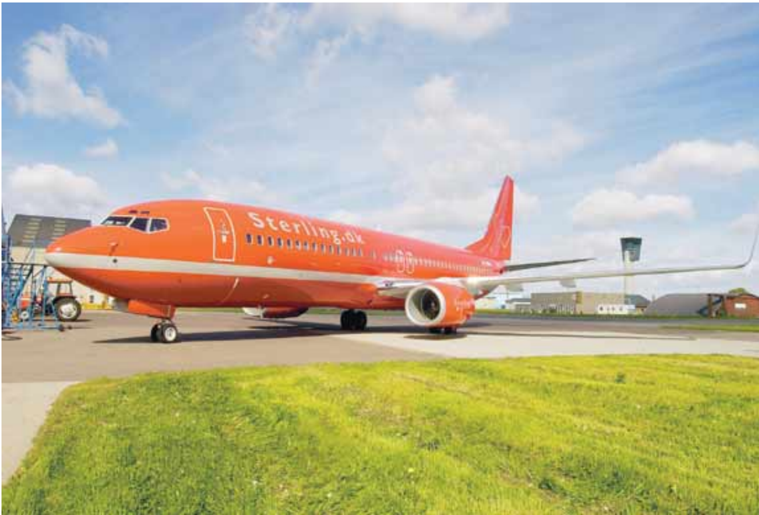
STERLING-FLUGFÉLAGIÐ Sterling-samstæðan hefur yfir 30 vélar í rekstri og flýgur til 89 áfangastaða. Velta félagsins verður yfir 60 milljarðar á þessu ári. Sterling er fjórða stærsta laggjaldaflugfélag Evrópu og það stærsta á Norðurlöndunum.