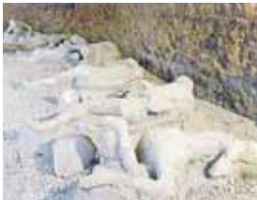
ÍBÚAR POMPEI Pompei er sannkölluð gullkista fyrir fornleifafræðinga. Á dögnum fannst þar silfurborðbúnaður í nánast fullkomnu ástandi.

Borðbúnaðurinn var falinn í brauðkörfu sem full var af vikri