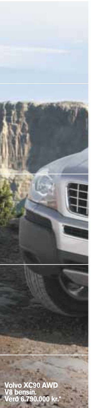
Volvo XC90 AWD V8 bensín. Verð 6.790.000 kr.*

Öryggi er lúxus – lifðu í lúxus. Komdu í Brimborg og spurðu sérfræðinga Volvo á Íslandi um lúxus sportjeppann Volvo XC90.