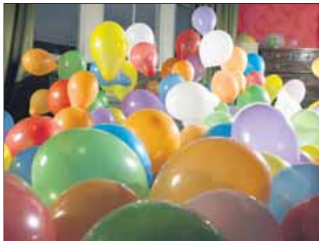
Hættulegt getur verið að anda að sér helíumi úr blöðrum.