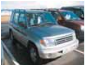
MITSUBISHI PAJERO PININ Nýskr: 09/2002, 1800cc 5 dyra, Sjálfskiptur, Grár - tvílitur, Ekinn 64.000 þ. Verð: 1.390.000