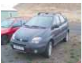
RENAULT SCENIC Nýskr: 04/2003, 2000cc 5 dyra, Fimmgíra, Dökkgrænn, Ekinn 57.000 þ. Verð: 1.730.000