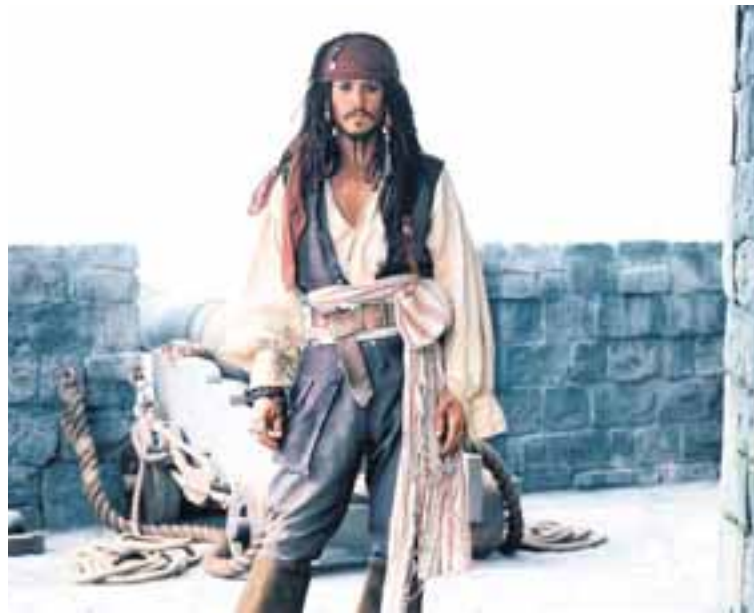
JOHNNY DEPP Depp var umdeildur í hlutverkinu meðal framleiðenda Pirates of the Caribbean-myndanna en hann fellur í kramið hjá áhorfendum ef marka má aðsóknarmetin.

sagði Jerry Bruckheimer, framleiðandi myndanna. Í ofanálag sló kvikmyndin metið á föstudeginum einum og hún er sú fyrsta til að hala inn hundrað milljónir dollara á einum degi. Næstar á lista yfir mest sóttu myndirnar eru Superman Returns og tiskugrínmyndin The Devil Wears Prada. The Curse of the Black Pearl, fyrsta myndin um sjóræningjana, naut mikilla vinsælda sem þó voru ekkert í líkingu við framhaldsmyndina. Johnny Depp fékk Óskarstilnefningu fyrir leik sinn í myndinni og greinilegt er að myndin fellur í kramið hjá áhorfendum þrátt fyrir að framleiðendum myndarinnar hafi ekki litist vel á Depp í upphafi.