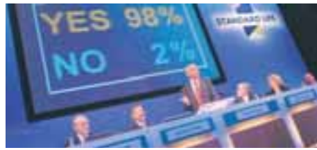
FRÁ HLUTHAFAFUNDI STANDARD LIFE Meirihluti hluthafa kaus um skráningu Standard Life fyrir tveimur árum.

Að sögn forsvarsmanna Standard Life var geysimikill áhugi á útboðinu. Við upphaf þess stóð gengið í 230 pensum á hlut en hækkaði fljótlega um fimmtán pens eða 6,5 prósent. Við lok útboðs stóð gengið í 241 pensum á hlut og er vonast til að með því hafi tekist að auka