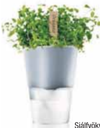
Sjálfvökvandi pottar frá kr. 2.340