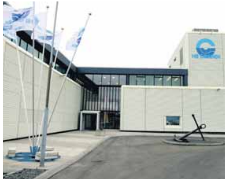
HB GRANDI Bæði Glitnir og Landsbankinn mæla með sölu út frá ólíkum forsendum.

Landsbankinn gaf einnig út nýtt verðmat á HB Granda á dögnum upp á 11,75 krónu á hlut en það miðast við að félagið sé leyst upp og aflheimildir seldar. Mælir bankinn með sölu bréfanna gangi áform stjórnar HB Granda eftir að færa félagið af Aðallista Kauphallar Íslands yfir á nýja iSEC-markaðinn.