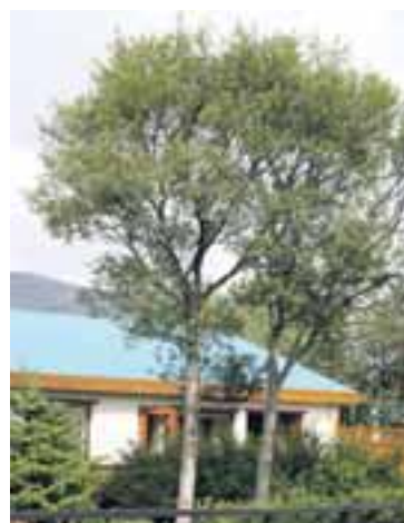
Birki er notað gegn hvers konar gigt.