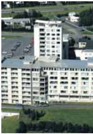
Útgjöld til heilbrigðismála námu 8 prósentum af vergri landsframléiðslu árið 1990 og höfðu hækkað í 10,2 prósent árið 2004.

Upplýsingarnar á heimasíðu Samtakanna byggja á nýttkomnu gagnasafni OECD-ríkjanna um útgjöld í heilbrigðismálum. Í skýrslunni kemur fram að haldi