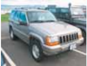
JEEP GRAND CHEROKEE Nýskr: 08/1999, 4000cc 5 dyra, Sjálfskiptur, Grár, Ekinn 119.000 þ. Verð: 1.250.000