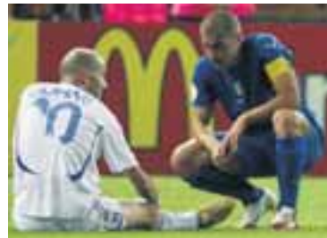
ÞEIR BESTU Zidane hvílir lúin bein eftir venjulegan leiktíma ásamt Fabio Cannavaro sem varð í öðru sæti í kjörinu.