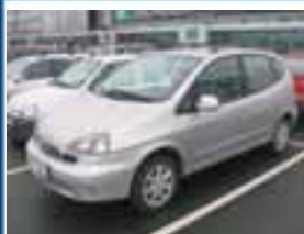
DAEWOO TACUMA Nýskr: 08/2003, 2000cc, 5 dyra, Fimmgíra, Grár, Ekinn 35.000 þ. Verð: 1.050.000

"Ég hef aldrei samið lag um Þingvelli...en við eigum Óxar við ána...eigum við ekki bara að láta það duga?" Bubbi Morthens