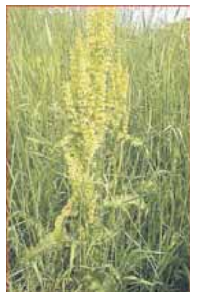
Njóli virkar á húðertingu og brunasár.