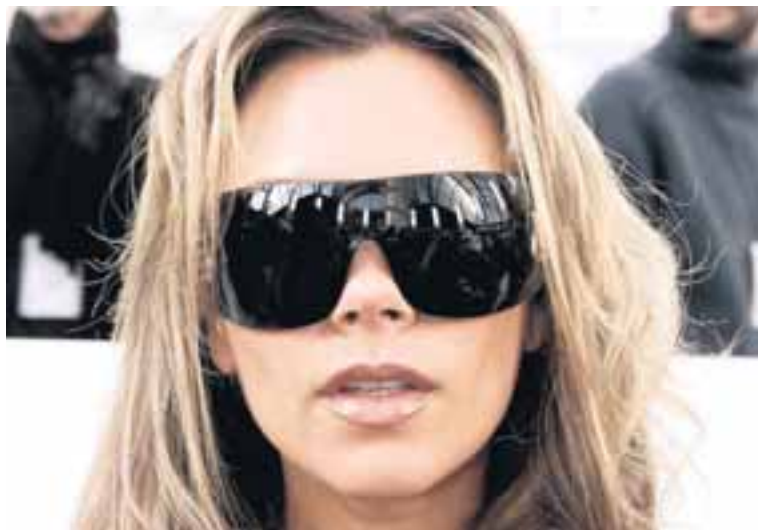
VICTORIA BECKHAM Sólgleraugu undir hennar nafni eru væntanleg í verslanir Harrods í Bretlandi á næstunni.

Victoria segist hafa tekið mið af tískunni á árunum 1940-1980 og eru því öll sólgleraugu í línunni í stærri kantinum. Victoria hefur áður látið til sín taka í hönnunarbransanum en hún hannar sína eigin línu af gallabuxum fyrir bandaríska fatamerkið Rock and Republic. ■