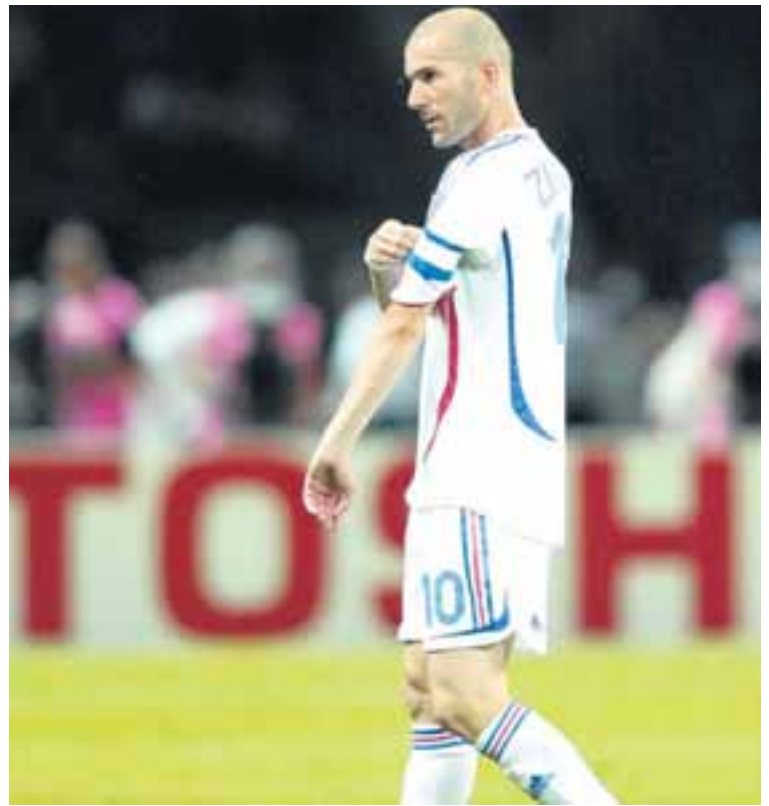
KEPPNI LOKIÐ Zinedine Zidane tekur af sér fyrirlíðabandið í sínum síðasta leik á ferlinum eftir að hafa fengið rauða spjaldið.