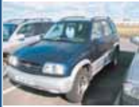
SUZUKI GRAND VITARA Nýskr: 04/2000, 2500cc 5 dyra, Sjálfskiptur, Blár, Ekinn 90.000 þ. Verð: 1.390.000