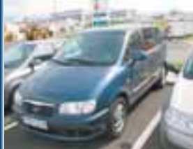
HYUNDAI TRAJET Nýskr: 09/2004, 2000cc 5 dyra, Sjálfskiptur, Blár, Ekinn 48.750 þ. Verð: 2.190.000