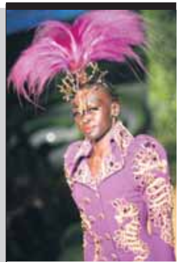
HÁTISKA Í PARÍS Þessi skrautlega fyrir-sæta sýnir hér hönnun Johns Galliano fyrir Christian Dior á Haute Couture-sýningunni sem haldin var í París.