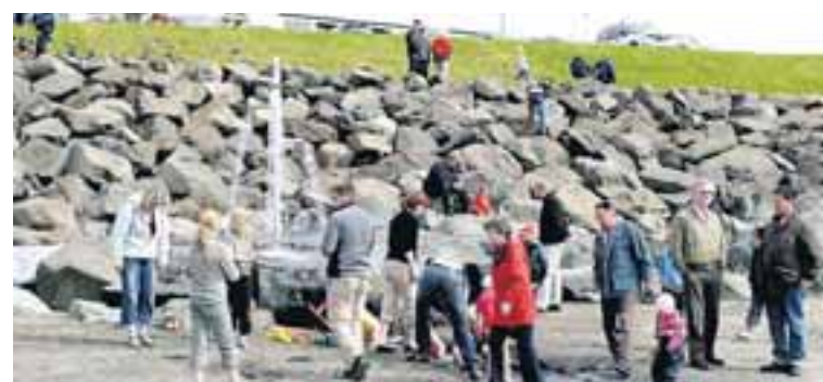
MARGT UM MANNINN Fjöldi fólks lagði leið sína á sandkastalakeppnina á Langasandi um helgina.