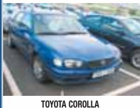
TOYOTA COROLLA Nýskr: 01/2000, 1800cc 5 dyra, Fimmgíra, Blár, Ekinn 109.000 þ. Verð: 790.000