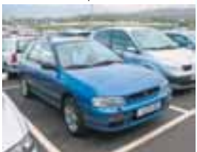
SUBARU IMPREZA Nýskr: 07/1997, 2000cc 5 dyra, Sjálfskiptur, Blár, Ekinn 107.000 þ. Verð: 560.000