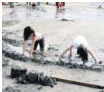
GAMAN AÐ BUSLA Það er gaman að busla á Langasandi enda ströndin einstök.