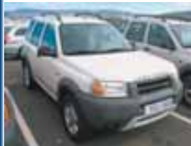
LAND ROVER FREELANDER Nýskr: 12/1999, 1800cc 5 dyra, Fimmgíra, Hvítur, Ekinn 122.000 þ. Verð: 990.000