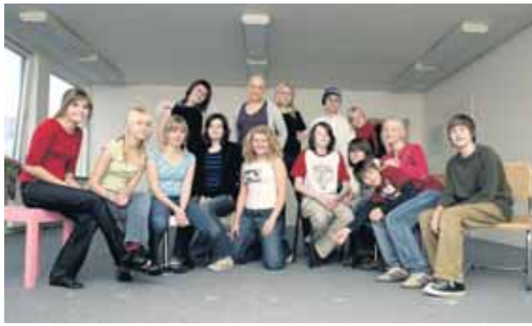
ÍSLENSKIR UNGLINGAR Fæstir þeirra þurfa sem betur fer að hafa áhyggjur af hungursneyð og alnæmi.