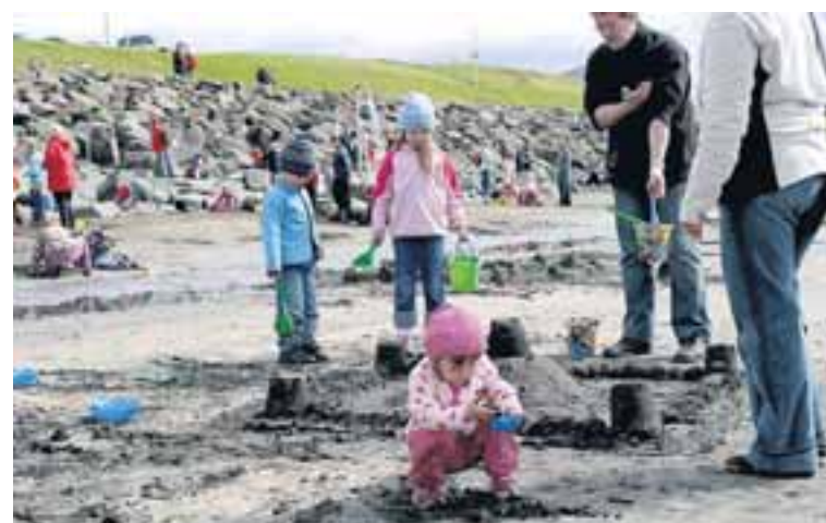
GAMAN SAMAN Sandkastalakeppnin sameinaði fjölskylduna og voru keppendur á öllum aldri.