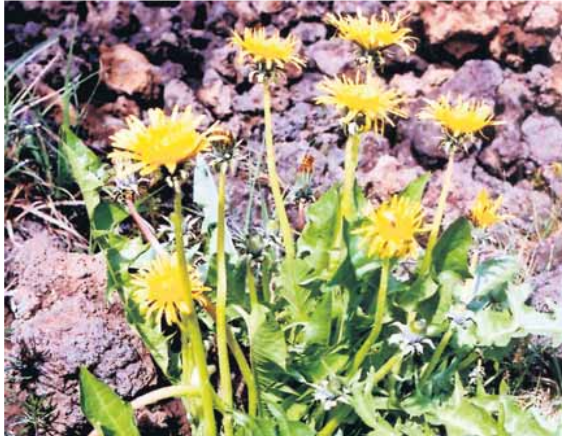
Túnfífill er ein mest notaða lækningajurtin hérlendis.