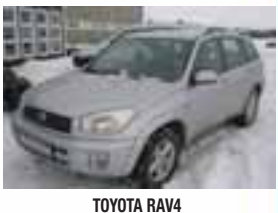
TOYOTA RAV4 Nýskr: 05/2003, 2000cc 5 dyra, Fimmgíra, Ljósgrár, Ekinn 77.000 þ. Verð: 1.860.000