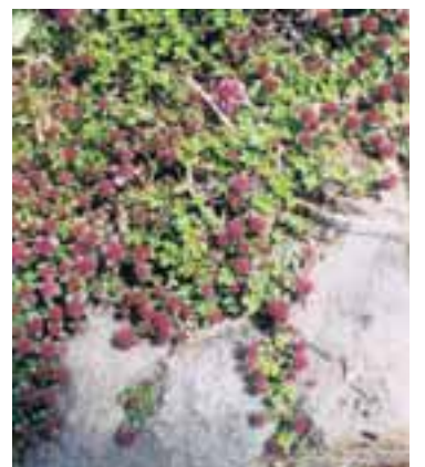
Blóðberg er mikið notað við flensu.

Njóli: Í smyrslformi er hann góður við húðertingu og brunasár. Einnig er hann góður á sár sem gróa illa og ígerð.