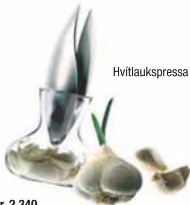
Hvítlaukspressa m/glasi kr. 5.450