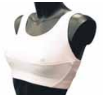
Íþróttatoppur frá Casall sem hægt er að fá heilan eða hnepptan að aftan. Þannig er hægt að þrengja toppinn eftir þörfum. Toppurinn fæst í Intersport og kostar 4.990 krónur.

unni að brjóstin séu að detta af. Því er um að gera að vanda valið vel, kaupa íþróttatopp sem veitir brjóstunum góðan stuðning og vera fær um að hoppa og skoppa að vild.