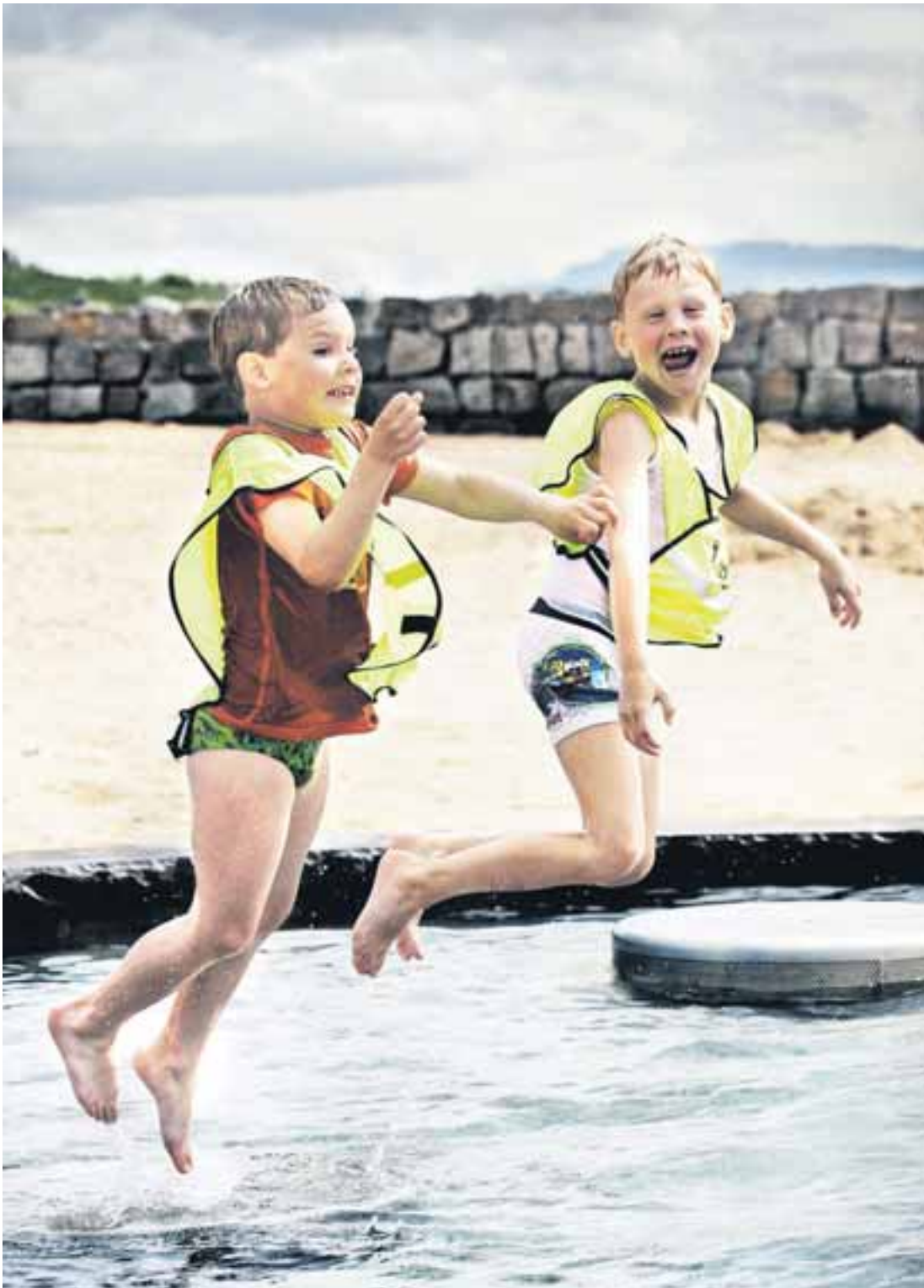
Þessir kátu strákar af leikskólanum Rauðuborg skemmtu sér ævintýrlega vel í heita pottinum í Nauthólsvík á dögnum.