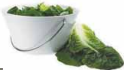
Salatskál 26 cm kr. 5.470