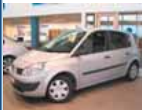
RENAULT SCENIC II Nýskr: 05/2005, 1600cc 5 dyra, Fimmgíra, Ljósgrár, Ekinn 16.960 þ. Verð: 1.990.000