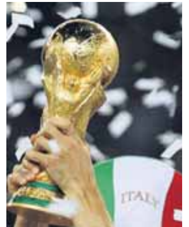
BIKARINN EFTIRSÓTTI Keppnin um heimsmeistaratilinn í knattspyrnu hefur bein áhrif á sölu ýmissa fyrirtækja á Íslandi.

Veitingastaðir fóru ekki varhluta af aukinni sölu í kringum HM, enda kusu margir að láta aðra sjá um matinn svo þeir gætu horft óáreittir á fótboltann. Pizzukeðjan Domino's auglýsti sérstakt HM-tilboð og fylgdi því aukin sala. „Það var yfirleitt mikið að gera hérna rétt fyrir leiki og í hálfleik, því margir pöntuðu mat til að geta sótt