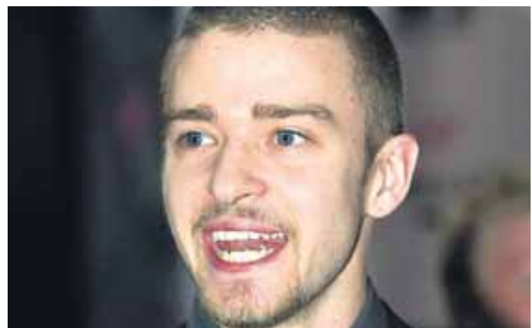
JUSTIN TIMBERLAKE Fastagestur í Playboy partíum.

Að sögn Hughs Hefner, stofnanda og útgefanda tímaritsins Playboy, er söngvarinn knái, Justin Timberlake, fastagestur í hinum svokölluðu Playboy partíum. „Hann mætir alltaf,“ segir Hefner en hann er þekktur fyrir að halda risastór parti á heimili sínu og eru þau búin að skipa sér fastan sess í skemmtalífinu í Hollywood. Einnig segir Hefner að í þessum partíum sé allt fallegasta fólk heims saman komið og því ekki skritið að þau séu eftirsótt. ■