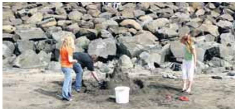
GLÆSISMIÐ Þessir ungu krakkar byggðu einn stræsta og flottasta sandkastala sem sést hefur á Langasandi.