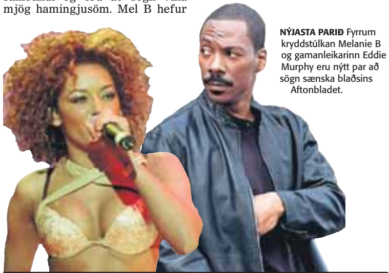
NÝJASTA PARIÐ Fyrrum kryddstúlkán Melanie B og gamanleikarinn Eddie Murphy eru nýtt par að sögn sænska blaðsins Aftonbladet.

lítið verið í sviðsljósinu undanfarn ár og hefur sólóferill hennar ekki gengið sem skyldi. Þessa dagana er hún að láta reyna á leikhæfileika sína í Bandaríkjunum og svo er fyrirhuguð endurkoma stallsysturanna í hljómsveitinni Spice Girls á næstunni. ■