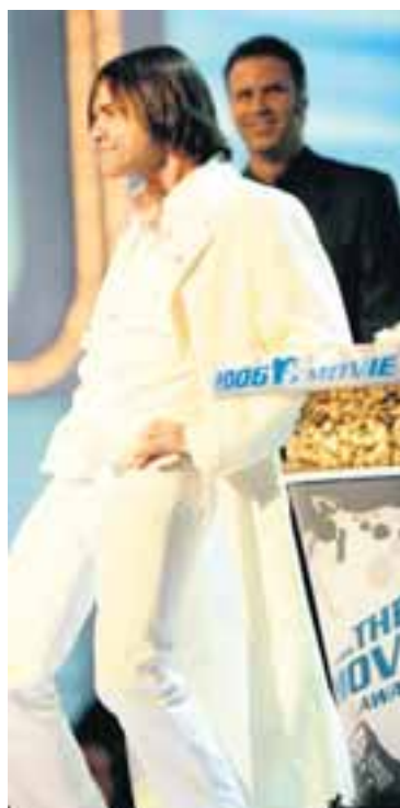
JIM CARREY Þegar Jim Carrey og Jenny McCarthy hittast er engu líkara en að þau séu að leika í rómantískri gamanmynd, segja sjónarvottar.