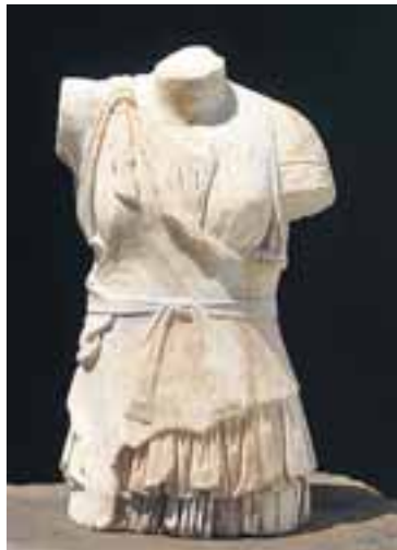
ARTEMIS Gyðjan má víst muna fífil sinn fegri, en aldrei er að vita nema höfuð hennar snoppufrítt leynist enn í rústunum.