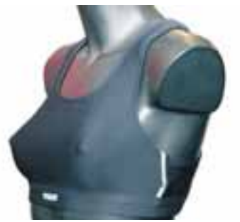
Íþróttatoppur frá Röhnisc sem er gerður úr mjög þéttu teygjuefni. Hann fæst í Intersport og kostar 3.490 krónur.

Það er ekki gott að hlaupa og hafa það á tilfinningu-