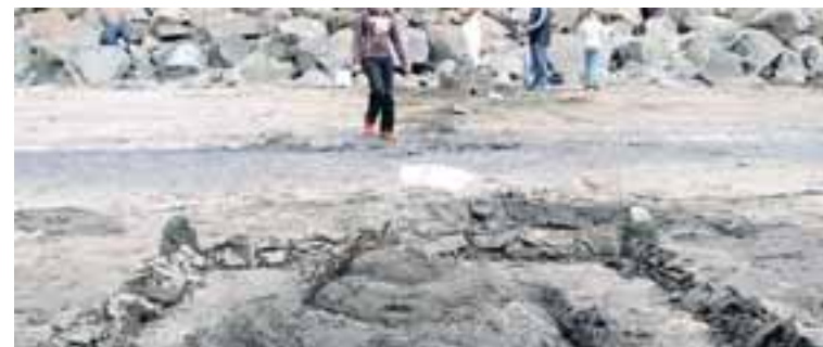
HÖLL Kastalarnir voru af ýmsum stærðum og gerðum og minntu sumir á arabískar hallir.