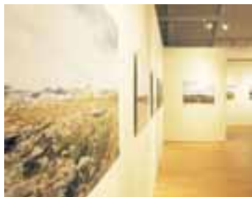
HRAUNIÐ Í ÍSLENSKRI SAMTÍMALIST Fjölbreytileg verk er að finna á sýningunni í Hafnarborg.