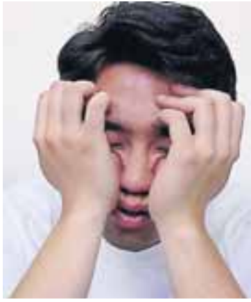
Þeir sem sofa of lítið eru líklegri til að vera yfir kjörþyngd.