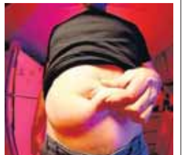
Mikil kvíðfita getur aukið áhættu á ristilkrabbameini.

Samkvæmt nýrri rannsókn kemur fram að þeir sem bera meiri kvíðfitu eru líklegri til að fá ristilkrabba. Rannsóknin var gerð í níu Evrópulöndum og tóku um 370 þúsund einstaklingar þátt. Niðurstöðurnar sýndu að bæði konur og karlar sem höfðu meiri fitu um sig miðja voru líklegri til að fá ristilkrabba en þeir sem höfðu grannt mitti. Kvíðmiklir karlar voru 39 prósentum líklegri og konur 48 prósent líklegri til að greinast með ristilkrabbamein. Hlutfall milli mittis og mjaðmaummáls gefur góða vísbendingu um kvíðfitu og er jafnvel betri mælieining við mat á