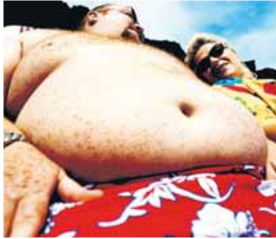
Offita verður æ oftast hluti af orsök örorku.

Í greininni kemur fram að offita verður æ oftast orsök örorku. Tilfellum þar sem offita var meðal sjúkdómsgreininga, jafnvel þótt hún væri ekki aðalorsök, hafði fjölgað mjög mikið. Niðurstöðurnar benda til þess að Íslendingum sem glíma við offitu fari fjölgandi.