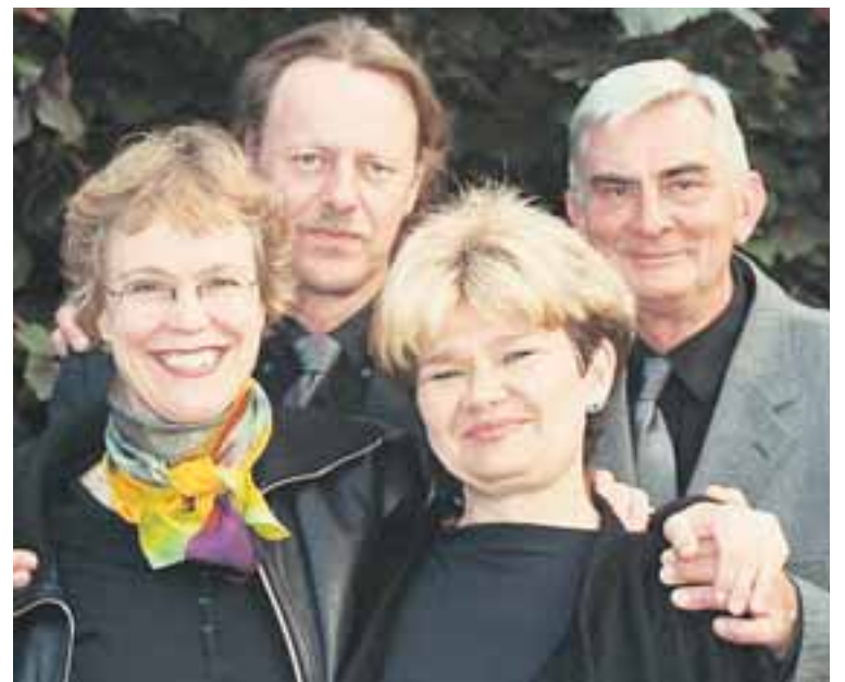
FYRSTU SUMARTÓNLEIKARNIR Í SIGURJÓNSSAFNI Fluttur verða fjórir kvartettar fyrir flautu, fiðlu, víolu og selló eftir Mozart.

Á sumarsýningu safnsins gefur að líta skúlptúra og portrett eftir Sigurjón Ólafsson en á þjónustutíma þess er jafnan boðið upp á kaffi og heimabakað meðlæti á kaffistofunni en hún er