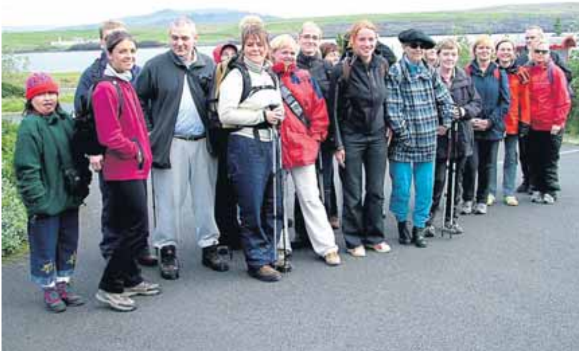
GAMAN SAMAN Síðasta fimmtudagskvöld var boðið upp á göngutúr á Esjuna og hér má sjá brot af hópnum sem tók þátt í þeirri ferð. Næsta fimmtudagskvöld verður farið út í Viðey en hvalaskoðun og hestaferð er einnig á döfinni.