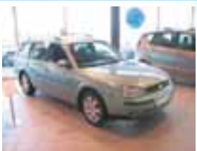
FORD MONDEO Nýskr: 03/2001, 2000cc 5 dyra, Sjálfskiptur, Grænn, Ekinn 93.000 þ. Verð: 1.190.000