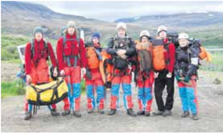
VÍGALEGUR HÓPUR Smáskvettur úr fossinum urðu að steinhnullungum þegar komið var niður í 100 metra hæð.