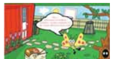
LEIKJASÍÐA SORPU Yngsta kynslóðin ætti að geta skemmt sér vel á heimasíðu Sorpu.