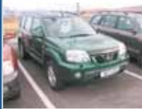
NISSAN X TRAIL Nýskr: 07/2003, 2000cc 5 dyra, Sjálfskiptur, Grænn, Ekinn 31.000 þ. Verð: 2.190.000