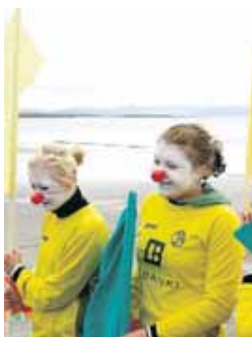
KYNJAVERUR Kynjaverur í Skagabúningum mættu á Langasand.