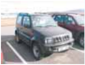
SUZUKI JIMNY JLX Nýskr: 06/2001, 1300cc 2 dyra, Fimmgíra, Svartur, Ekinn 92.000 þ. Verð: 780.000