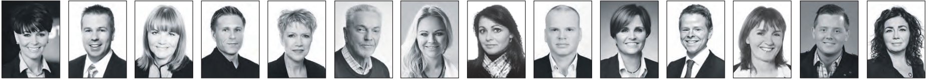
Hafdis Sölustjóri 820 2222 | Sigurður Fasteignasali 898 6106 | Dórothea Fasteignasali 898 3326 | Þorsteinn Fasteignasali 694 4700 | Jóhanna Kristín Fasteignasali 698 7695 | Árni Ólafur Fasteignasali 893 4416 | Berglind Fasteignasali 694 4000 | Póra Fasteignasali 822 2225 | Þorgeir Fasteignasali 696 6580 | Sigríður Fasteignasali 699 4610 | Garðar Fasteignasali 899 8811 | Halla Fasteignasali 659 4044 | Alexander Sölufulltrúi 695 7700 | Hrönn Sölufulltrúi 692 3344