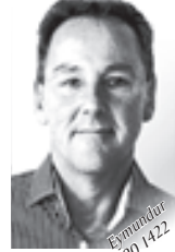
Eymundur 690 1422