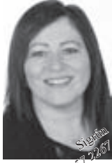
Sigbjörn 857 2287