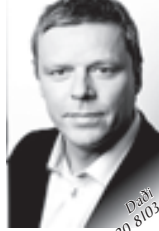
Dab 820 8103