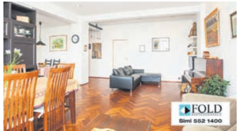
Opið hús verður að Vesturgötu 73 á miðvikudag á milli kl. 17-17.30.

Rúmgott hjónaherbergi með nýjum skáp. Frá hjónaherbergi er gengið út á svalir í suðaustur. Korkur er á gólfi. Tvö barnaherbergi með kork á gólfi.