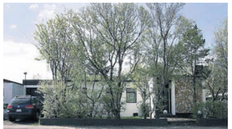
Einbýlishús ásamt bílskúr við Faxatún í Garðabæ.

Opið er inn í stofu og borðstofu. Þaðan er útgengt út í stóran, fallegan garð í góðri rækt. Geymsluskúr á lóðinni.