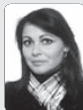
Póra Lögg. fasteignasali GSM: 822 2225