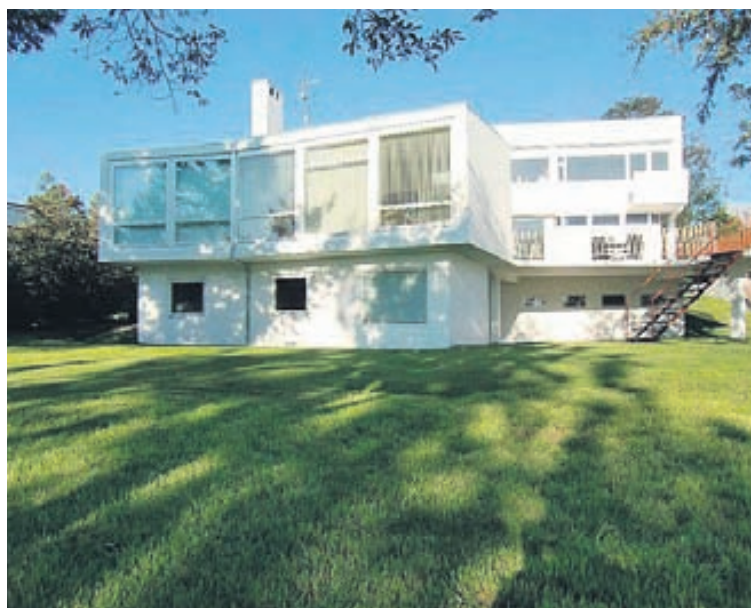
Húsið er byggt árið 1958 en búið er að endurnýja það að stórum hluta.

Aðalíbúðin er á tveimur hæðum og komið inn í hol um aðalinnangang