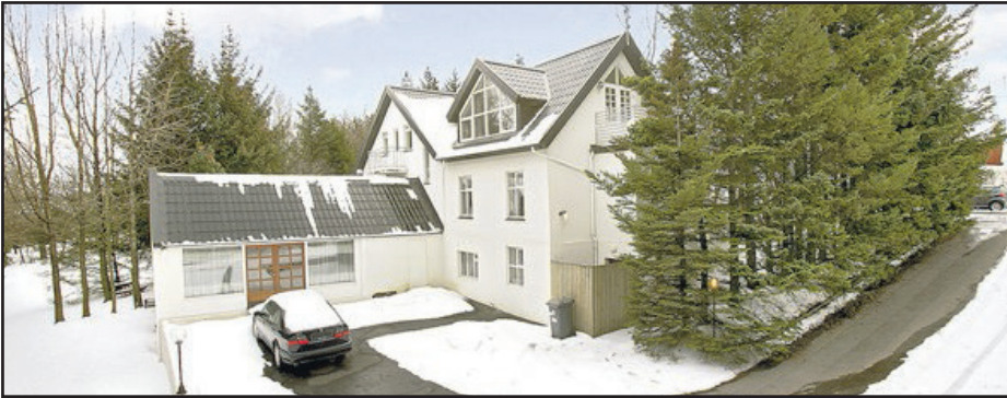
Sogavegur - 108 Rvk

Fasteignasala . Íbúðarhúsnæði . Skúlatún 2 . 105 Rvk