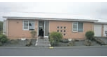
Lækjarhjalli - 200 Kópv

81,7 femetra 2ja herbergja íbúð við Njálsgötu í Reykjavík. Íbúðin skiptist í á efri hæð: anddyri, eldhús, samliggjandi stofa og borðstofa. Á neðri hæð er baðherbergi og svefnherbergi. Nánari uppl. á skrifst.