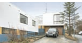
Hrauntunga - 200 Kópv

Vel skipulagt og gott 150 fm. parhús á frábærum stað, innst í botlanga á vinsælum stað í Háaleitishverfi. Góðar stofur, þrjú svefnherbergi. Innbyggður bílskúr, falleg og skjólsæl lóð. Einstök staðsetning. Stutt í góða skóla, leikskóla, verslanir og þjónustu.