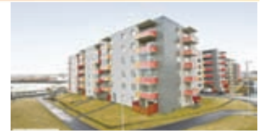
Skípalón - 220 Hafnf.

Til sölu lóð með sökkli og teikningum af 336,4 fm glæsilegur einbýli. Áhvilandi hagstætt lán.