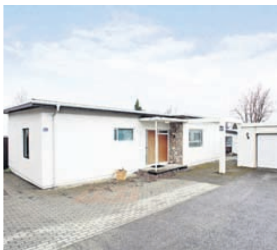
Húsið er á besta stað í suðurhlíðum Kópavogs.