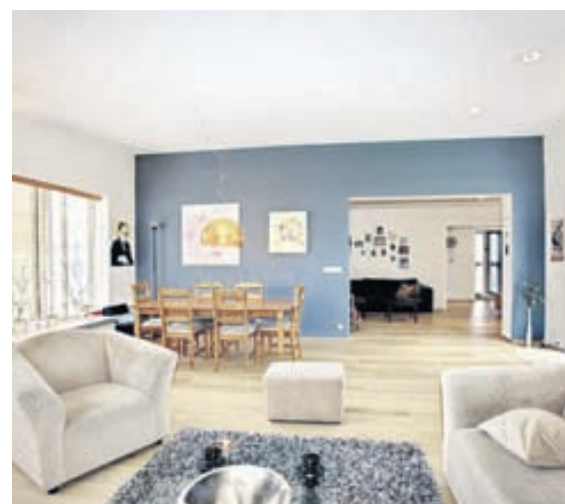
Eignin er vel skipulögð og mikið endurnýjuð.