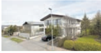
Heiðarás - 110 Rvk

Neðri sérhæð og kjallara, tvær íbúðir, með bílskúr. Um er að ræða rúmgóða 109 fm. 4ra-5 herbergja neðri sérhæð ásamt 24,5 fm. bílskúr og 84,5 fm. 3ja herbergja íbúð í kjallara með sérinnangang. Samtals 218 fm. Verð 39,8 millj.