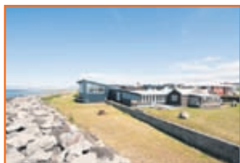
Marbakk, Hákotsvör 9