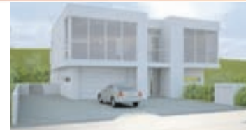
Örvasalir - 201 Kópv.

Um er að ræða 2ja, 3ja og 4ra herbergja íbúðir sem skilast fullbúnar án gólfefna. Flisar á þvottahúsi og baðherbergi. Stærðir frá 83 - 132 fm. Vandaðar innréttingar og allur frágangur til fyrirmyndar. Lyftuhús. Bílageymsla. Verð frá 21,2