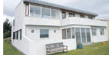
Suðurhús - 112 Rvk

Rúmgott einbýli á tveimur hæðum, húsið skiptist í jarðhæð með anddyri, gesta wc., stórt herbergi, stíghús, þvottahús og bílskúr. Efri hæð skiptist í stofu, borðstofu, eldhús, setustofu, svefnherbergisgang, þrjú svefnherbergi og baðherbergi.