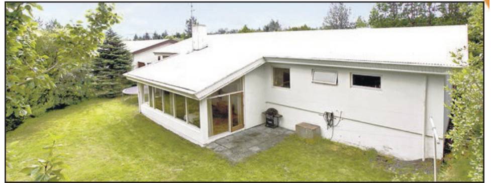
Lágholt - 270 Mos

Til sölu virðulegt 581 fm einbýlishús á stórrí skógi vaxinni lóð með skemmtilegri aðkomu miðsvæðis í borginni. Í húsinu eru nú stórar og fallegar stofur, eldhús, 3 baðherbergi, fjölmörg herbergi, íþróttasalur, heitur pottur, gufa, mikið geymslurými, þvottahús o.fl. Húsið stendur á 2.300 fm skógi vaxinni lóð og því fylgir einnig önnur samliggjandi 3.700 fm lóð, einnig skógi vaxin. Nánari uppl. á skrifst.