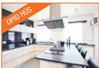
Engjasel 11 m bílskýli