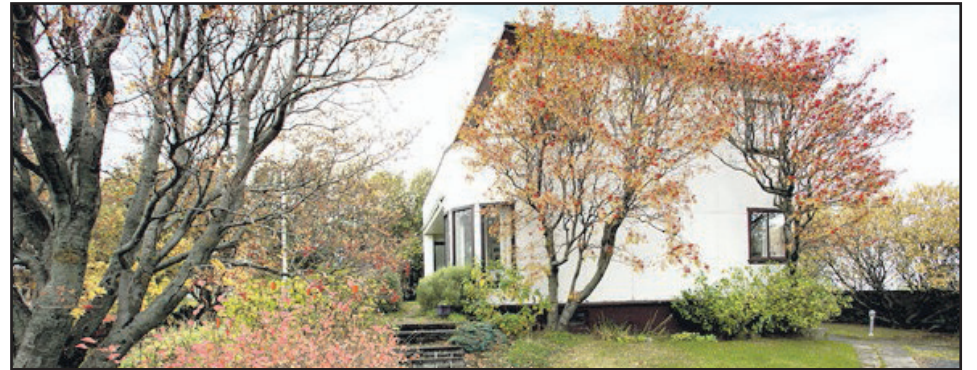
Bauganes - 101 Rvk

Stórglæsilegt steinsteypt 239,2 fm. endaraðhús á bryggjukantinum í Bryggjuhverfinu í Grafarvogi. 3-4 svefnherbergi, góðar stofur og stórar suðursvalir. Vel hannað, vandaðar innréttingar og gott skipulag. Nánari uppl. á skrifst.