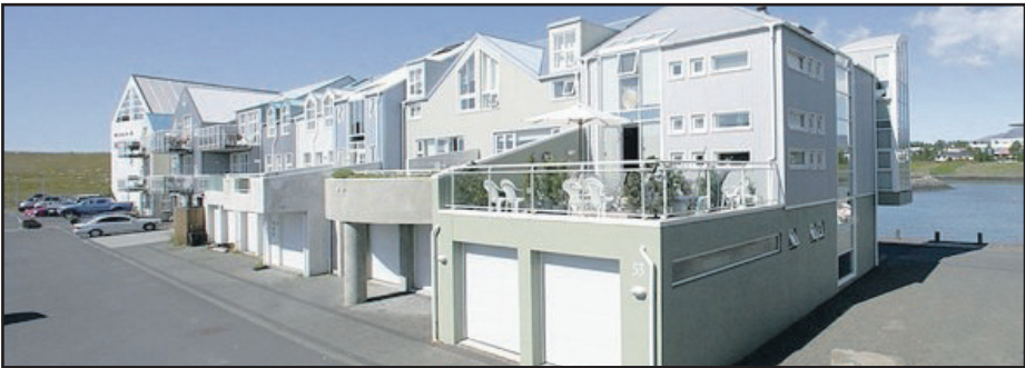
Naustabryggja - 110 Rvk

Notalegt og gott 198 fm. einbýlishús, vel staðsett innst í lokaðri götu í gróðursælu og barnvænu umhverfi. Fjögur svefnherbergi. Arinn. Gróinn garður. Stutt í skóla, íþróttastöðu, hesthús, verslanir og þjónustu. Verð kr. 43.900.000.-