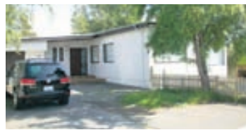
Hrauntunga - 200 Kópv

Glæsileg 162,8 femetra íbúð við Brúnaveg. Íbúðin er teiknuð af Sigvalda Thordarson og er lýsandi dæmi um fallega hönnun og gott stílbragð þess tíma. Velskipulögð og rúmgóð eign. Nánari uppl. á skrifst.