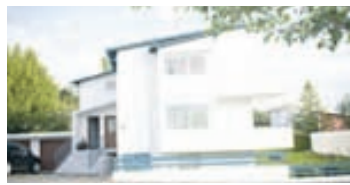
Brúnavegur - 105 Rvk

Vel staðsett og notaleg efri sérhæð og hluti af jarðhæð ásamt rúmgóðum bílskúr, samtals 220,5 fm. í falllegu húsi sunnan megin í austurbæ Kópavogs. Eignin skiptist nú í tvær íbúðir, báðar með sérinnangi.