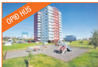
Ársalir 1, bílskýli