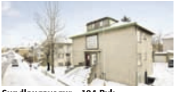
Sundlaugavegur - 104 Rvk

Um er að ræða 239 fm endaraðhús innst í botlanga. Eigninni hefur verið vel viðhaldið. Mikið útsýni er úr stofunni. 39,9 millj.