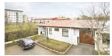
Háaleitisbraut - 108 Rvk

Um er að ræða rúmgóða og vel skipulagt 161,8 fm endaraðhús á tveimur hæðum, ásamt 28,8 innbyggðum bílskúr, samtals 190,6 fm, á frábærum útsýnisstað við hraunjaðarinn í Hafnafirði.