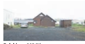
Dalaping - 203 Kópv

Um er að ræða glæsilega 3ja herbergja 120 fm íbúð á 2. hæð í fjölbýli ásamt staði í bílageymslu í Skípalóni, Hafnafirði. 50 ára og eldri. Nánari uppl. á skrifst.