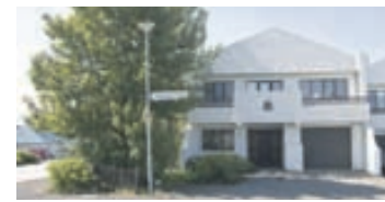
Hraunbrún - 220 Hafnf

Um er að ræða rúmgott einbýli á einni hæð við Hrauntungu í Kópavogi. Samkvæmt Fasteignaskrá er húsið skráð 185,4 fm að stærð auk 37,6 fm bílskúrs. Fimm svefnherbergi, góðar stofur og nýlegur pallur til suðurs. Laust strax.