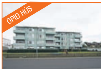
Logafold 22, bílskýli