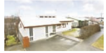
Hverafold - 112 Rvk

320 fm stórglæsilegt og vandað einbýlishús í rólegur og fjölskylduvænu hverfi á frábærum útsýnisstað í Grafarvoginum. Sérsmíðaðar, fallegar innréttingar og vönduð gólfefni.