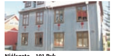
Njálsgata - 101 Rvk

Einbýlishús á tveimur hæðum við Dalaping í Kópavogi. Húsið skiptist í forstofu, baðherbergi, kalda geymslu, eldhús, stofu og þrjú svefnherbergi. Verð 23 millj.