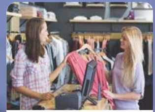
Verslun og þjónusta