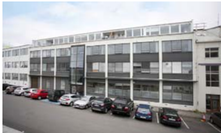
📍 BRAUTARHOLT 6 105 REYKJAVÍK