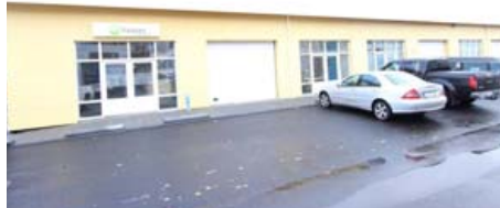
📍 AUÐBREKKA 1 200 KÓPAVOGUR