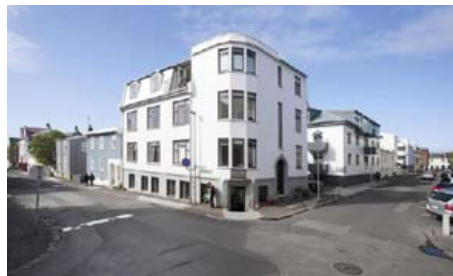
📍 BERGSTAÐASTRÆTI 14 101 REYKJAVÍK