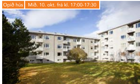
Opið hús | Mið. 10. okt. frá kl. 17:00-17:30