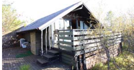
📍 VÍKURBRUNNUR 34 GRÍMSNES OG GRAFNINGSHR.