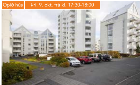
Opið hús | Þri. 9. okt. frá kl. 17:30-18:00