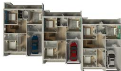
📍 SJAFNARBRUNNUR 5-19 113 REYKJAVÍK