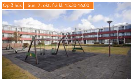
Opið hús | Sun. 7. okt. frá kl. 15:30-16:00