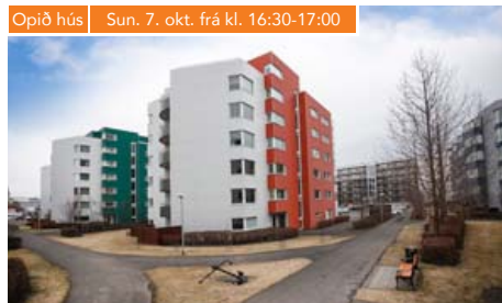
Opið hús | Sun. 7. okt. frá kl. 16:30-17:00