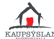
Kaupsyslan — 571 1800 kaupsyslan.is