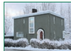
Þingvallastræti 25 Virðulegt og vandað einbýlishús á horni Þingvallastrætis og Byggðavegar. Stór og gróin lóð. Stærð 346,4fm þar af bílskúr og geymsla 53,6fm Verð 58,9millj.