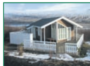
Gata mánans Nýlegt orlofshús með góðri suður verönd og heitum potti við Kjarnaskóg við Bæjar-mörkin á Akureyri. Stærð 82,0fm Verð 28,5millj.