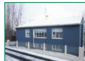
Munkaþverástræti 34 4-5 herbergja sérhæð stutt frá miðbæ Akureyrar. Stærð 155,9fm Verð 23,9millj. Skoða skipti á eign í Reykjavík.