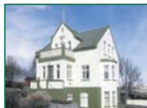
Klapparstígur 1 Fallegt 6-7 herbergja einbýlishús með aukaíbúð á góðum útsýnisstað við Klapparstíg á Akureyri. Eignin hefur fengið gott viðhald og er í góðu ástandi. Eignin er skráð á tvö fastanúmer. Stærð 222,3fm Verð 57,0millj.