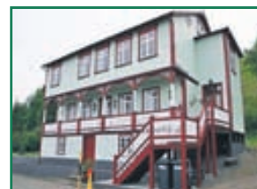
Aðalstræti 16 Skemmtileg 6 herbergja íbúð í fallegu uppgerðu húsi í Innbænum sem skiptist í hæð og ris. Stærð 173,4fm. Húsið stendur á 2.217fm eignar lóð.