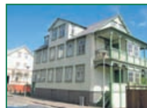
Hafnarstræti 86 Mikið uppgerð 3ja herbergja risíbúð í virðulegu húsi í miðbæ Akureyrar. Stærð 85,1fm Verð 14,9millj.