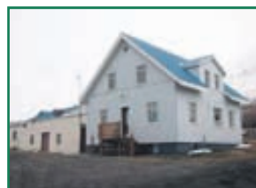
Garðshorn - Hörgárdal Jörðin Garðshorn í Hörgárdal með eða án bústofns og fullvirðisréttar. 100 ha innan girðingar þar af um 30 ha ræktað land. Töluvert uppgerð íbúðarhús og góð úti-hús. Jörðin er um 20km frá Akureyri Verð 63,0millj á bústofns og fullvirðisréttar.