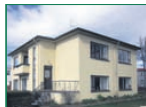
Grænagata 2 e.h. Mikið endurnýjuð 4ra herbergja efri hæð með sér inngang og stakstæðum bílskúr. Tívalinn orlofsíbúð. Stærð 176,7fm þar af bílskúr 24,6fm Verð 26,5millj.